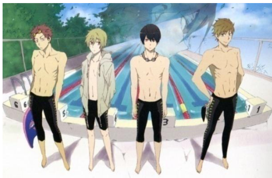
Figura 1 - Primeiro esboço dos personagens de Free! feito por Nishiya 18

mais pessoal, para a decisão de tornar os personagens mais velhos era a sua paixão por desenhar belos corpos masculinos. Tomada a decisão, a produção de Free! começou.