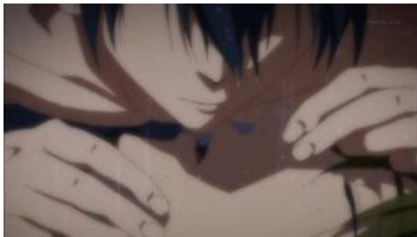
Figura 9- Haruka aproxima-se do amigo para uma respiração boca a boca