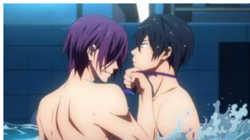
Figura 12 - Rin se enfurece com Haruka