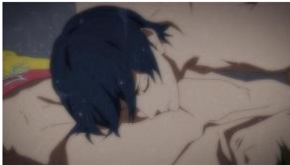
Figura 8 - Haruka sente o batimento cardíaco de Makoto