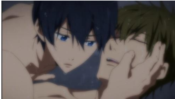
Figura 7 -Haruka toca o rosto do amigo afogado

boca, ainda que inconclusa, entre os dois personagens, e esta traz uma forte homoafetividade ao ato que se assemelha a um beijo.