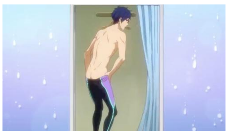
Figura 16 – Troca de roupas em Free! com revelação sensual