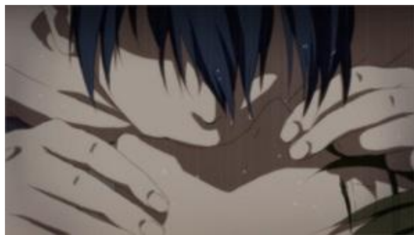
Figura 10 - Por um breve momento, as bocas de Haruka e Makoto se tocam