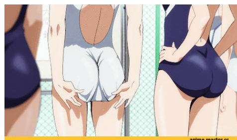
Figura 19 – Enquadramento sensual em Keijo!!!!!!!

Após observarmos estes enquadramentos usados para fins de fanservice na série, notamos que também, assim como se dá no yaoi , há sempre um motivo para que ele ocorra e há um certo alívio cômico. Por exemplo, assim como o homerotismo no yaoi é impulsionado por um motivo infantil, como um personagem embriagado, ou um beijo acidental, em Free! o fanservice ocorre de maneira ligeiramente cômica, como quando Rei não consegue nadar ou vestir suas roupas de banho. Ou seja, é