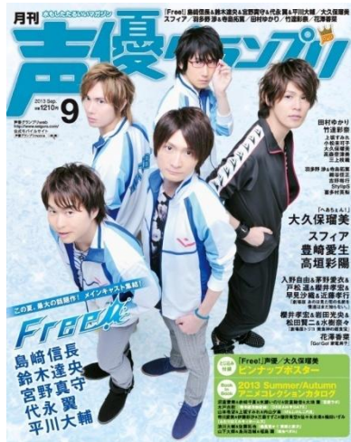
Figura 4- Elenco de Vozes de Free! 21