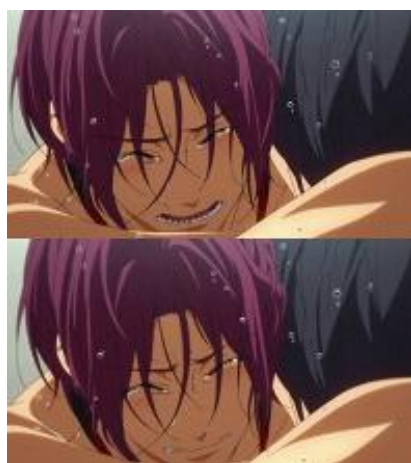
Figura 13 - Rin mostra seu lado sentimental oculto a Haruka