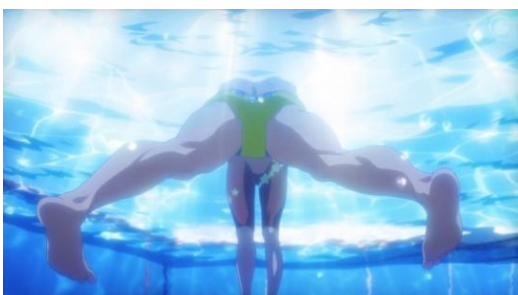
Figura 18 – Enquadramento revelador em Free!