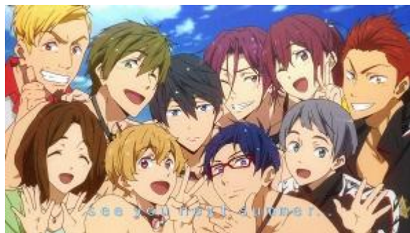
Figura 5 - Personagens da série Free! 37

Esquenazi (2011, p.151) afirma que qualquer personagem de ficção tem uma dupla função narrativa: é objeto e sujeito da narrativa, simultaneamente, aquele a quem acontece qualquer coisa e aquele graças a quem interpretamos o que acontece. O personagem encontra-se em constante mudança e crescimento, e os acontecimentos atravessam sua vida cotidiana, mudando-lhe o humor e modificando suas relações com os outros protagonistas.