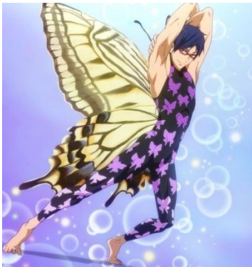
Figura 6- Rei experimenta vários trajes de banho

O queer se encontra não apenas nos relacionamentos, mas também no corpo dos personagens, na sua linguagem corporal, por exemplo, em seus movimentos e proximidade física com os demais personagens, ou seja, contradizem a performance do seu gênero, fugindo do que a sociedade espera de um comportamento padrão masculino.