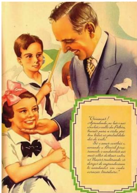
3: Propaganda governamental na cartilha escolar, governo Vargas

“Crianças! Aprendendo no lar e nas escolas, o culto da Pátria, trareis para a vida prática todas as possibilidades de êxito. Só o amor constrói e, amando o Brasil, forçosamente o conduzireis aos mais altos destinos entre as Nações, realizando os desejos de engrandecimento aninhados em cada coração brasileiro”