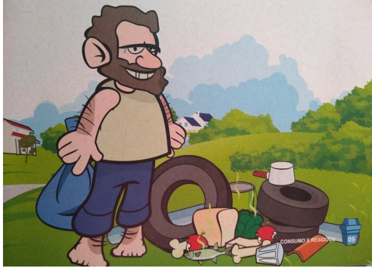
Figura 6: imagem do catador (DUAILIBI, 2013)

Retrata um homem barbudo, descalço, com um saco na mão e sem proteção nenhuma, que por meio de restos que jogamos de qualquer forma ele retira sua sobrevivência, inclusive do resto de comidas.