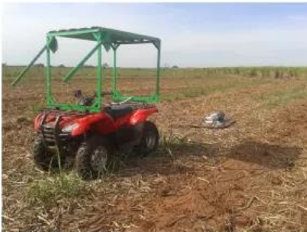
Figura 2. EM38-MK2® (Geonics Limited, 2020).