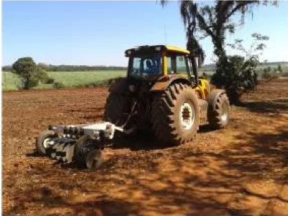
Figura 1. Veris-3100® (Veris Technologies, 2020).