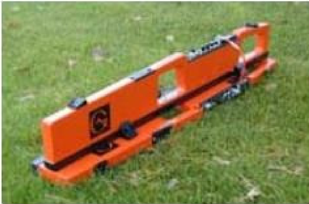
Figura 3. Equipamento para Mensurar a CE por IEM em detalhe (RABELLO, 2009).

Para os métodos de mensuração da condutividade elétrica do solo em campo, o Método CD faz passar uma corrente elétrica em eletrodos isolados, já o Método IEM utiliza a corrente induzida por um campo magnético, sem contato com o solo (RABELLO et al. 2011). Porém, no Método CD, o sistema fornece valores de CE sem nenhuma calibração, revelando apenas a leitura referente aos componentes físico-químicos do solo, ou seja, solo com condições de baixa umidade provocam um aumento na resistência elétrica dos eletrodos, resultando num valor equivocado de medição (PINCELLI, 2004).