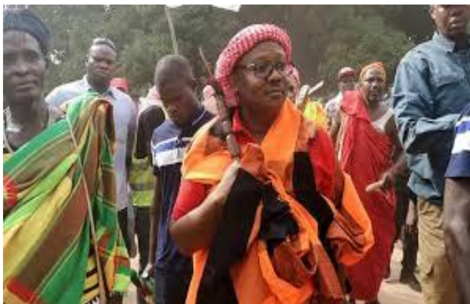
Figura 5: Umaro Sissoco Embaló, eleição presidenciais 2019