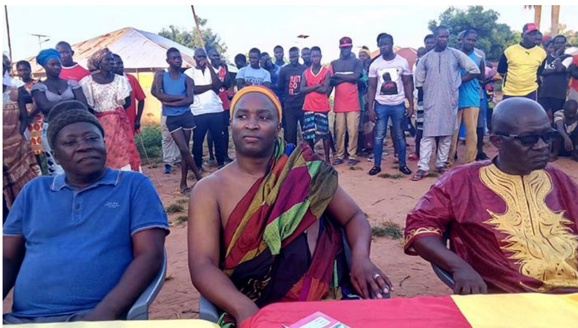
Figura 6: João Bernardo Vieira, eleição 2019