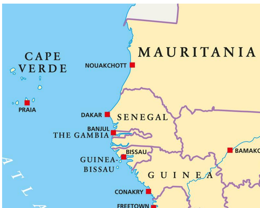
Figura 1: Mapa ilustrativo da localização geográfica da Guiné-Bissau

A Guiné-Bissau é um país situado na África ocidental, limitado ao Norte pelo Senegal, ao Sul e leste pela Guiné-Conakry e ao leste pelo oceano atlântico. Também integra o país cerca de quarenta ilhas que compõem arquipélagos dos Bijagós.