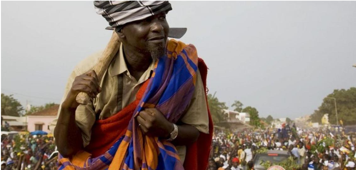
Figura 4: Kumba Yala, candidato a eleição presidencial 2005

Nesta foto vê-se o candidato Kumba Yalá em 2005 ao sair da campanha eleitoral na região de Biombo, o candidato aparece com trajes da etnia pepel sabendo estes eram majoritários na região de Biombo.