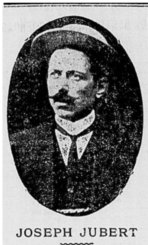
Fotografia 15 – Professor Joseph Joubert Rivier, 1913.