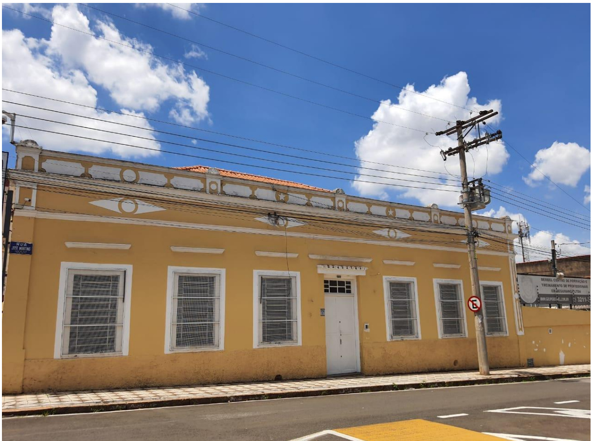
Fotografia 8 – Chácara Amarela, Patrimônio Histórico Cultural de Sorocaba, 2020.