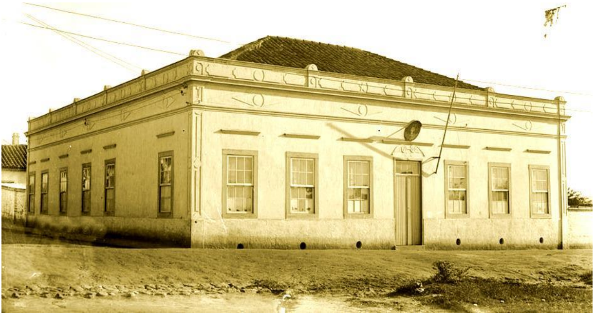
Fotografia 7 - Chácara Amarela, 1924.