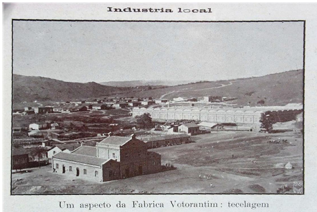
Fotografia 11 – Fábrica de Tecidos Votorantim.