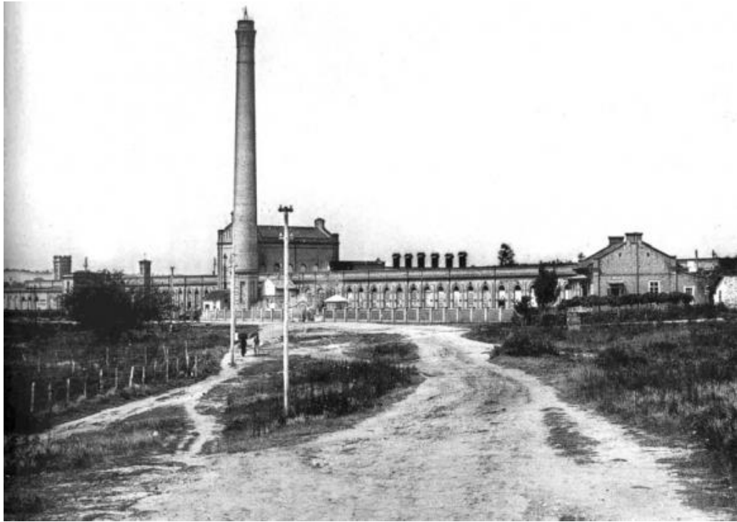
Fotografia 10 – Fábrica Santa Rosália.