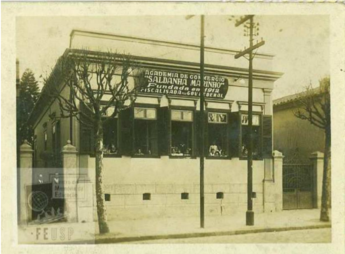
Fotografia 3 – Academia de Comércio Saldanha Marinho, 1919. 22