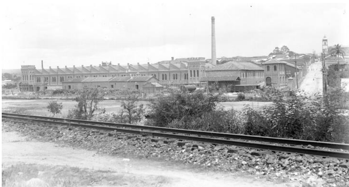
29 Fábrica N. S. da Ponte - Sorocaba