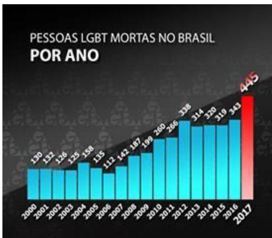
Imagem 1 – Pessoas LGBT Mortas no Brasil por ano

contra as minorias sexuais.” Do número total de mortos vítimas de homofobia, foram 387 assassinatos e 58 suicídios 44 , o número mais alto registrado pelo grupo desde o início da coleta e divulgação dessas estatísticas (GGB, 2017). O número de denúncias de violência contra pessoas LGBT, por outro lado, teve uma pequena queda, sendo registrado um total de 1.720 denúncias. Já o número de denúncias de homicídios e de tentativa de homicídios no Brasil em 2017 teve um aumento significativo, indo para 193 e 26, respectivamente (ATLAS DA VIOLÊNCIA, 2019).