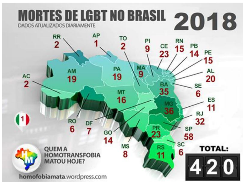
Imagem 3 – Mortes de LGBT no Brasil 2018

preconceito. Com relação ao suicídio de pessoas LGBT, houve um aumento de 42% em relação à 2017. Foram registradas mortes violentas de LGBTs em todos os estados do país, sendo que o estado que notificou o maior número de casos absolutos foi São Paulo, com 58 vítimas, como pode ser observado na Imagem 3. Apesar de apresentar o maior número absoluto, o estado ficou 24º lugar no índice de assassinatos LGBT por habitante (GGB, 2018).