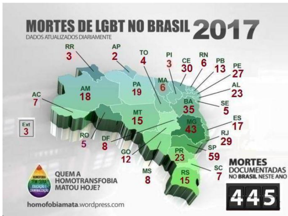
Imagem 2 – Mortes de LGBT no Brasil 2017

número de denúncias 45 no Brasil em todos os anos da pesquisa. Entretanto, apesar de liderar o ranking em números totais, o estado apresenta o menor índice de mortes por milhão de habitantes (1,31), inferior, inclusive, à média nacional (2,47) (GGB, 2017).