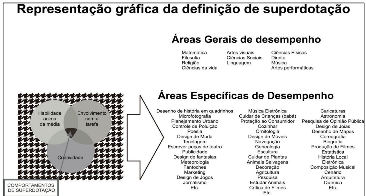
Figura: 1. Representação gráfica da definição de superdotação (REZZULLI; REIS, 1997).