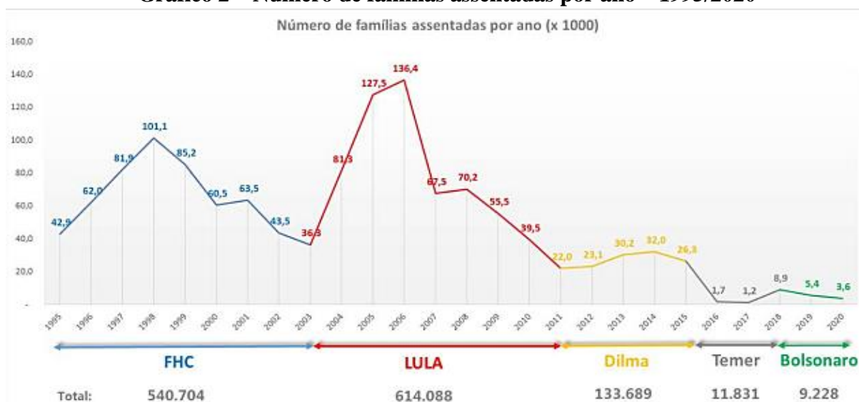
Gráfico 2 – Número de famílias assentadas por ano – 1995/2020

Este é o retrato da gestão Bolsonaro para o campo e sua incapacidade de gerir, inclusive, a favor da plena dominação do agronegócio, uma vez que a possibilidade de titulação massiva de terras, como proposto pelo governo, não se realiza pela complexa execução dessas ações em um país continental, que ainda por cima, aparelhou sua principal autarquia que seria a responsável por gerenciar as titulações. Isso não diminui a tragédia relegada ao rural, mas seria indício da contradição entre o discurso e a real situação organizacional do Executivo, visto que, em 2019, uma única titulação de regularização fundiária foi efetuada (SAUER; LEITE; TIBUNO, 2020).