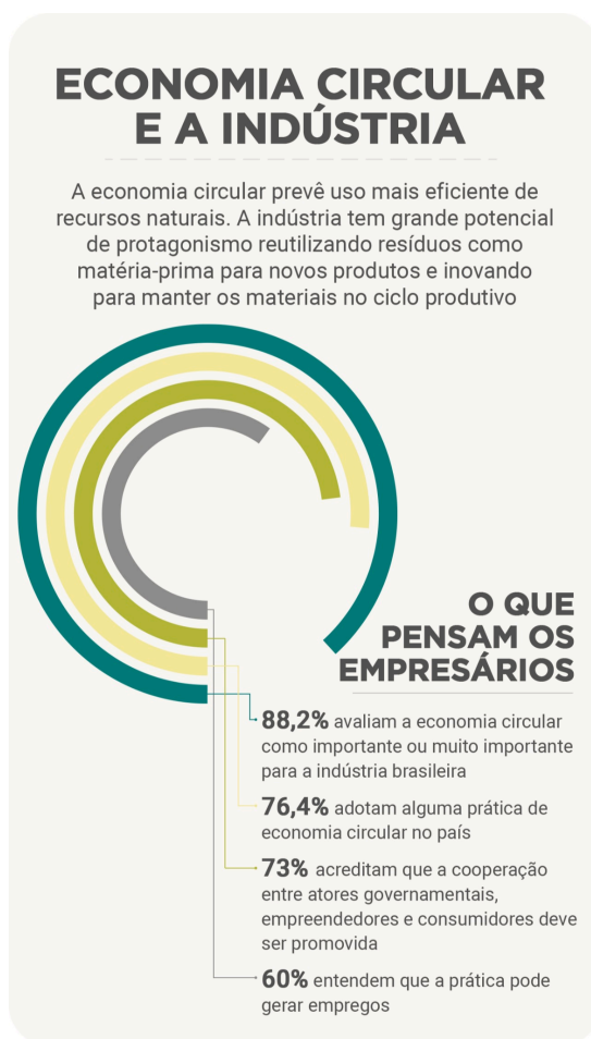
Figura 2 - Pesquisa do CNI “Economia circular e a indústria”