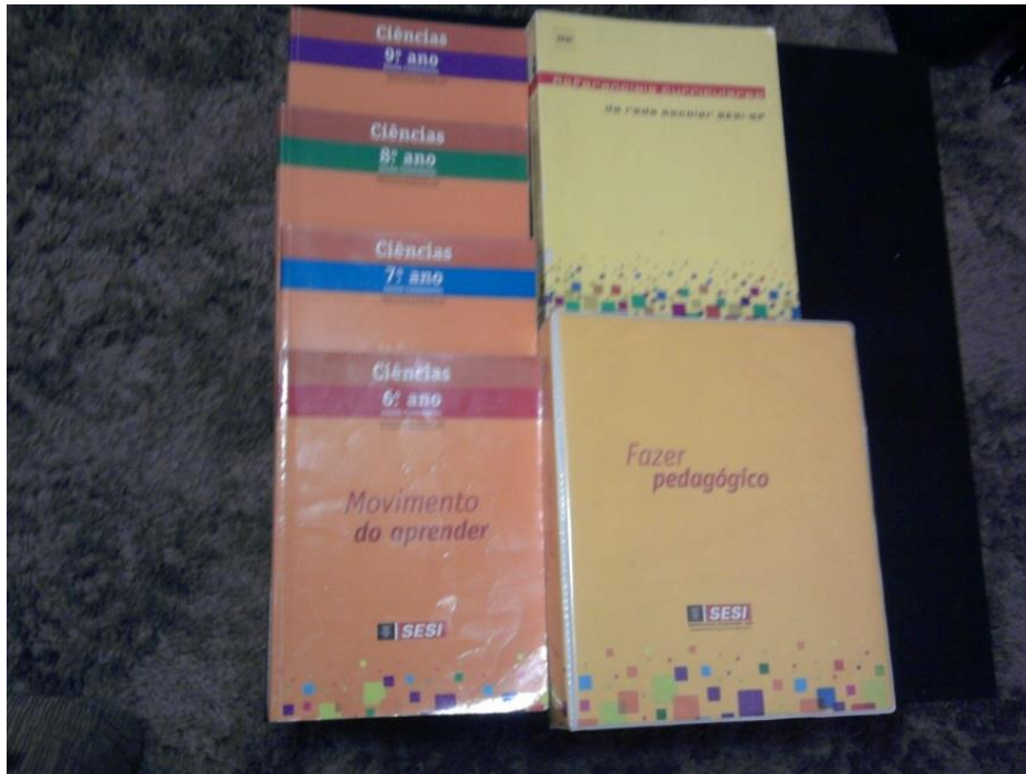
FIGURA 1 Amostra do material didático analisado

Primeiramente, para analisar a coerência da Proposta com o material didático, realizamos uma leitura flutuante, a fim de identificarmos aspectos relevantes que dizem respeito às especificações apresentadas na Proposta. No segundo momento, realizamos a análise a partir de uma leitura mais atenta, para o estabelecimento dos aspectos mais importantes para situar os nossos objetivos de pesquisa. Tais aspectos se mostraram presentes ao longo de toda a Proposta, de tal forma que pudemos estabelecer três dimensões de análise conforme descrito a seguir: