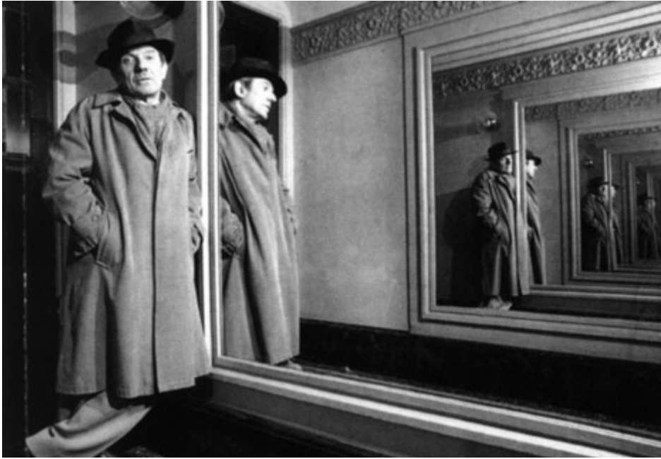
Figura 2: Deleuze e o exemplo do espelho. 111

O cristal é a presença do tempo em estado bruto percebido na contração da imagem. É o menor circuito que produz um duplo entre o atual e o virtual. Cada face do cristal mostrará uma imagem que só poderá ser percebida com a face atual de outra que aparece em outra face. A troca é infinita e esse menor circuito é regido por três figuras: o atual e o virtual, o límpido e o opaco, o germe e o meio.