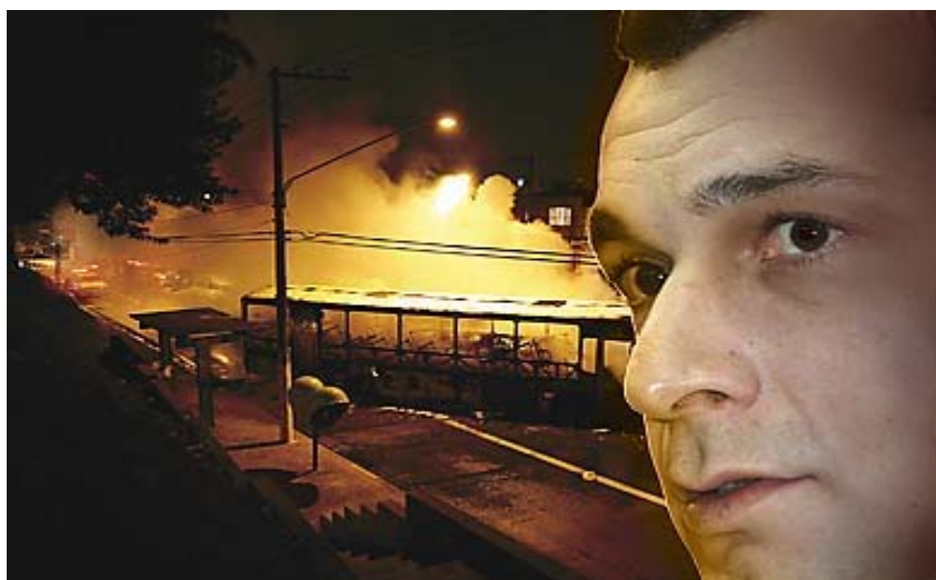
(fig. 04 . Revista Veja : Terror em São Paulo- “Como um bandido e seus comparsas conseguiram colocar de joelhos a maior cidade brasileira”)

A reportagem de capa da revista Veja apresentava como sua introdução, a imagem abaixo: