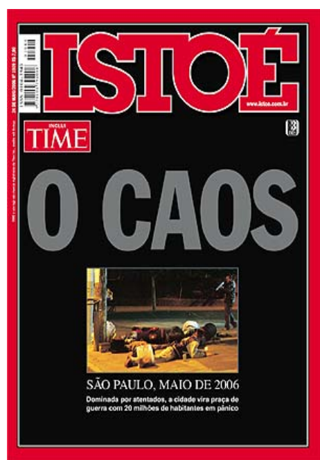
(fig. 1 revista Istoé - Capa)

No dia 25 de maio, a revista Istoé apresentou a seguinte capa à população: