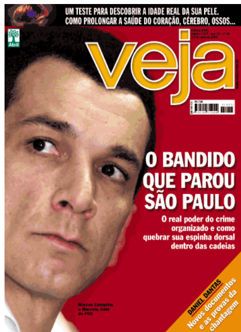
(fig. 03. Revista Veja: capa)