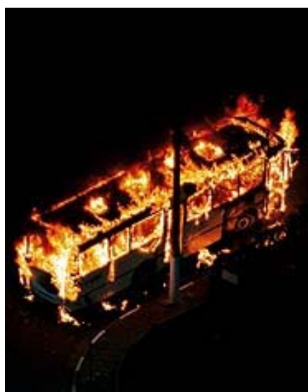
(fig. 2 Revista Isto é : “Ônibus incendiado, na zona leste de São Paulo: com 82 coletivos atacados, frotas foram recolhidas às garagens)

Uma das imagens com maior destaque na reportagem de capa da revista Istoé daquela semana, foi a foto que se segue abaixo: