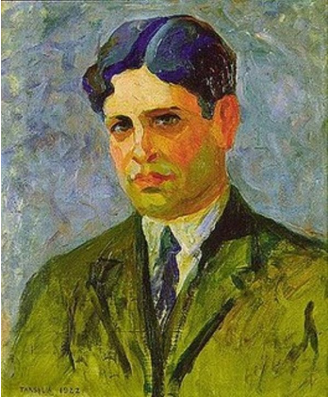
Tarsila do Amaral, Retrato de Oswald de Andrade (1922).

Durante essa meia-dúzia de anos fomos realmente puros e livres, desinteressados, vivendo numa união iluminada e sentimental das mais sublimes. Isolados do mundo ambiente, caçados, evitados, achincalhados, malditos, ninguém não pode imaginar o delírio ingênuo de grandeza e convencimento pessoal com que reagimos.