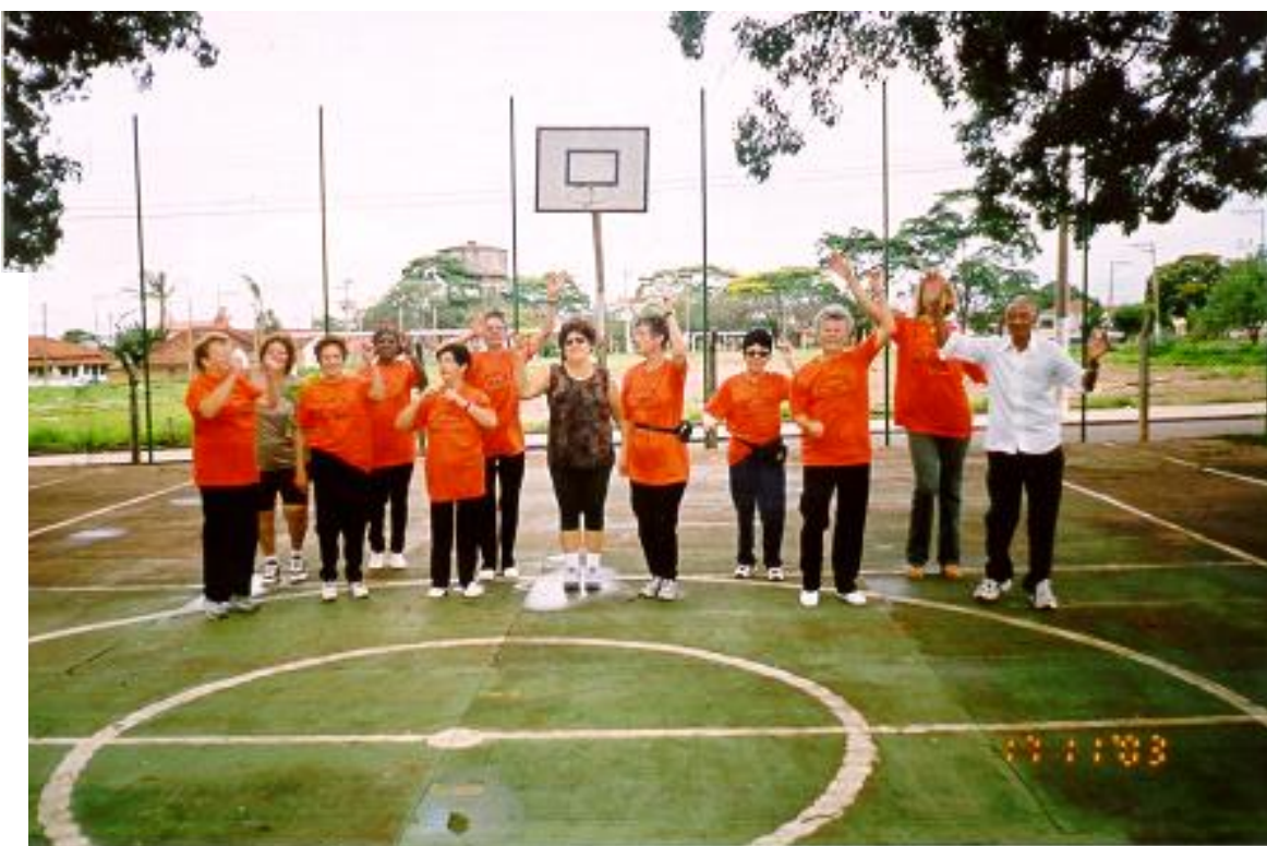
Figura 2 – Momento de descontração do grupo de vôlei adaptado do Centro de Referência do Idoso Vera Lúcia Pilla da Prefeitura Municipal de São Carlos-SP.