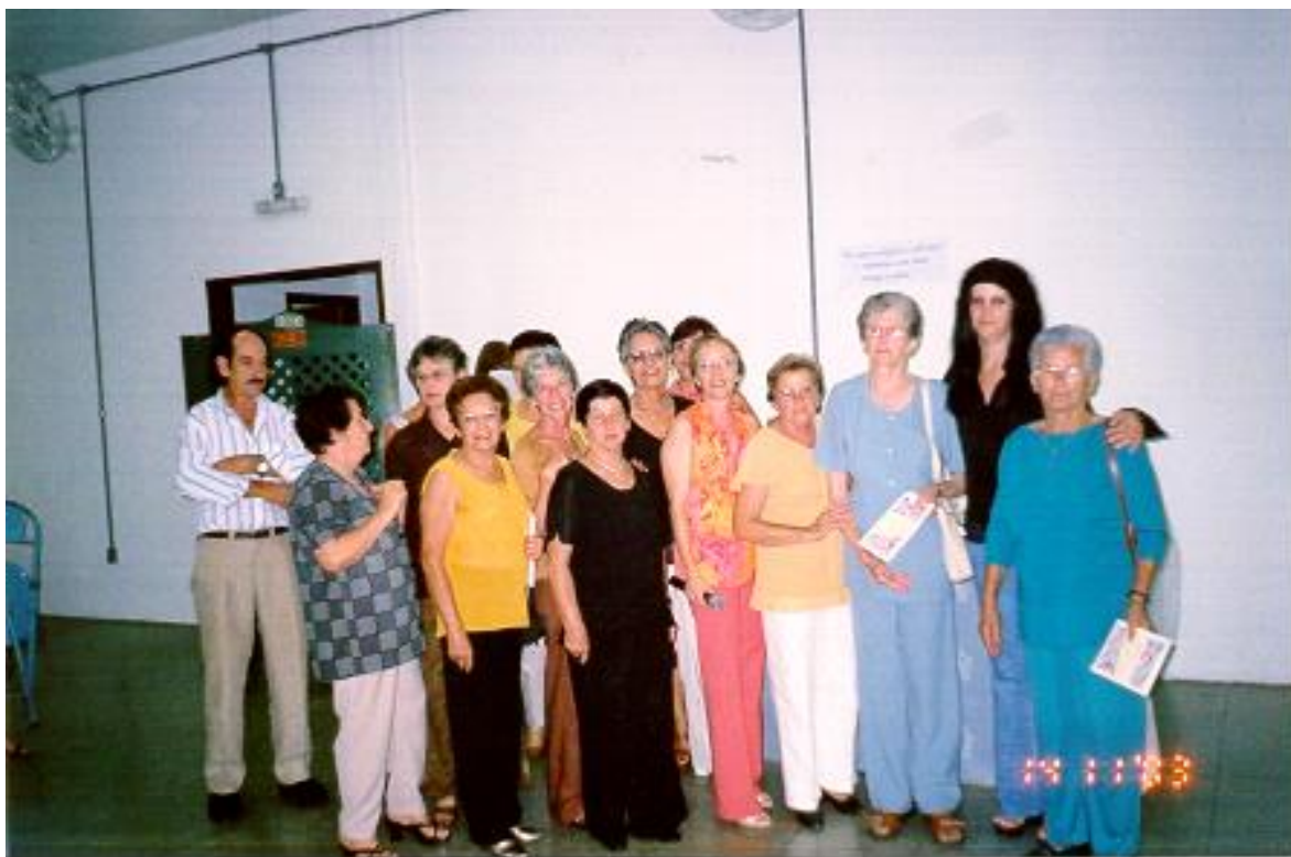
Figura 4 – Solenidade de lançamento do livro de memórias dos idosos. São Carlos (SP), março de 2003.