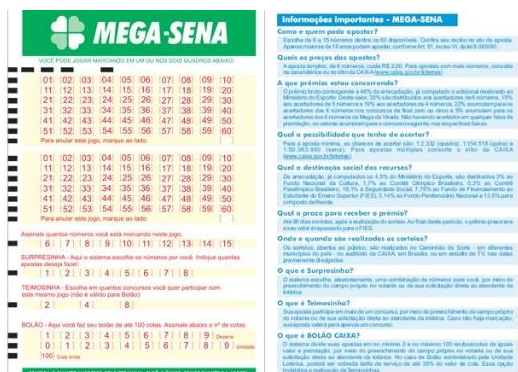
Figura 2: Volante de aposta da loteria Mega Sena – Exemplo para a atividade