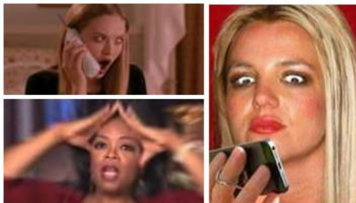
Figura 8 – Diferentes entonações do meme "atenta"