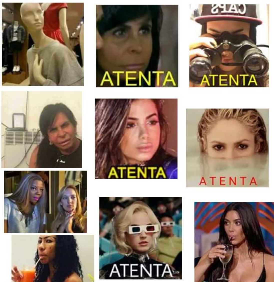
Figura 1 - Exemplo de diferentes memes que expressam atenção

Estes produtos culturais e celebridades são readaptados em forma de memes , que são fotos, vídeos ou conteúdos audiovisuais que por motivos diversos se tornaram bordões e viralizaram na internet e são recontextualizados em diferentes momentos. Esses conteúdos são largamente utilizados pelos usuários/as para expressarem suas reações e emoções, por isso o número alto de imagens publicadas em 24 horas (3.252). Algumas vezes as imagens substituem completamente o texto, em outras a união de texto e imagem ressignificam estes produtos culturais.