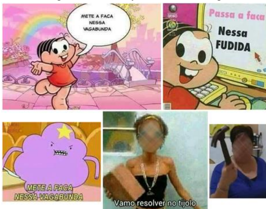
Figura 5 – Memes cujos sentidos são de agressão.