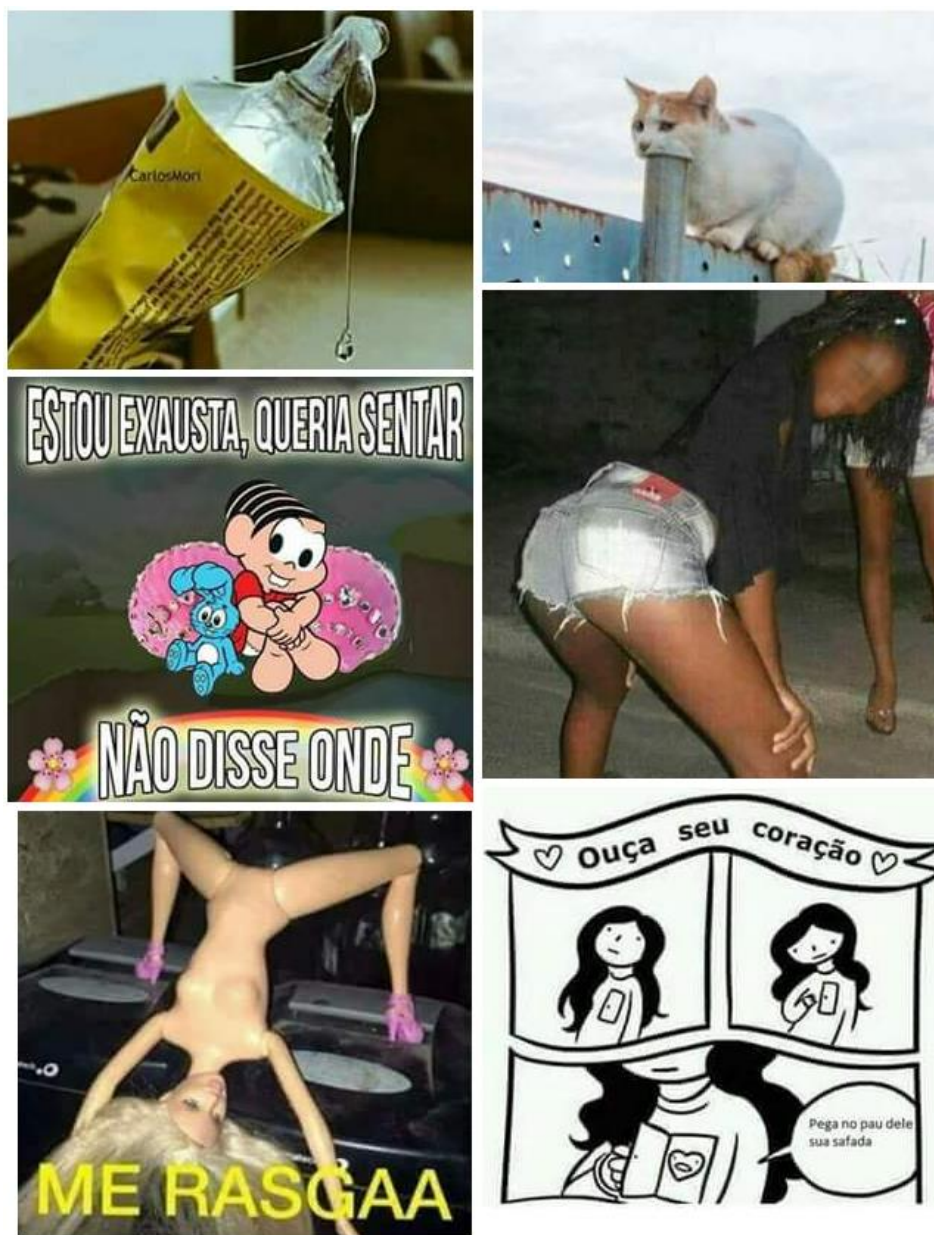
Figura 7 – Memes com conotações sexuais da tour analisada