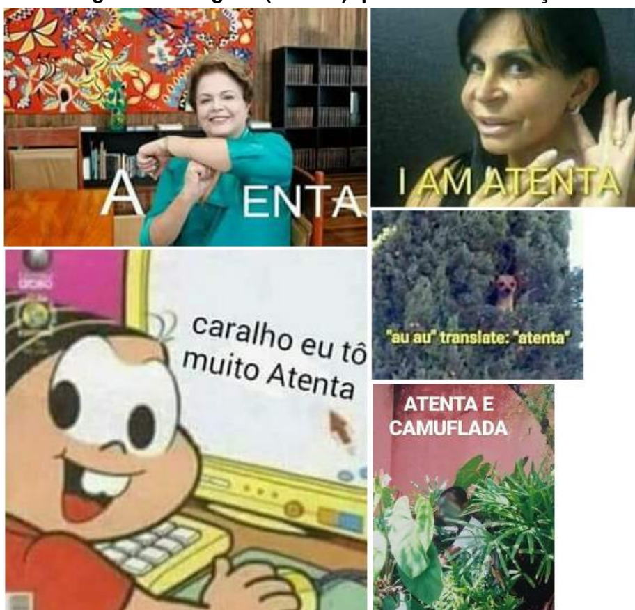
Figura 4 – Imagens (memes) que enunciam atenção

Na figura abaixo selecionei cinco memes que evidenciam, por exemplo, a entonação humorística das diferentes formas de utilizar a palavra “atenta”. O humor depende da interpretação do leitor, ou seja, a mensagem contida na junção imagem-texto possui referência contextual e para entender os códigos acionados nos memes deve-se considerar que as imagens utilizadas não são aleatórias. Decodificarei os cinco memes abaixo a fim de exemplificar esse processo que aconteceu a todo momento enquanto analisava as turnês, ainda que apresentar a decodificação de todos os outros com os quais tive contato fugiria aos objetivos dessa dissertação.