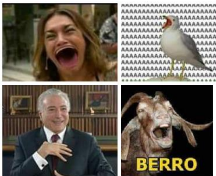
Figura 9 – Memes que expressam divertimento