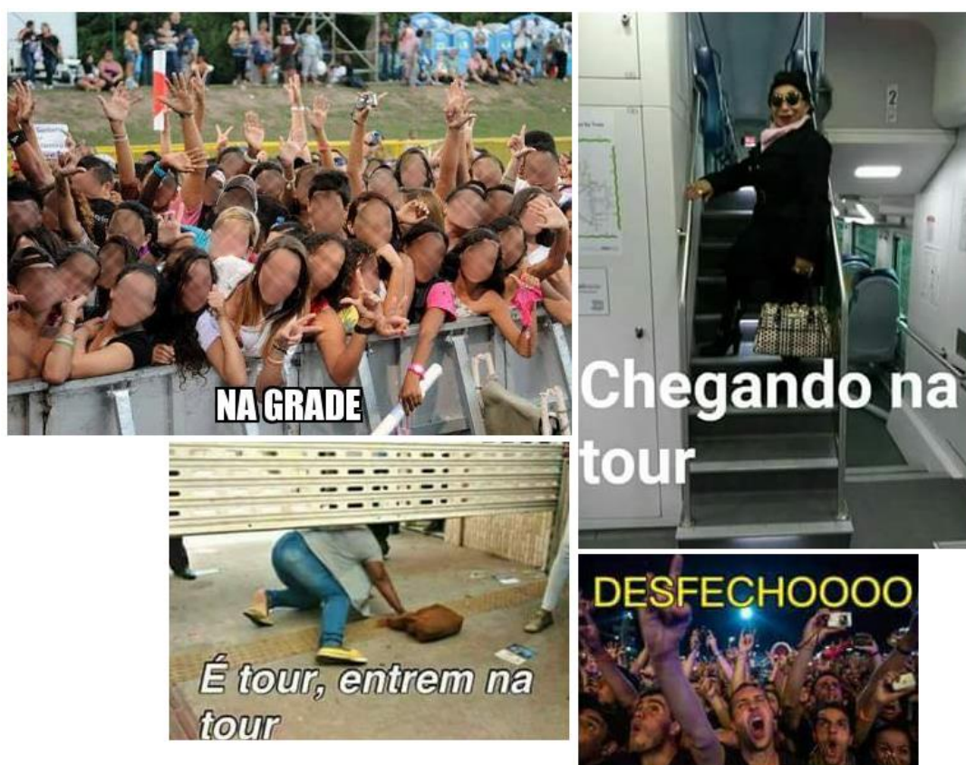
Figura 6 - Memes que indicam interesse dos/as usuários/as em acompanhar a tour