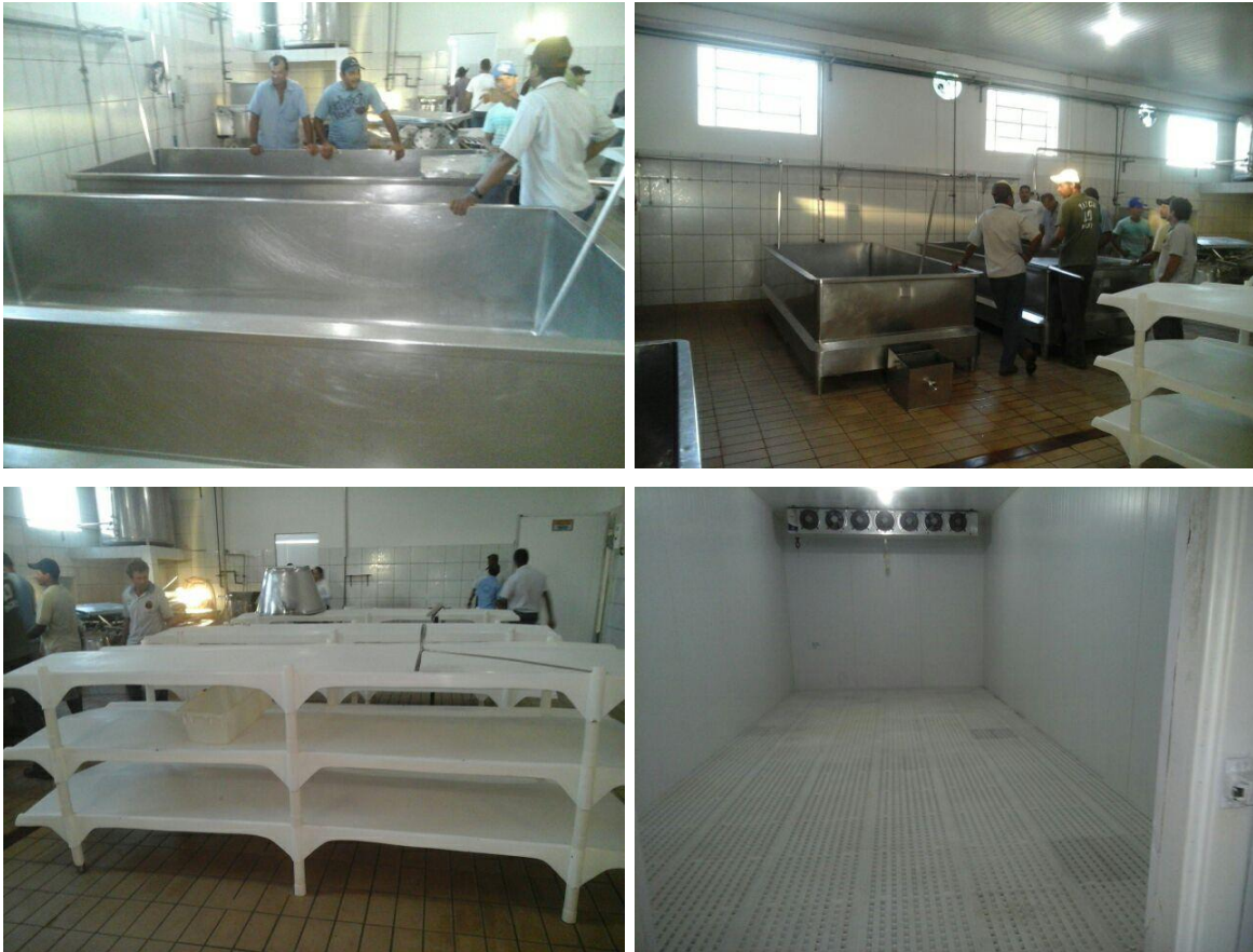
Figura 3 – Estrutura no interior do Laticínio- COOPERNONTE