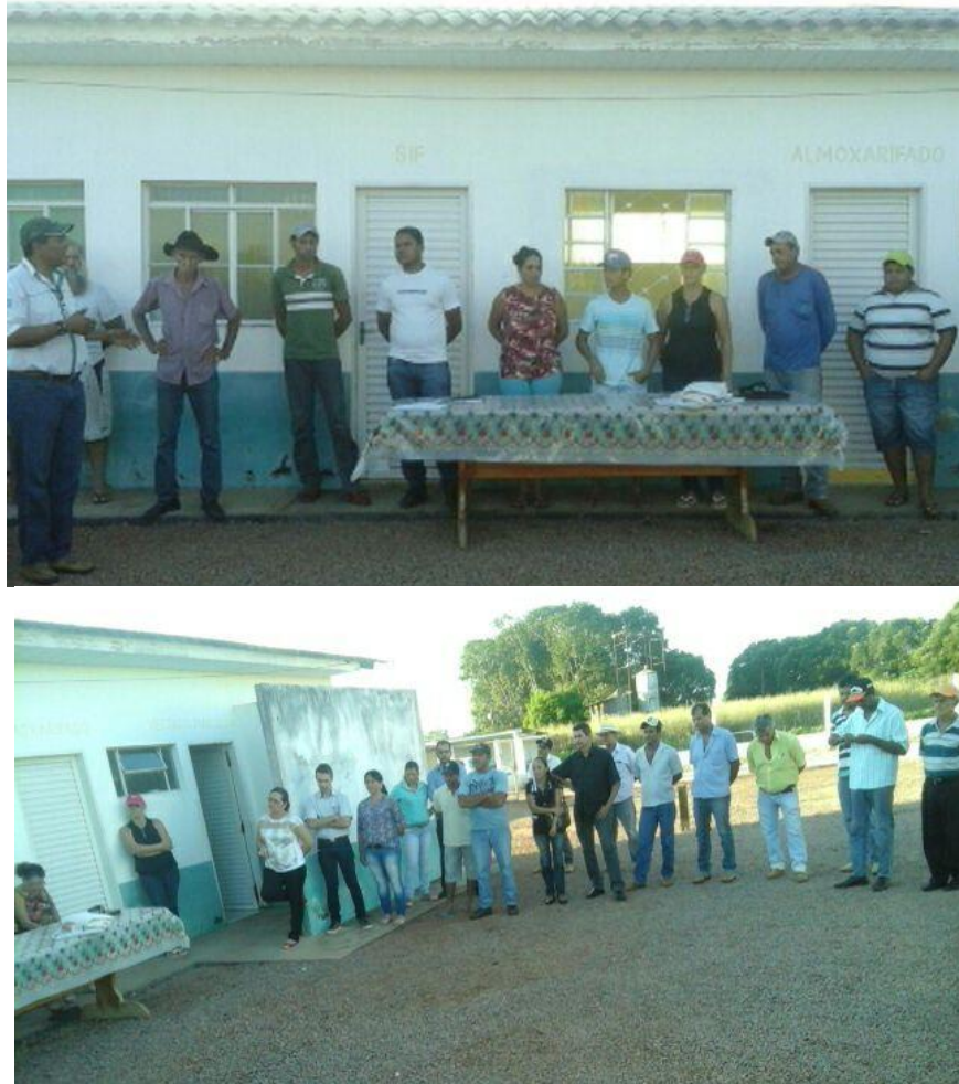
Figura 4- Encontro dos produtores no Laticínio - COOPERNONTE.