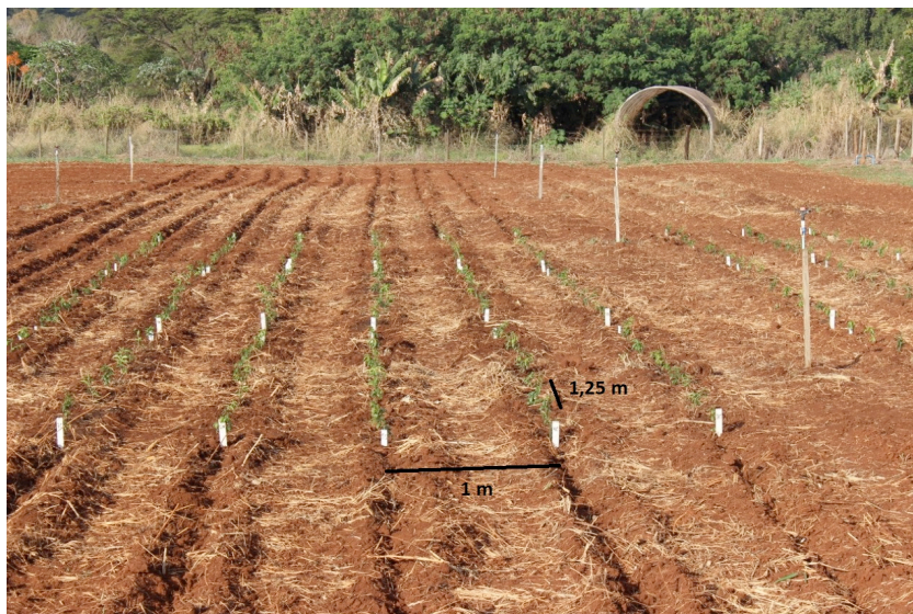
Figura 3. Foto do experimento em setembro de 2019.

mudas de ora-pro-nóbis. Utilizou-se o espaçamento de 1,25 m entre plantas e 1 m entre linhas (Figura 3).