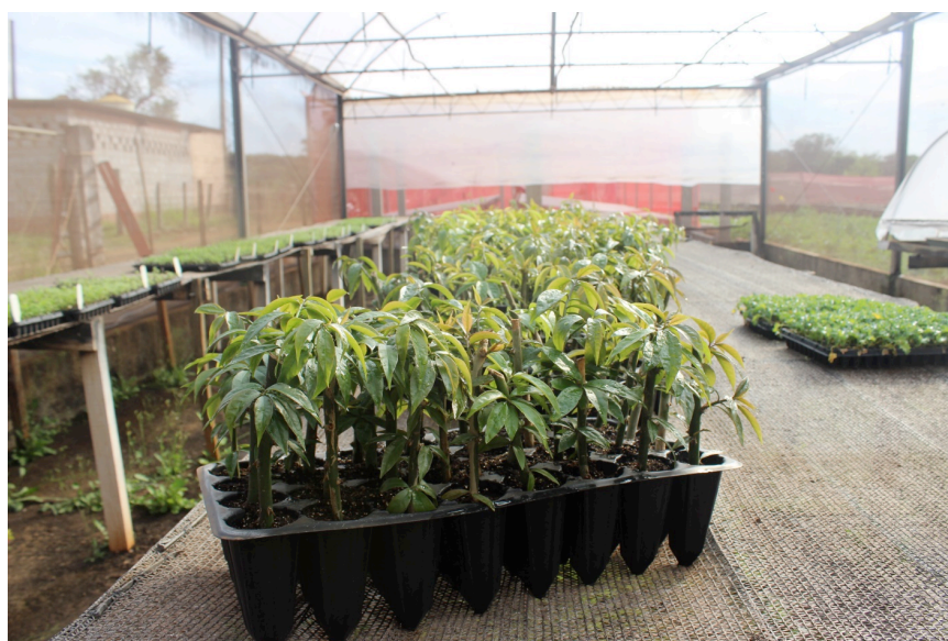
Figura 1. Mudas de ora-pro-nóbis em bandejas de polietileno.

Foram utilizadas mudas de ora-pro-nóbis obtidas de estacas semi-lenhosas, retiradas da parte intermediária das hastes do caule, de uma planta matriz cultivada em um quintal doméstico localizado no município de Araras, SP. As mudas foram enraizadas em bandejas de polietileno de 32 células (Figura 1) com capacidade 188 cm 3 , preenchidas com substrato comercial Carolina Soil® e mantidas em ambiente protegido com irrigação diária durante 70 dias.