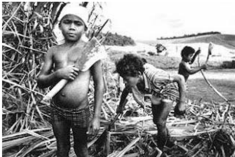
FOTO 10 Crianças no Corte da Cana.