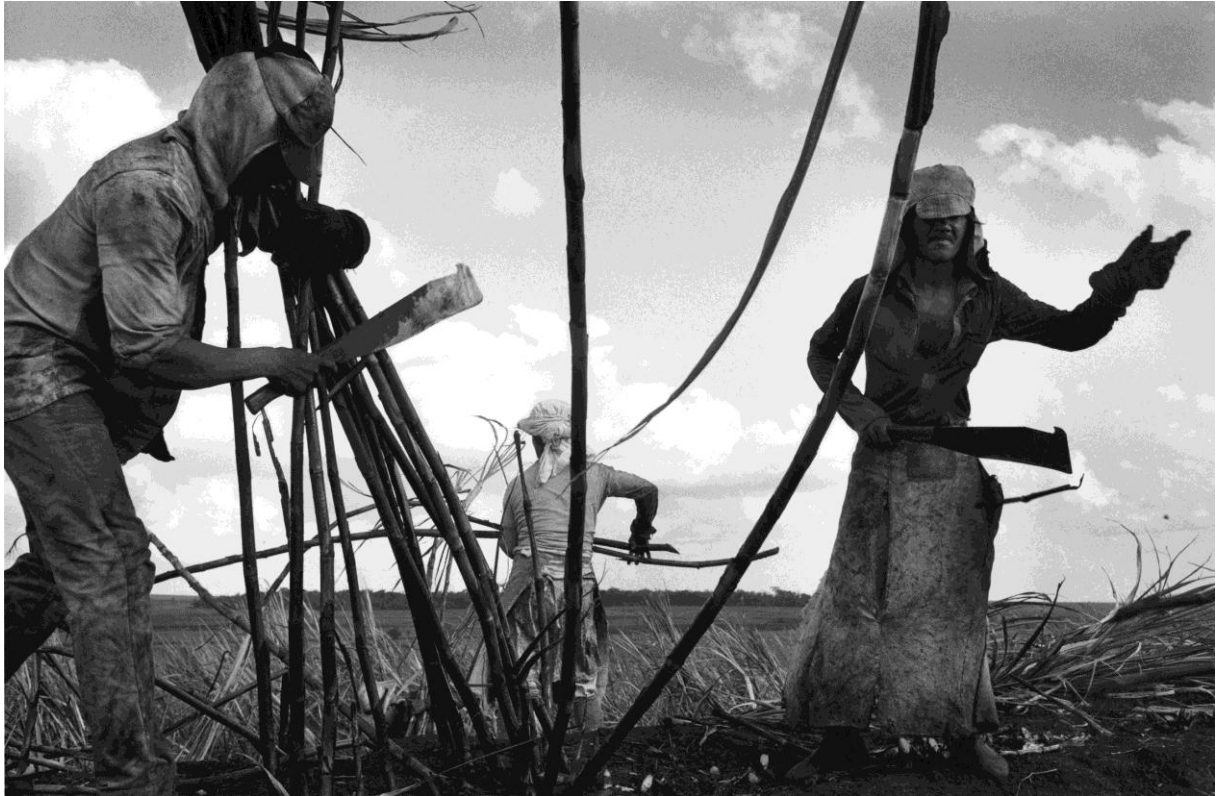
FOTO 1. Cortadores de Cana em Ação.