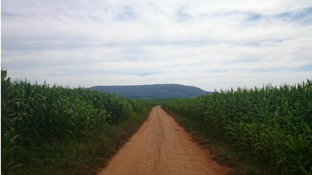
FOTO 4. Plantação de Milho.