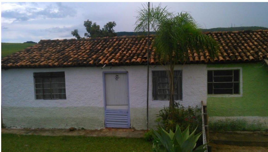
FOTO 6. Casas de trabalhadores da Colônia

As casas da colônia são mais antigas e menores, apresentam em média 50 anos de construção.