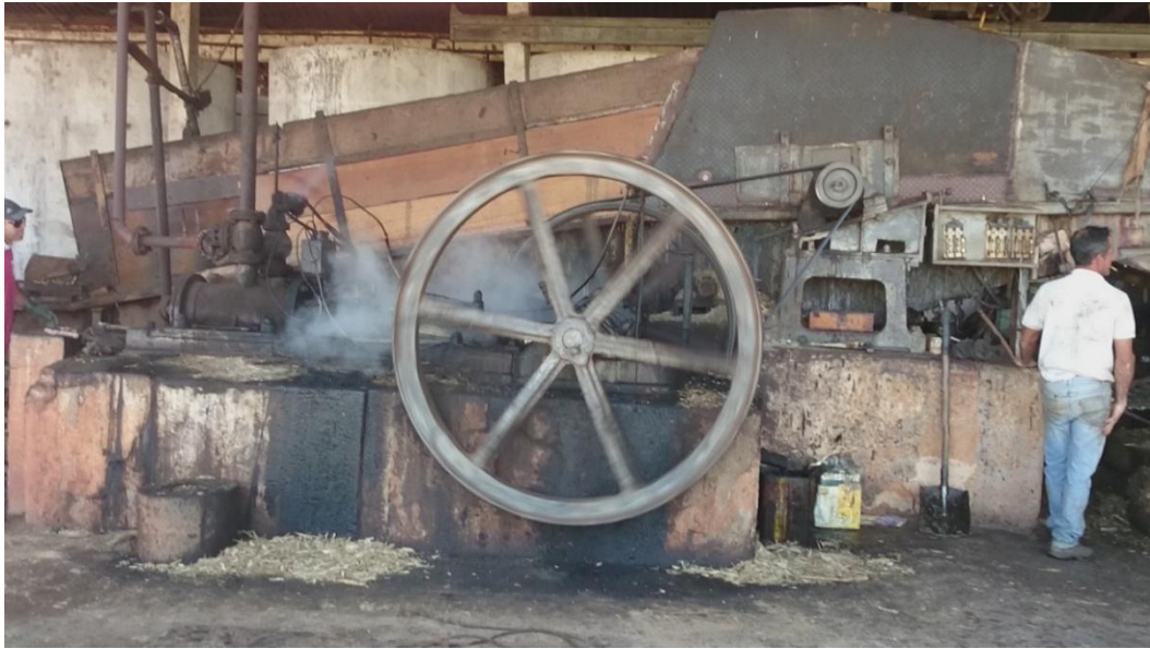
FOTO 12. As Engrenagens do Engenho.