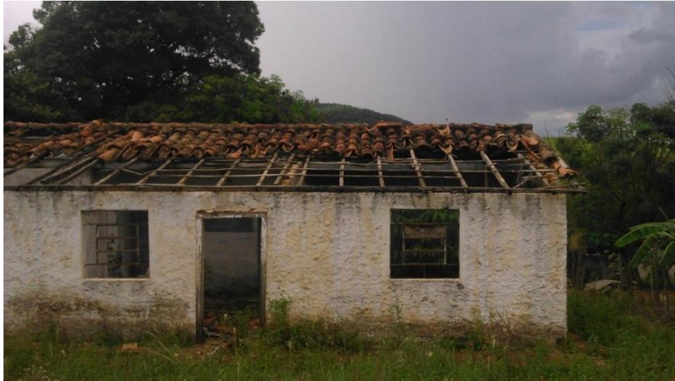
FOTO 7. Casa abandonada da Colônia.

Os moradores pintaram as casas em cores diferentes e nota-se uma pequena divisão entra as duas residências.