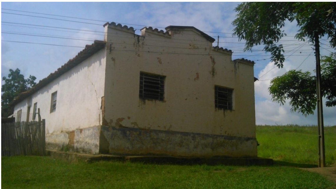
FOTO 8. Casas de trabalhadores da Fazenda

Essa casa apresentava alguns problemas na sua infra- estrutura e foi deixada sem ser demolida.