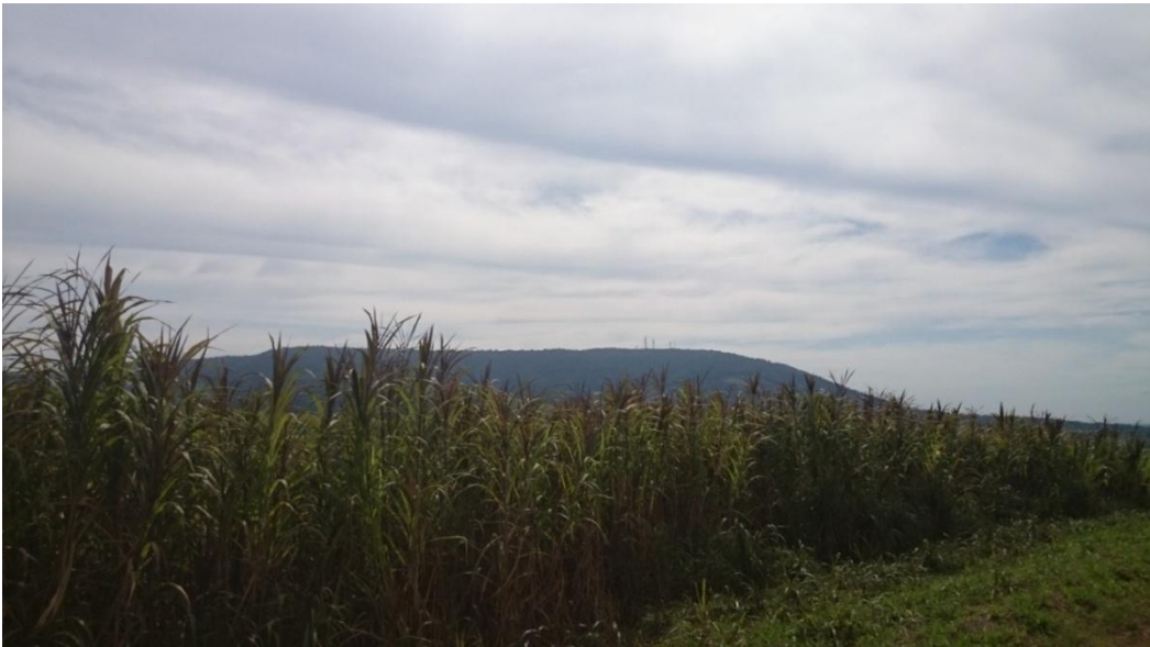
FOTO 3. Plantação de Cana.

Os pés de cana ainda estavam bem tenros no período da pesquisa.