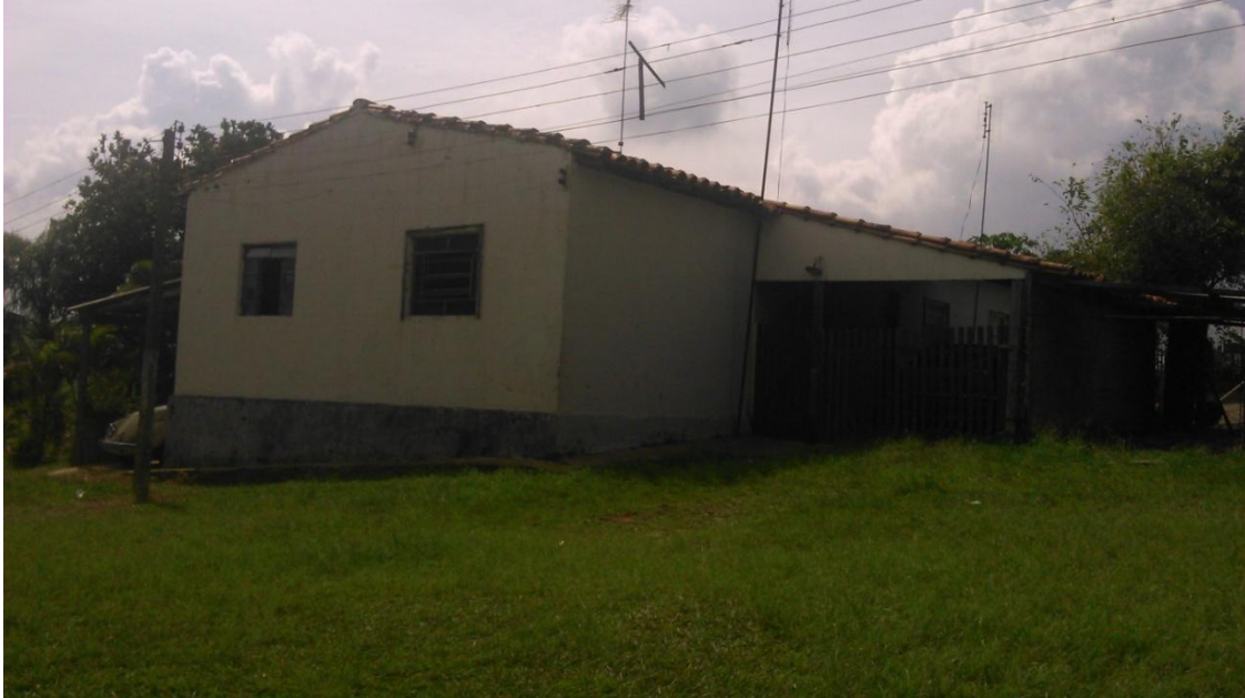
FOTO 9. Casas de Trabalhadores da Fazenda.