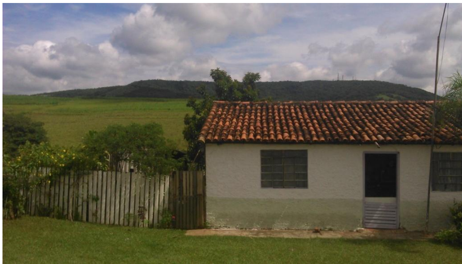
FOTO 5. Casa de trabalhador da Colônia.

As casas da fazenda apresentam algumas especificidades, encontramos algumas casas maiores, outras menores, as casas próximas a sede da fazenda e as casas da colônia que foram construídas uma ao do lado da outra. Como podemos ver abaixo: