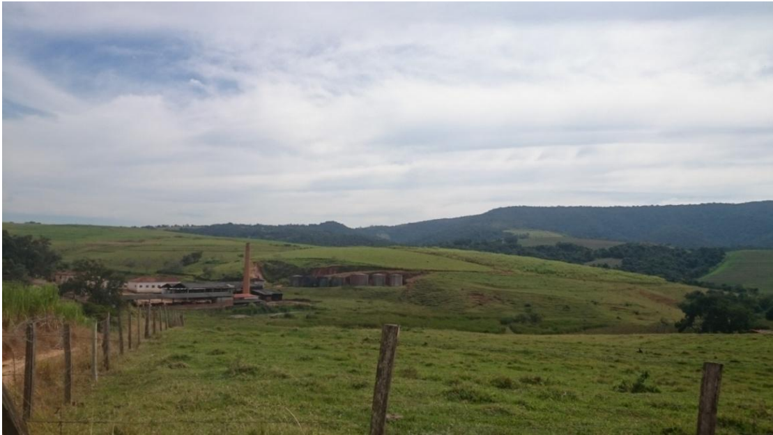
FOTO 2. Fazenda Alcoléa.

A fazenda vista pela entrada a partir da estrada de quem vem do Bairro Rio Verde.