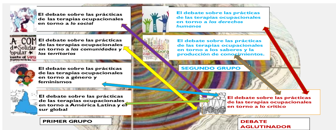
Imagen Debates reorganizados en grupos