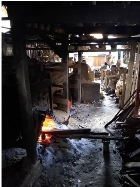
Figura 8 - Queima das peças

Fonte: Acervo Pessoal, em 22.07.2021. Legenda: O forneiro coloca lenha nesta abertura. Ao fundo, Isaías está “levantando” peças no torno.