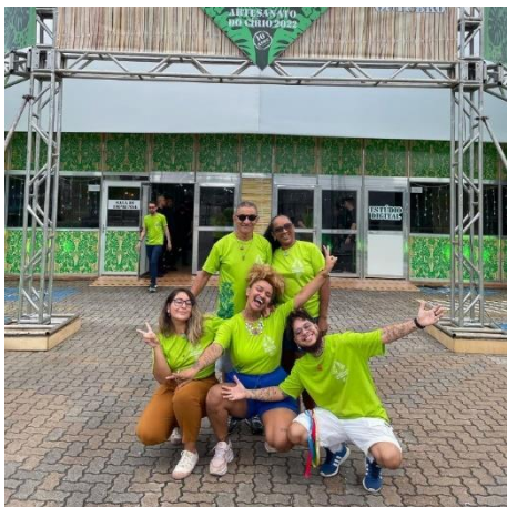
Figura 57: Família Sant'ana na FAC