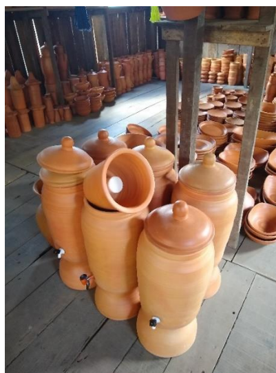
Figura 65 - Filtro de barro

Legenda: Filtro de barro