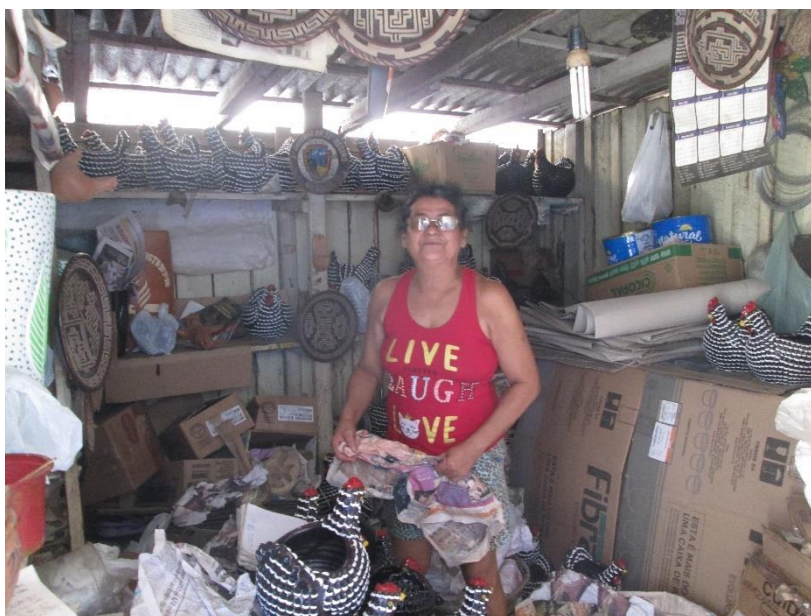
Figura 41 - Depósito de peças e embalagens

As conversas e as risadas fluem. Às vezes, algumas pessoas conhecidas que rotineiramente passam por lá alegram mais ainda o dia, como a “Gostosa”, uma senhora com cerca de sessenta anos, a qual ninguém sabe onde mora. Como ela é acumuladora, todos os dias deixa algum saco com objetos (provavelmente juntados na rua) para ser guardado na olaria. E a brincadeira continua. Dessa forma, as dificuldades advindas das desigualdades sociais e econômicas se diluem em meio ao trabalho feito entre conversas e risadas.