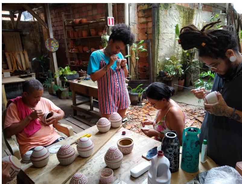
Figura 47 - Acabamento antes da queima

Após esta secagem inicial, a peça está pronta para receber os acabamentos anteriores à queima, tais como texturas em diversos formatos, pinturas com chamote, agregamento de partes para completar a peça, entre outros.