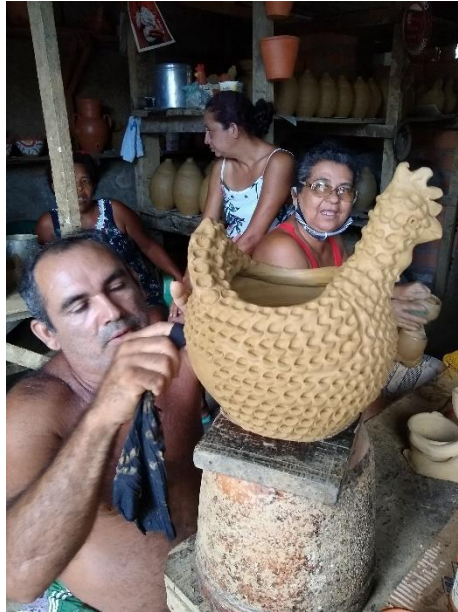
Figura 31 - Colocando “textura de dedo” na galinha

seguida, ela presta contas e já repassa as informações referentes à encomenda (o valor de entrada, prazo de entrega, a descrição da peça e outras).