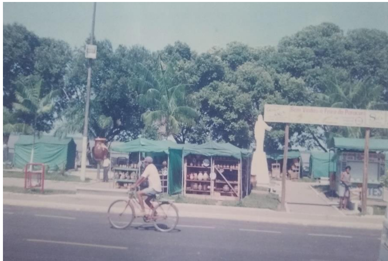
Figura 4 - Feira do Paracuri (1998)

Artesanato que é um dos principais pontos de comercialização e um ponto turístico na Orla do Cruzeiro em Icoaraci. A Figura 4, observada a seguir, é o registro fotográfico realizado na primeira pesquisa em 1997, quando a Feira de Artesanato já estava situada na orla, mas sem infraestrutura para comercialização. As barracas de lonas eram levantadas durante as fortes chuvas do inverno amazônico, causando danos para as/os artesãs.ões que comercializavam suas peças em condições inadequadas.