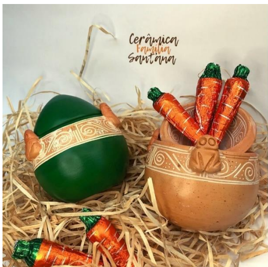
Figura 43 - Ovo Muiraquitã