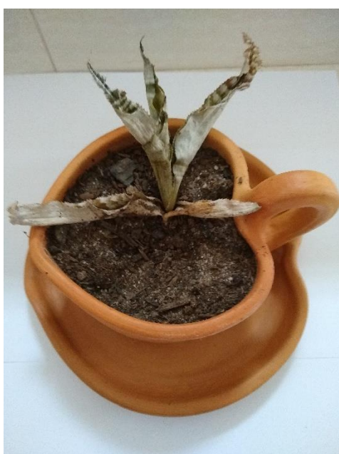
Figura 62 - Vaso coração

Fonte: Acervo pessoal, em 20.07.2021 Legenda: Vaso-xícara e prato em formato de coração.