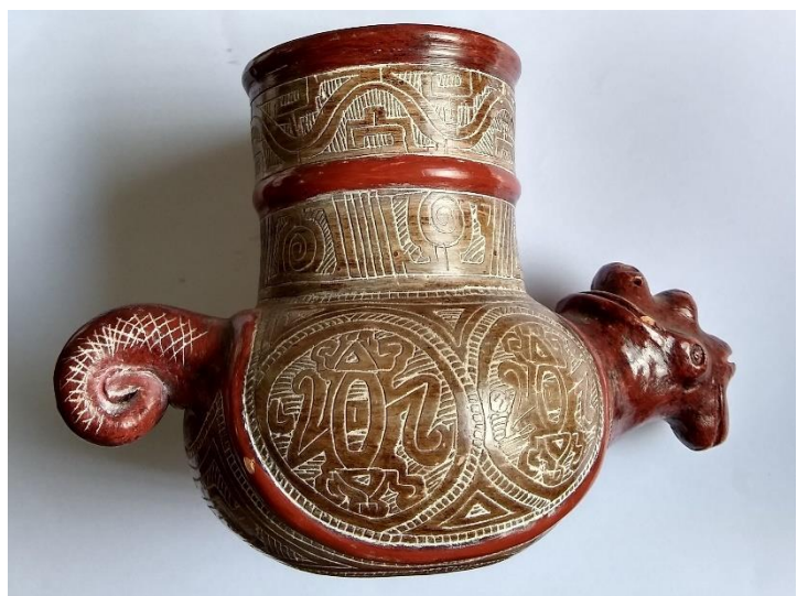
Legenda: Vaso zoomorfo marajoara

As peças marajoaras retratam estatuetas humanas ocas, tangas ou cobertas públicas triangulares, jarros, tigelas, pratos (Figura 14), tigelas com base anelar, urnas funerárias. Algumas são decoradas, como ilustra a Figura 15, com representações da fauna amazônica (cobra, jacaré, tartaruga, pássaros), além de representações híbridas de homem e animal. E, em Icoaraci, as peças são copiadas e recriadas a partir da arte oleira, havendo uma certa limitação na reprodução das peças indígenas,