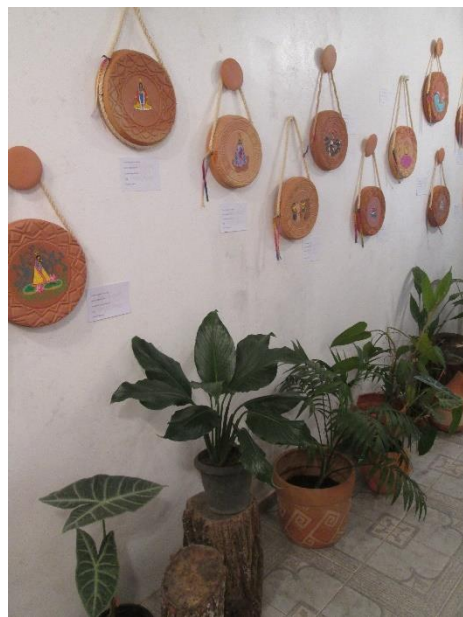
Figura 11 - Exposição da Coleção Círio 2021

Fonte: Acervo Pessoal, em 03.10.2021 Legenda: Lançamento da Exposição da Coleção Círio 2021. Este espaço funciona como sala de aula para oficinas e vivências em cerâmica.