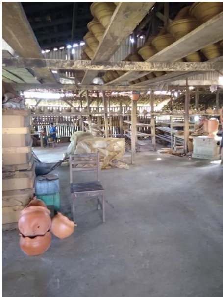
Figura 12 - Barracão de Acabamento e Produção

Legenda: Espaço onde se realiza o “levantamento” das peças no torno, acabamentos e secagem.