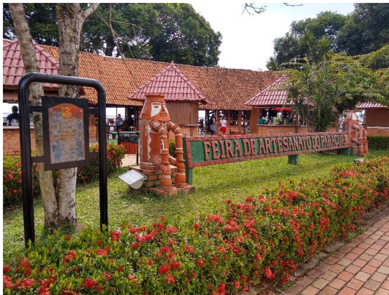
Figura 3 - Feira de Artesanato do Paracuri (2021)

os túneis de mangueiras dão um ar acolhedor e, ainda hoje no período de safra, é comum ver crianças e adultos colhendo mangas ou consumindo-as lá mesmo. Aproximando-se da orla, a imagem da Baía do Guajará ao fundo, barcos coloridos, a brisa fresca, o pôr do sol e as barracas de venda de coco verde são espaços de lazer e entretenimento. Continuando na orla, surge a praça do Cruzeiro com opções de bares e restaurantes, e logo se enxerga a Feira de Artesanato do Paracuri.