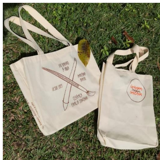
Figura 53 - Embalagem de tecido