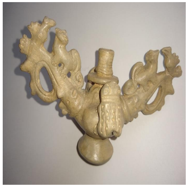
Legenda: Cerâmica arqueológica tapajônica.

A Figura 16 é uma cópia da estatueta antropomorfa tapajônica, também conhecida como ídolo pé-na-boca; e a Figura 17 é uma cópia miniatura do vaso gargalo tapajônico. Estas peças confeccionadas à mão são as peças arqueológicas