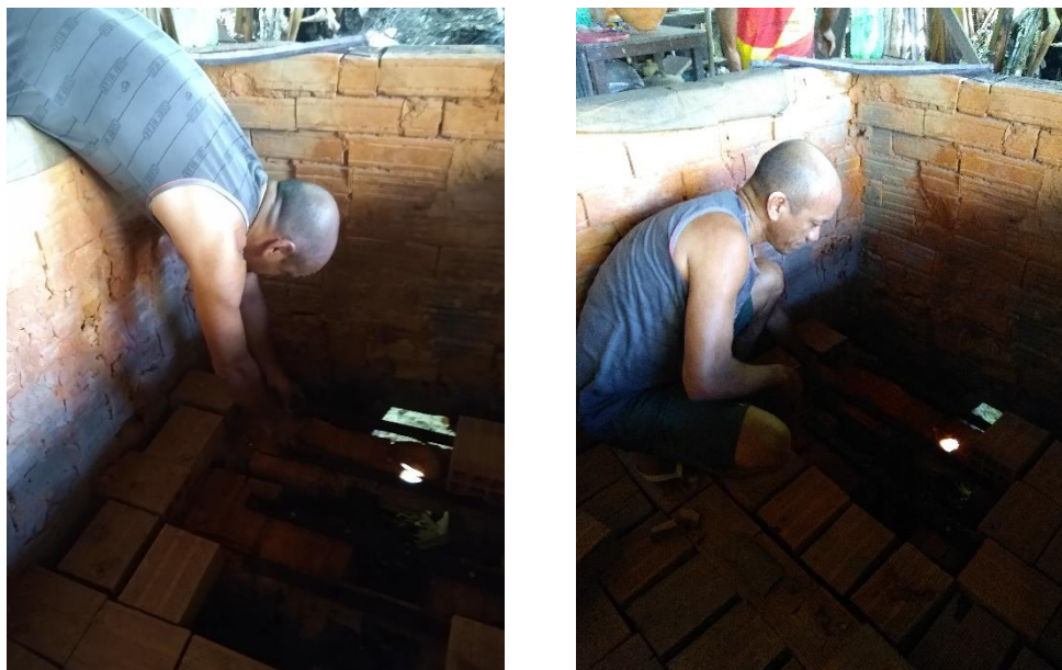
Figuras 60 e 61 - Reparos no forno

olaria 101 , daí o domínio de todas as etapas de produção. Mesmo que tenham sido contratados para uma função específica, caso seja necessário, eles desempenham outras, como mostra as Figuras 60 e 61.