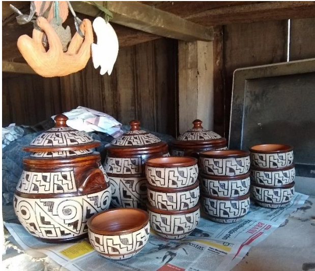
Figura 18 - Jogo de feijoada

Fonte: Acervo Pessoal, em 26.07.2021. Legenda: Jogo de Feijoada da Cerâmica da Tia Ana se constitui de 43 peças em estilo Icoaraciense.