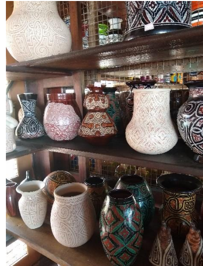
Figura 19 - Peças diversas

Legenda: Peças em vários estilos e formas na Feira de Artesanato do Paracuri.