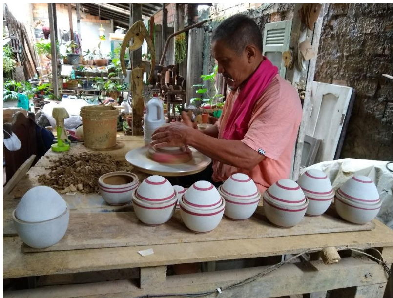
Figura 46 - Pintura feita no torno elétrico improvisado

maromba, usada para beneficiamento do barro; a brunideira, usada para polir as peças, entre outros.