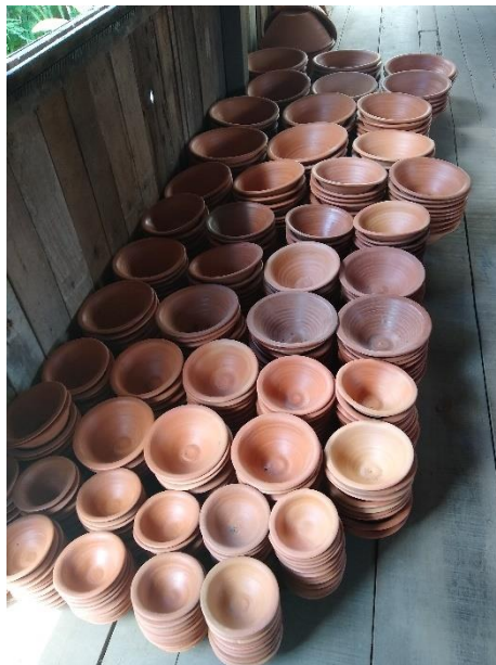
Figura 66 - Alguidares de tamanho diversos

ribeirinhas e nas ilhas; para armazenar água; para servir comidas nos restaurantes; e para decorar casas e empresas.