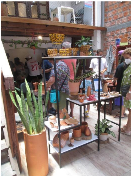
Figura 10 - Loja da Cerâmica Família Sant'ana

Legenda: Espaço para acabamento e comercialização das peças da Família Sant'ana.