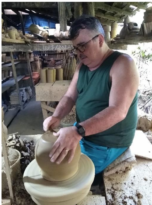
Figura 59 - Acabamento da peça no torno-de-pé