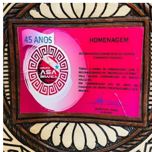
Figura 56 - Prato Homenagem

Fonte: Figura postada na rede social @fscerâmica, no dia 24.08.2021. Disponível em: < https://www.instagram.com/p/CS9oFerHQi4/?utm_source=ig_web_copy_link >