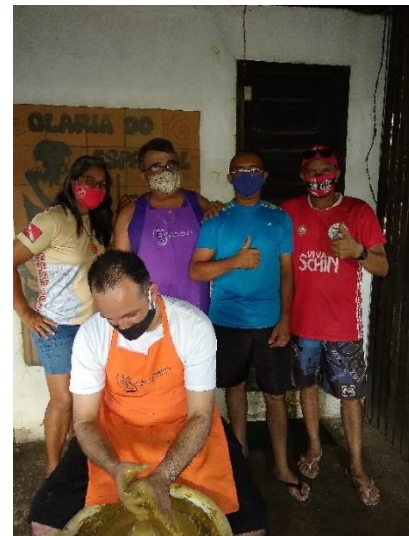
Figura 7 - Vivência na Olaria do Espanhol

Legenda: Participantes da Vivência realizada pelo Mestre Ciro Croelhas 52