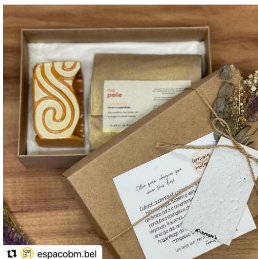
Figura 52 - Embalagem de papelão