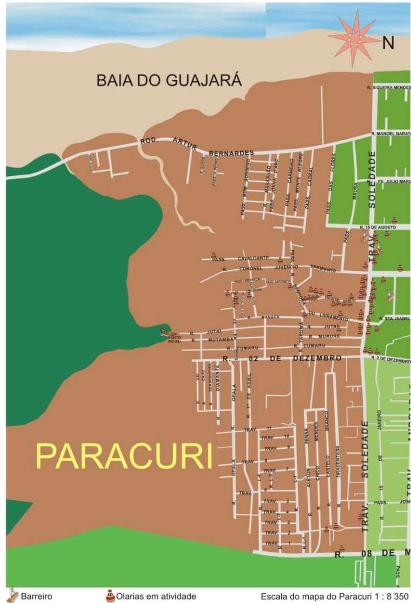
Figura 2 - Mapa do Bairro do Paracuri e Travessa Soledade