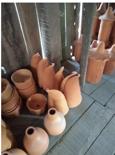
Figura 64 - peças utilitárias

Legenda: Moringas, vasos e pingadeiras