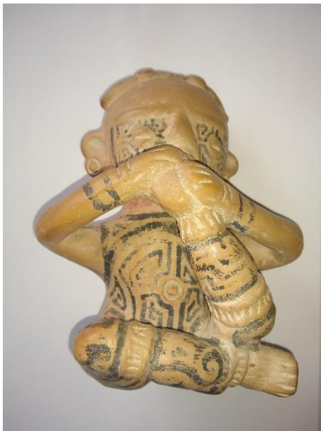
Legenda: Estatueta antropomorfa tapajônica.