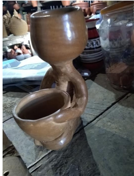
Figura 34 - Peça sem aspereza

Legenda: Peça sem aspereza pós brunição.