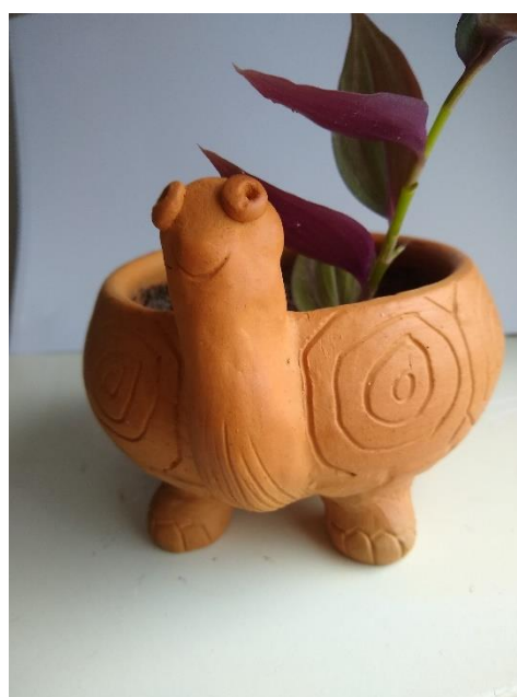
Figura 63 - Vaso tartaruga

Legenda: Vaso no formato de tartaruga.