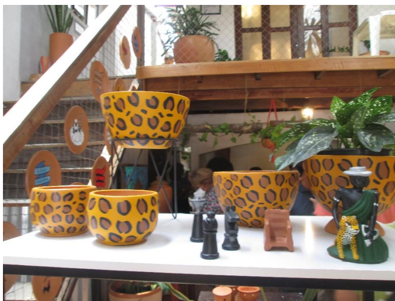
Figura 45 - Loja e sala de aula (altos)

Na Figura 45 (vide abaixo) mostra que na loja há uma escada que dá acesso a uma varanda arejada e à sala de aula, com peças em cerâmica e vaso com plantas da região. Nesta sala se realizam as oficinas de cerâmica, a exposição de coleções de peças, as reuniões e a elaboração de novas peças. Abaixo da escada fica o banheiro para clientes, há também um balcão ao fundo da loja. Este balcão expõe peças e é utilizado para servir cafés com tapioca e farofa de charque durante eventos.