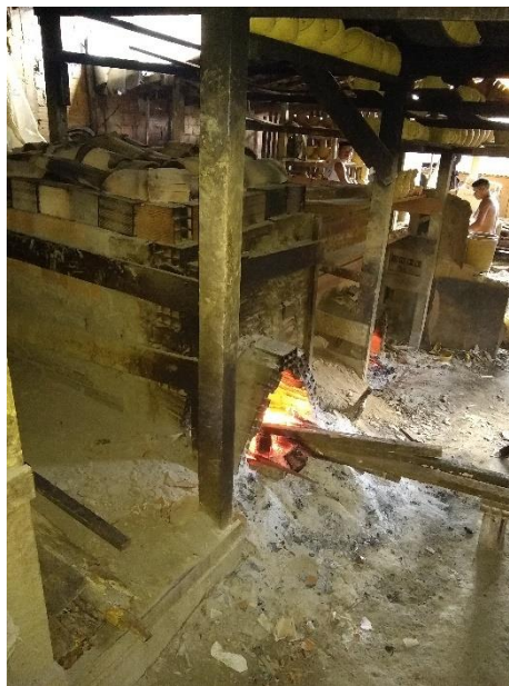
Figura 35 - Peças queimando.