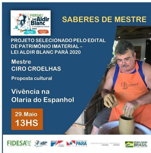
Figura 6 - Cartaz de Divulgação

Fonte: Figura postada na rede social @olariadoespanhol, no dia 25.05.2021. Disponível em: < https://www.instagram.com/p/CPTSxqVtUxk/?utm_source=ig_web_copy_link >