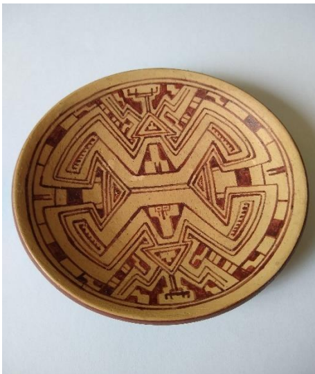
Legenda: peça miniatura de prato marajoara