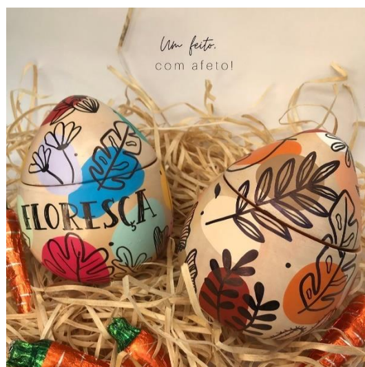
Figura 44 - Ovo Floresça