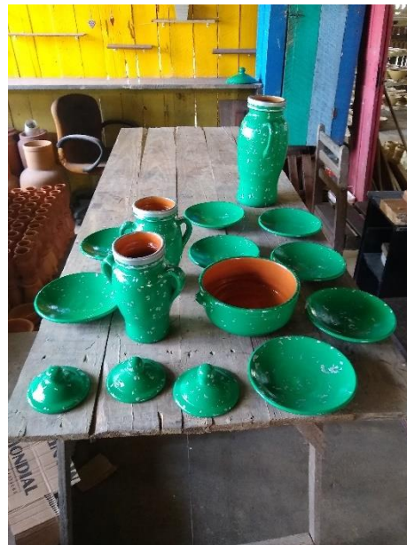
Figura 68 - Secagem após a pintura do Imbá

Fonte: Acervo Pessoal, em 28.07.2021. Legenda: Peças de imbá secando.