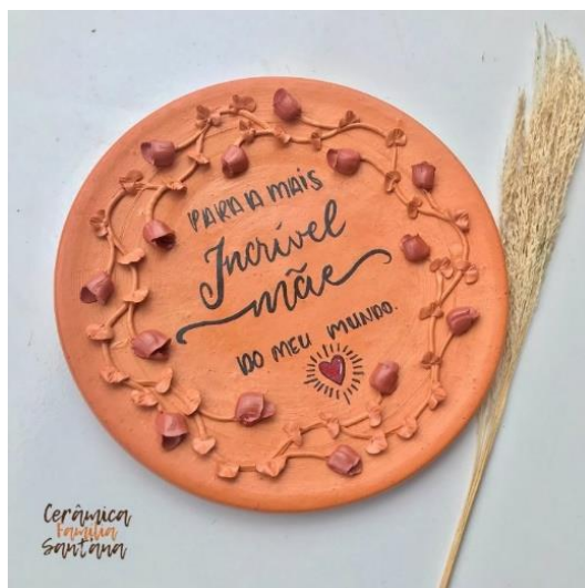
Figura 54 - Prato decorado