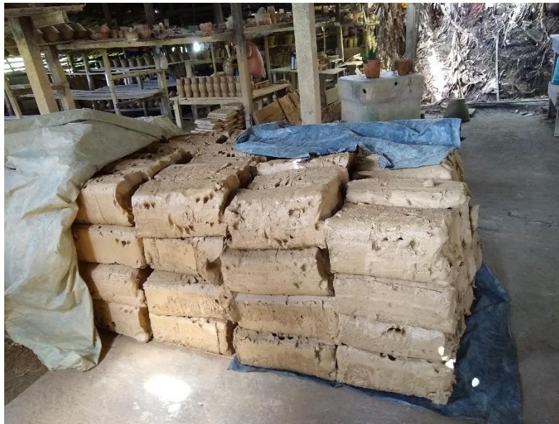
Figura 5 - Bolas de Barro

Após o beneficiamento e preparação das bolas de barro, elas são comercializadas. A Figura 5, a seguir, mostra as bolas compradas e armazenadas na Olaria do Espanhol. Para comercializá-las, os barreirenses utilizam um carro de madeira com duas rodas, que funciona com tração humana. Eles oferecem as bolas de barro nas olarias. Os preços variam de uma olaria para outra, dependendo do freguês 48 e do tipo de negociação estabelecida entre as partes, por exemplo, trocar as bolas de barro por peças e/ou dinheiro.