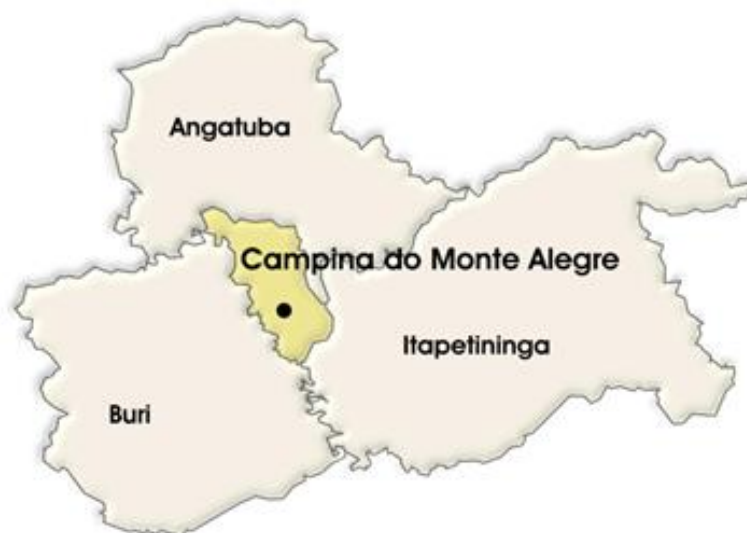
Imagem 2: Municípios limítrofes

Campina do Monte Alegre é o município em que moro e que passou a ser também meu assunto, locus de meu estudo. Trata-se de uma pequena localidade de aproximadamente de 6.088 habitantes, segundo dados estimativos do IBGE (Instituto Brasileiro de Geografia e Estatística) para o ano de 2021.