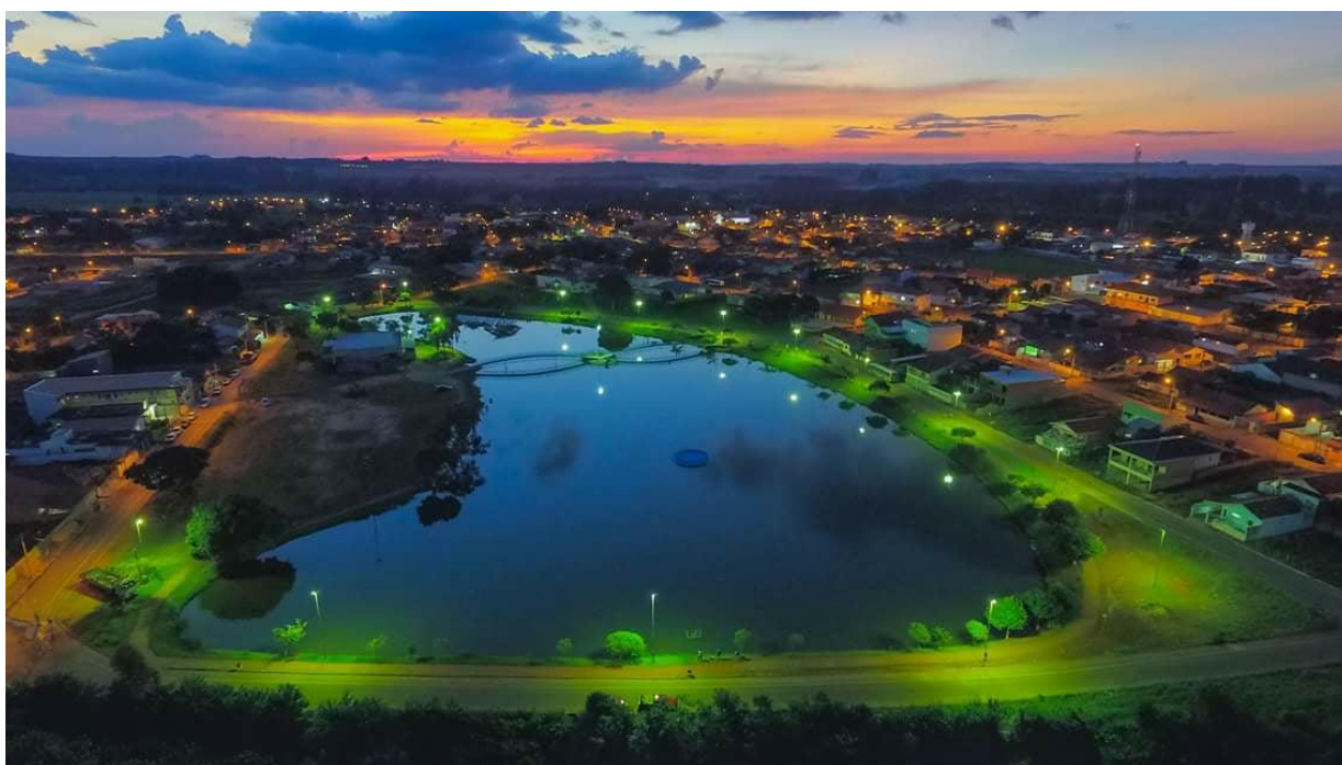
Imagem 1: Vista aérea noturna do lago municipal em Campina do Monte Alegre (SP)