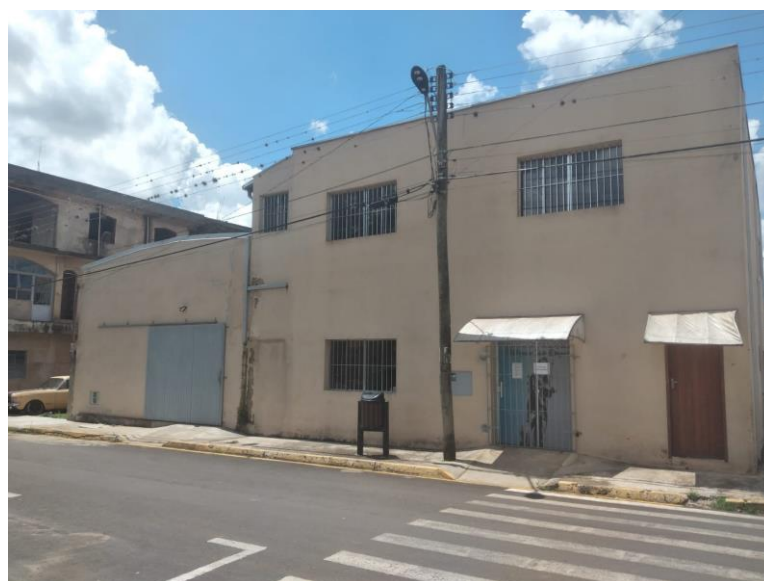
Fachada do Centro Catequético, em frente à Praça Matriz.