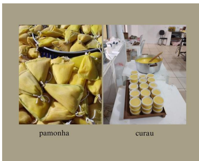
Alguns dos quitutes vendidos na festa do milho

Tudo é preparado pelos festeiros e alguns membros da comunidade convidados por esses para auxiliar na festividade. Todo o dinheiro arrecadado com a venda dos produtos da festa é revertido à paróquia para pagar as despesas com funcionários, energia, telefone, assistência à comunidade, financiar os trabalhos das pastorais (pastoral da catequese, pastoral do idoso, pastoral da criança, movimento dos casais com Cristo, grupo de oração). Uma parte do lucro também vai para a diocese de Itapetininga, da qual a matriz de São Roque faz parte.