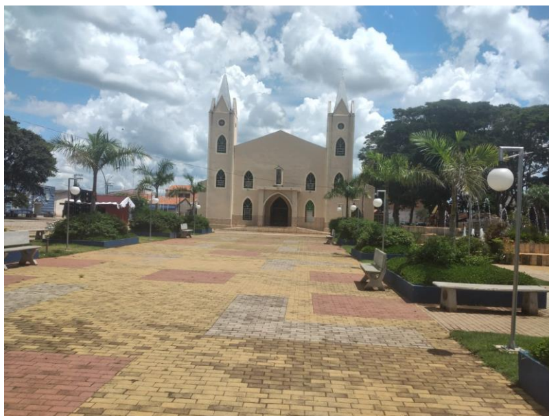
Praça Matriz de Campina do Monte Alegre (SP), em frente à catedral, onde ocorrem as festas em louvor de São Roque e Delícias do Milho.