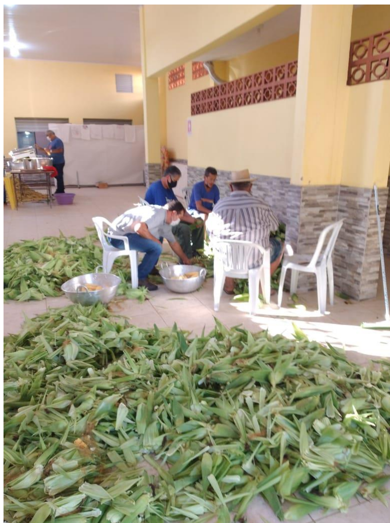
No interior do Centro Catequético, a festa Delícias do Milho começa a ser preparada com a ajuda de todos.

O Senhor C participa também da Festa de São Roque fazendo principalmente os pedidos das prendas para o santo, sempre visando a melhoria da matriz e das outras igrejas nos bairros que estão sendo construídas com o apoio dos fiéis. O entrevistado disse que se tornou uma pessoa mais carismática: “eu estou interagindo muito mais com as pessoas. Antes eu só cumprimentava, hoje é diferente, as pessoas sentam, batem um papo. O padre está junto e as pessoas confiam mais em você.” 25