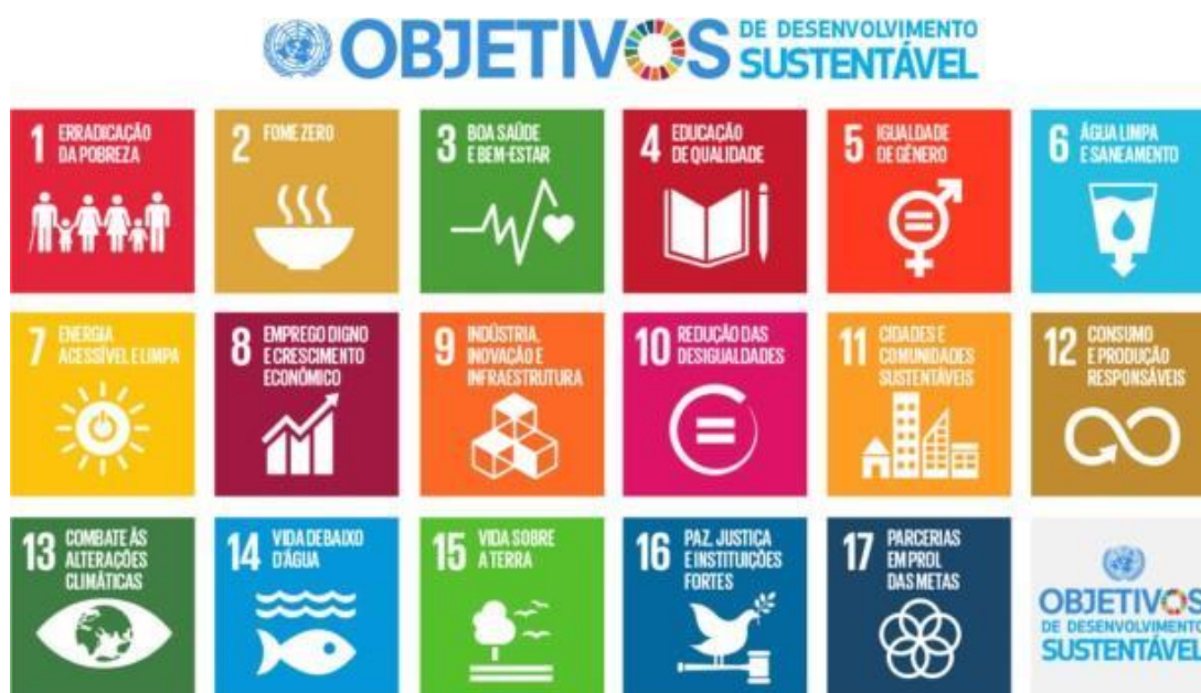
Figura 2 – Agenda 2030 das Nações Unidas