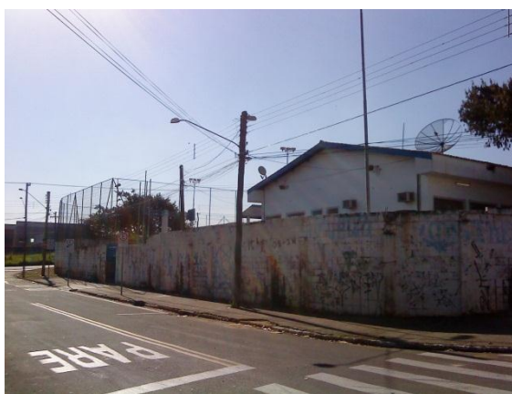
Figura 7 - Fachada. À esquerda, portão de acesso para pedestres.

Localizada na periferia de Campinas, a EMEF Renato Urbano situa-se no mesmo quarteirão do Posto de Saúde que atende os moradores dos bairros da região, dividindo muro com o mesmo. Do lado oposto está o portão de acesso para alunos (Fig. 7). Nas laterais, de um lado faz muro com uma via marginal a uma rodovia, e do outro lado está o portão que dá acesso ao estacionamento da escola. A região é formada por pequenos bairros residenciais com forte presença comercial ligada à atividade da indústria metalúrgica, com pequenas oficinas de serralheria e soldadura. Além disso, conta com um comércio popular de bares, restaurantes, drogarias, oficinas mecânicas e cabeleireiros.