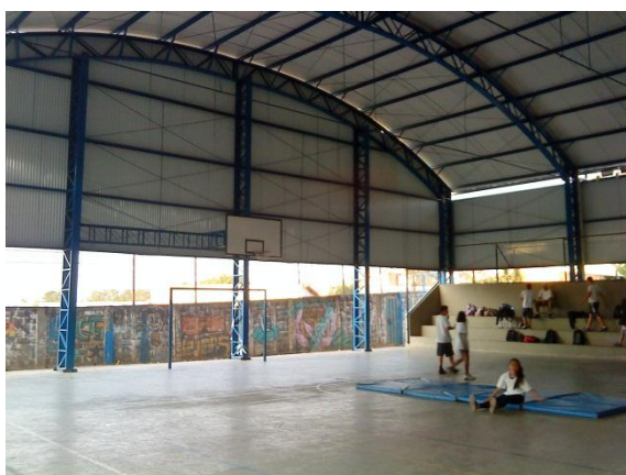
Figura 5 - Quadra de esportes coberta.

O terreno da escola é numa esquina e atravessa um dos lados do quarteirão, fazendo divisa com uma igreja católica do outro lado. Sua fachada é cercada por um alambrado, com dois portões de acesso, e os fundos da escola faz muro ora com uma rua de terra, ora com uma propriedade particular. Um dos muros da escola, que faz divisa com uma rua de terra, está em precárias condições de manutenção (Fig. 6). Por esse motivo, a diretora convocou os membros da CPA a realizarem um abaixo-assinado para a construção de um novo muro. Segundo a diretora em reunião da CPA, a escola recebeu laudo da Defesa Civil atestando a situação de risco que tal muro apresentava. Alguns alunos participaram desse abaixo-assinado, recolhendo assinaturas pela vizinhança, o que foi relatado nas entrevistas e teve um lugar de destaque entre as mobilizações citadas. Não foi a primeira vez que a escola se apropriou do espaço da CPA para construir mobilizações de reivindicação ao poder público. A história de luta pela cobertura da quadra de esportes também passa pela CPA, e pode ser observada, já no final do seu processo de conquista, nas últimas reuniões do ano de 2012 que acompanhei.