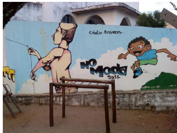
Figura 2 - Grafites no muro interno da escola, entre o parque e a igreja.