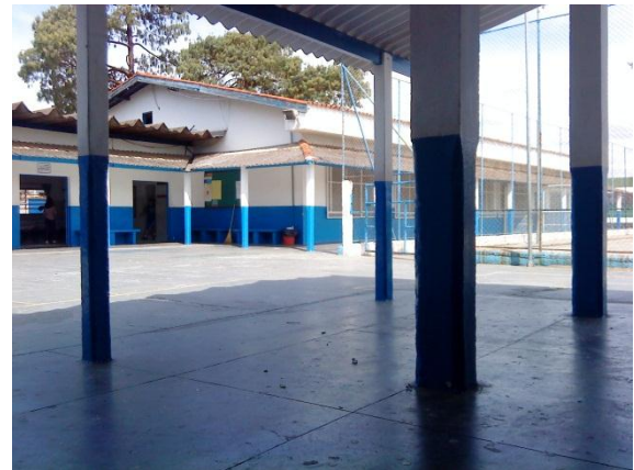
Figura 9 - Vista de parte do pátio, com quadra de esportes à direita.