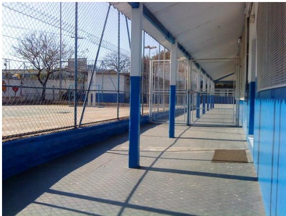
Figura 8 - Vista da entrada, quadra de esportes à esquerda.

acesso, entra-se à direita pelo rol do complexo administrativo, onde ficam a secretaria e, ao fundo, a sala da gestão. Logo à frente, está a sala de informática, também usada como sala de vídeo. À esquerda, um corredor entre as salas de aula de um lado, e a biblioteca, sala de professores e banheiro de professoras, do lado oposto. O fim do corredor dá no refeitório, onde termina a parte mais antiga do prédio escolar. Saindo pela porta do refeitório, temos acesso ao pátio (Figs. 9 e 10), de chão de cimento, onde ao redor se agrupam as salas de aula, o banheiro de alunos e uma sala de recursos, onde ficam guardados os materiais para Educação Física e os jogos utilizados nas atividades monitoradas durante os intervalos. Menos labiríntico que Noelma de Lourdes, Renato Urbano também é menor, tanto em área construída e terreno, quanto em número de salas de aula.