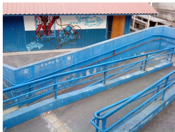
Figura 4 - Rampa de acessibilidade. Ao fundo, a antiga sala da brinquedoteca, onde hoje é a sala de vídeo.

Noelma de Lourdes pode ser considerada uma escola de prestígio na rede municipal de ensino. Foi comum, em relatos de alunos, mães e funcionárias, menções à disputa por vagas na escola, devido a sua qualidade. A escola foi a primeira da rede a ter sua quadra de esportes coberta (Fig. 5), após uma luta com o poder público que durou anos. As lutas da comunidade escolar são antigas e foram relatadas espontaneamente por mães, funcionárias e gestoras. Algumas mães, inclusive, chegaram a estudar na escola quando eram adolescentes, e outras mães e pais atualmente frequentam a Educação de Jovens e Adultos (EJA) da Fundação Municipal para Educação Comunitária (FUMEC) no estabelecimento, que funciona no período noturno. Nota-se um envolvimento significativo da comunidade do bairro com a realidade escolar.