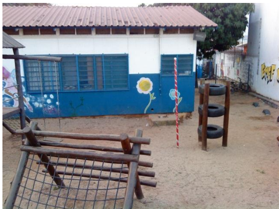
Figura 1 - Parque infantil visto do alambrado, ao lado de um dos portões de entrada.

passarela de acessibilidade (Fig. 4), vestiários e bebedouros – além de um depósito improvisado para equipamentos escolares danificados.