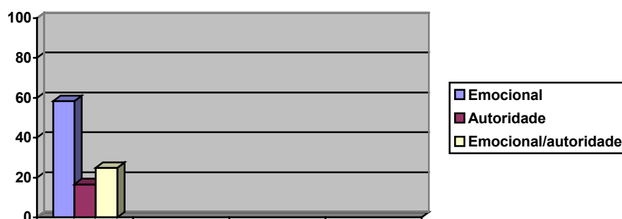
Figura 1- relações estabelecidas com os alunos:

Carmona (2000) considera que quando se incluem na categoria emocional, esquecem-se da importância de ser um referencial dentro da sala de aula, “o professor deve e pode estabelecer limites claros de autoridade (...) a cultura significa também o estabelecimento de normas que permitam uma boa convivência”.