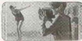
"Filmando" com o Cine-Kodak ao nível da vida

Além das pelliculas que pode tirar, a fim de completar o programma de casa, pode projectar também com o Kodascope pelliculas profissionaes reaes; quer