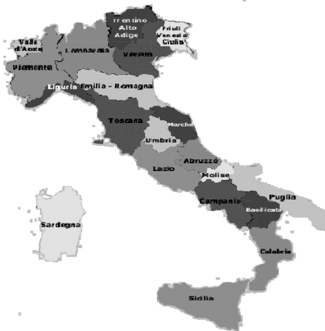
Figura 2 – Mapa da divisão do território italiano após a unificação