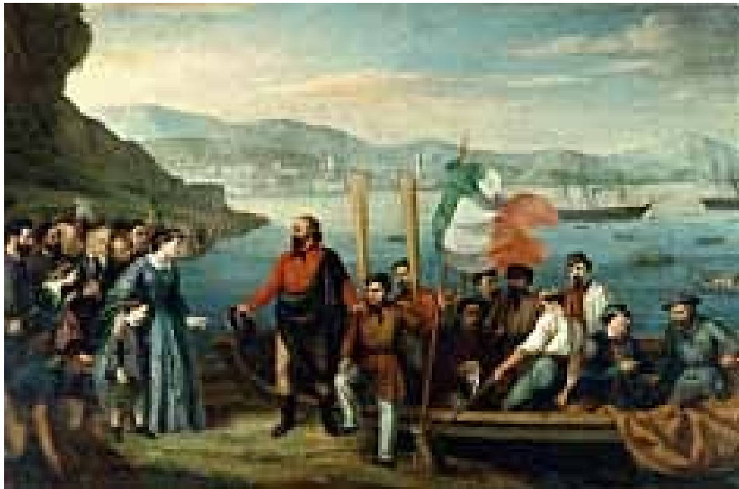
Figura 1 – Garibaldi partindo para a aventura da unificação