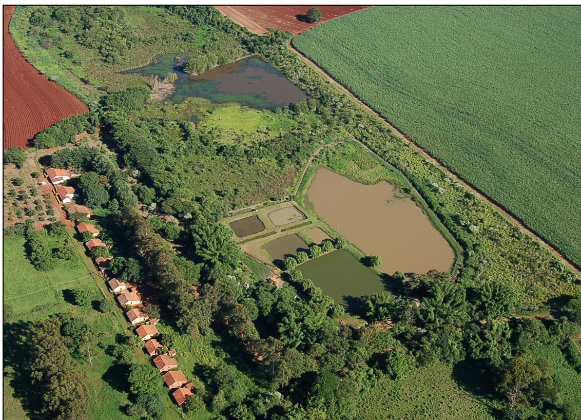
Figura 7. Foto aérea do Pesque-Pague 5.