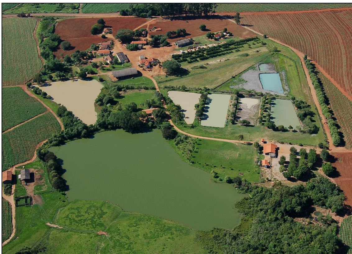
Figura 6. Foto aérea do Pesque-Pague 4