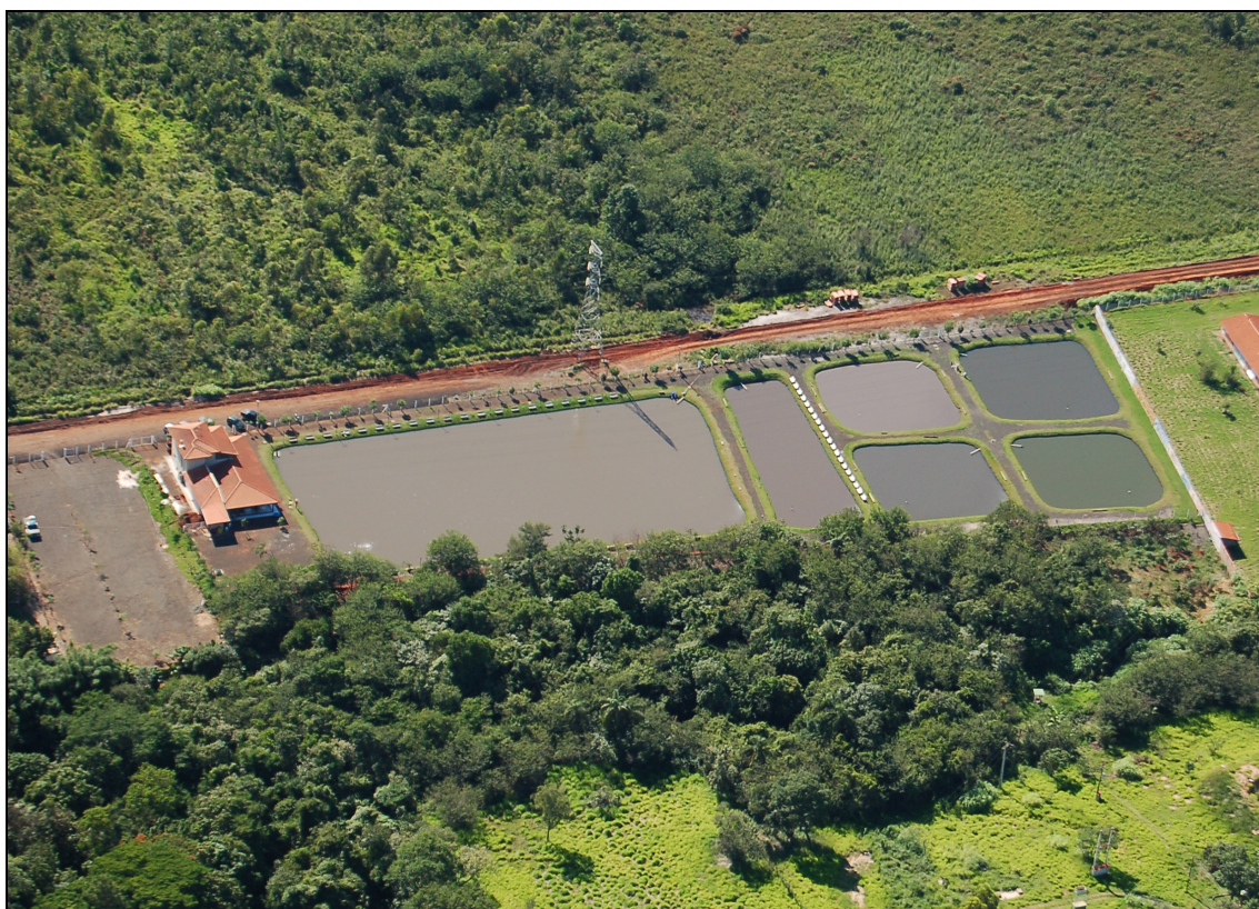
Figura 4. Foto aérea do Pesque-Pague 2.

Na foto podem-se ver os 6 tanques da unidade, sendo os últimos 2 pequenos utilizados para engorda de peixes e os outros 4 para a pesca. Acima, está a mina que abastece o pesque-pague em propriedade não pertencente ao dono do pesqueiro. Abaixo está o córrego que passa pela propriedade, cuja mata ciliar presente na área do proprietário, está bem conservada.