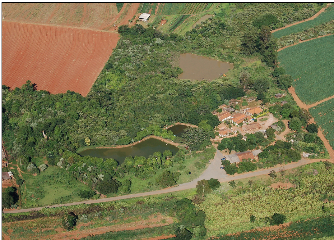
Figura 3. Foto aérea do Pesque-Pague 1.

Com a permissão dos proprietários, todas as unidades de pesque-pague foram fotografadas, o que possibilita a melhor visualização da área ocupada pelas diferentes atividades desenvolvidas na unidade, bem como a situação de preservação das áreas de reserva legal e de preservação permanente, bem como do reflorestamento realizado a pedido do órgão ambiental. A Figura 3 mostra a foto aérea do Pesque-Pague 1.