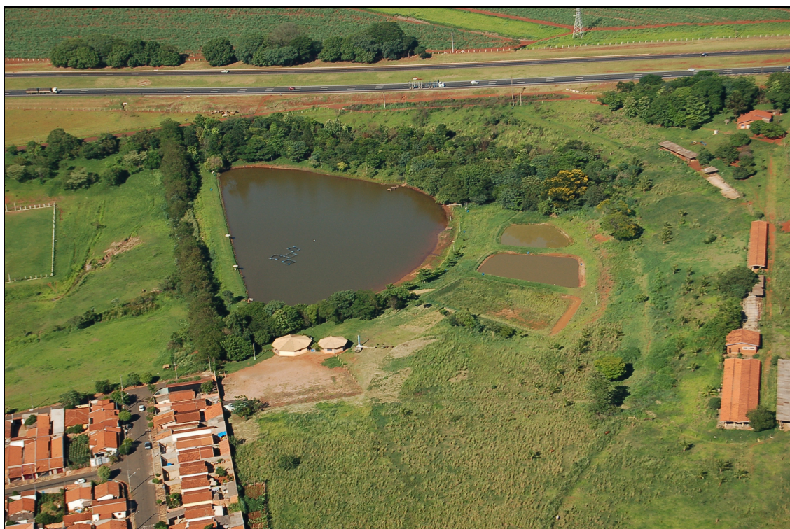
Figura 5. Foto aérea do Pesque-Pague 3.