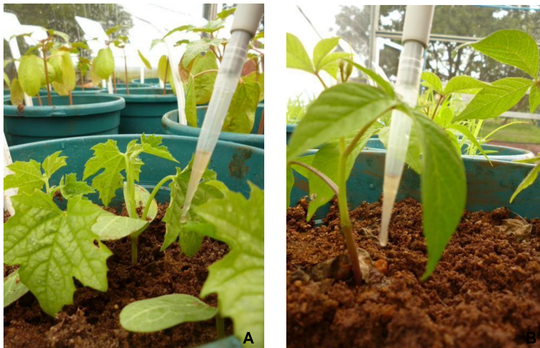
(A) plantas de Luffa aegyptiaca ; (B) plantas de Merremia aegyptia , sendo inoculadas com nematóides das galhas.

As plantas foram adubadas quatro vezes durante a condução do experimento com solução nitrato de potássio, nitrato de cálcio, MAP, sulfato de magnésio e micronutriente. Cada vaso recebeu 50 mL da solução em cada adubação resultando em 200 mL durante o período experimental.