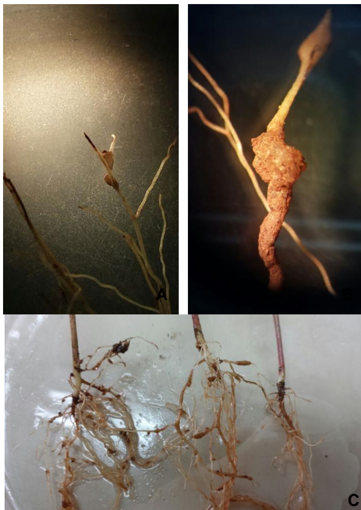
(A) Galhas de Meloidogyne incognita (raça 3) em raízes de Ipomoea triloba vista ao microscópio de luz aumento de 10x; (B) massa de ovos de M. incognita (raça 3) em raízes de I. triloba vista ao microscópio de luz aumento de 100x; (C) raízes de I. triloba com galhas. Fonte: o Autor (2015).

Algumas espécies de corda-de-viola são importantes hospedeiras de nematóides do gênero Meloidogyne , no trabalho de Ferraz, Pitelli e Soubhia (1982), as plantas I. acuminata e I. aristolochiaefolia , sofreram ataques severos de M. incognita . Para Mônico et al. (2009), as espécies M. cissoides , I. purpurea e I. nil , foram suscetíveis a M. incognita (raça 1) e M. javanica , já para M. incognita (raça 3), apenas M. cissoides foi resistente. Isso mostra a diferença de reação das espécies às diferentes raças, quando falamos em M. incognita . Mônico et al. (2008), em outro trabalho, verificaram que I. triloba foi suscetível