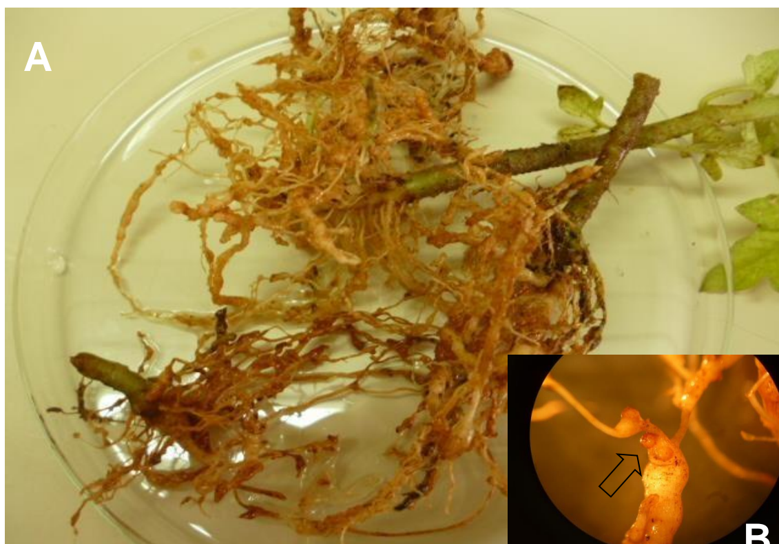
(A) raízes de tomate com galhas de M. javanica vistas em estereoscópio; (B) massa de ovos vista ao microscópio de luz em aumento de 100x.

O preparo do inóculo foi feito segundo o método de Hussey e Barker (1973), adaptada por Bonetti e Ferraz (1981), e a quantificação de ovos e juvenis foi realizada em lâmina de Peters, com o auxílio de um microscópio de luz para posterior inoculação. Foram feitas três contagens e calculada a média presente em um mL. Este valor foi multiplicado pelo volume total, determinando o número total de ovos e J 2 disponíveis para inoculação.