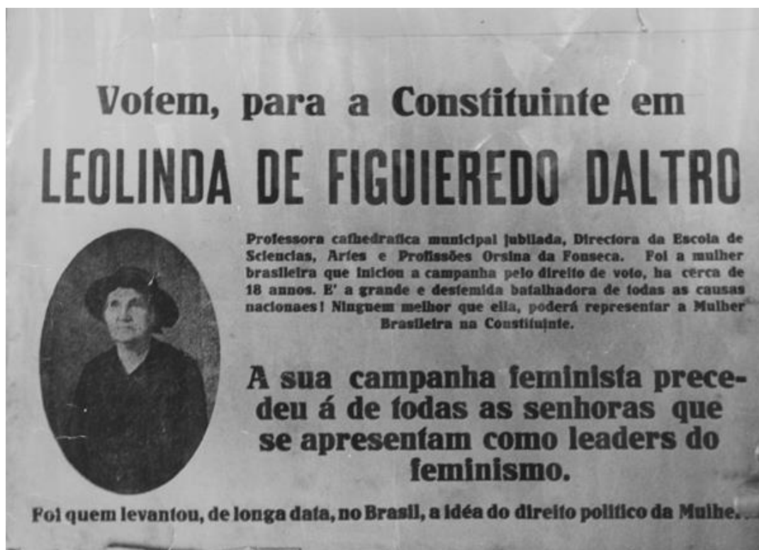
Figura 2: Panfleto Leoninda