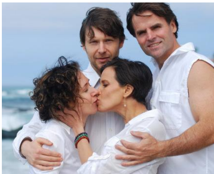
Figura 3: Polyamory, married and dating