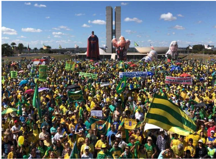
Figura 1: Manifestações a favor da Lava Jato em Brasília