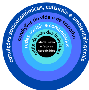
FIGURA 1. Modelo de determinação social da saúde , adaptado de Dahlgren Withehead (1991).

O campo da promoção de saúde visa incidir sobre as condições de vida da população e propõe um novo paradigma que integra conceitos e ideias advindos de diferentes disciplinas, tais como a educação, a saúde, o território, o trabalho, a alimentação, o meio ambiente, o acesso a serviços essenciais e ao lazer (Sicoli; Nascimento, 2003). Esta perspectiva visa à autonomia dos sujeitos e coletividades e, assim, reflete e inspira mudanças significativas nas formas de atuar em saúde. Nesse sentido, busca empoderar os sujeitos e fortalecer recursos individuais e coletivos, para que se possa lidar com a multiplicidade dos DSS (Czeresnia, 2003), almejando fortalecer a saúde através da construção da capacidade de escolha via ampliação do conhecimento e da percepção das diferenças e das singularidades dos fatos.