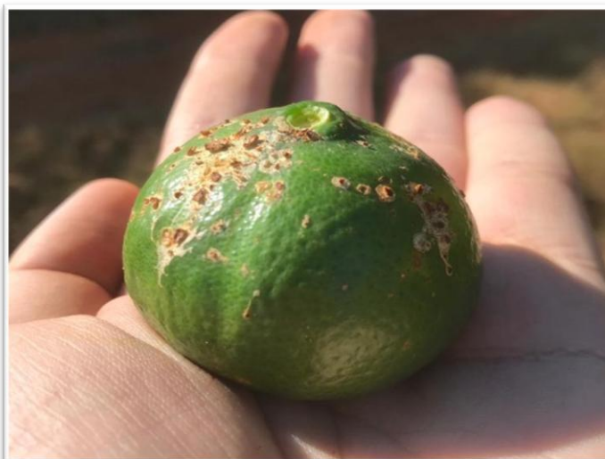
Figura 2 - Fruto com alta incidência de sintomas típicos de mancha marrom de alternária ( Alternaria alternata ). (Cordeirópolis, SP, 2021).