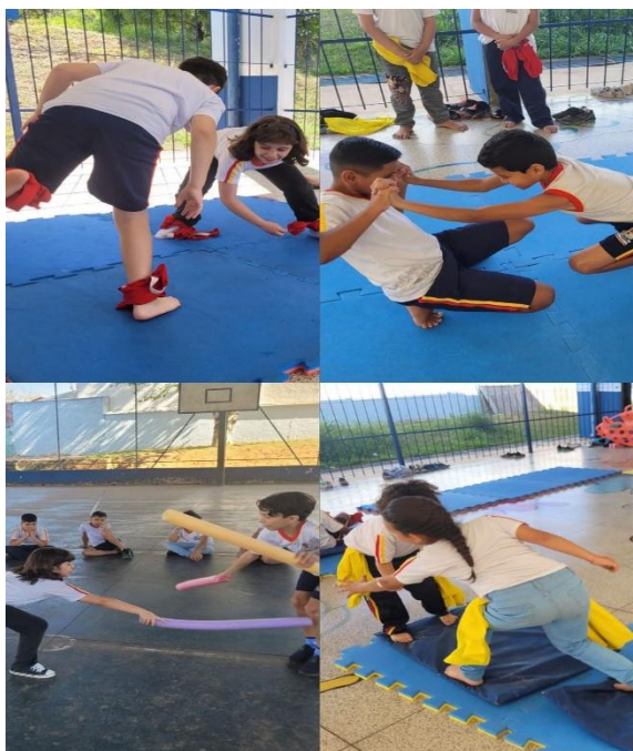
Imagem 9 – Lutas africanas