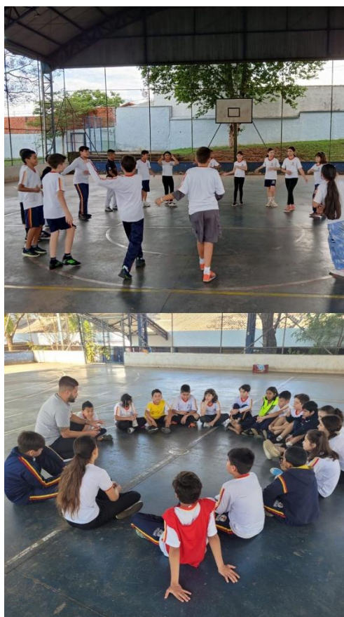
Imagem 13 – Práticas circulares e rodas de conversa