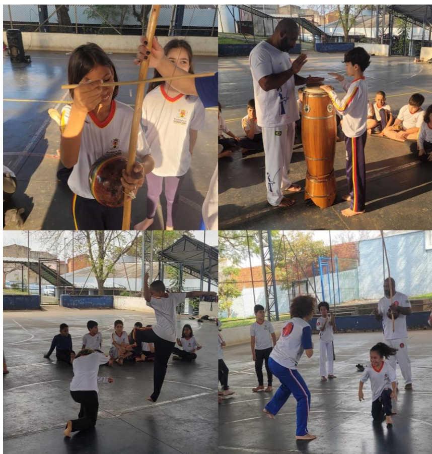
Imagem 6 – Capoeira

Tal fala revela o entendimento do corpo como sujeito ativo do conhecimento, que aprende na experiência e na relação.