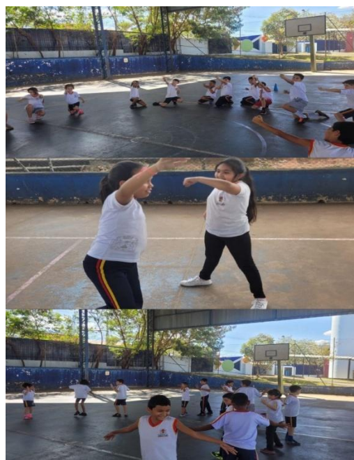
Imagem 3 – Arquétipos dos deuses