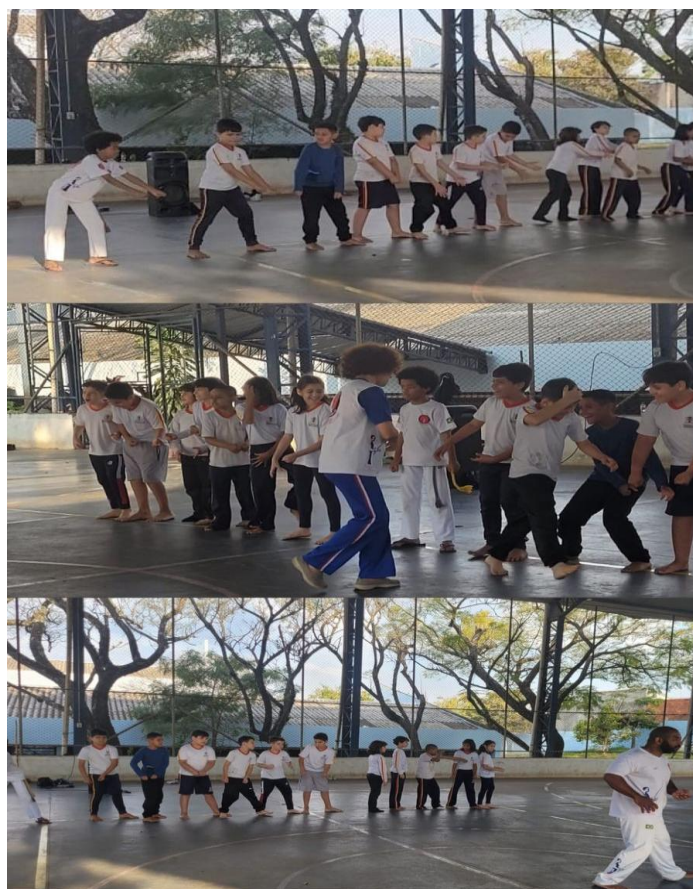
Imagem 5 – Puxada de rede