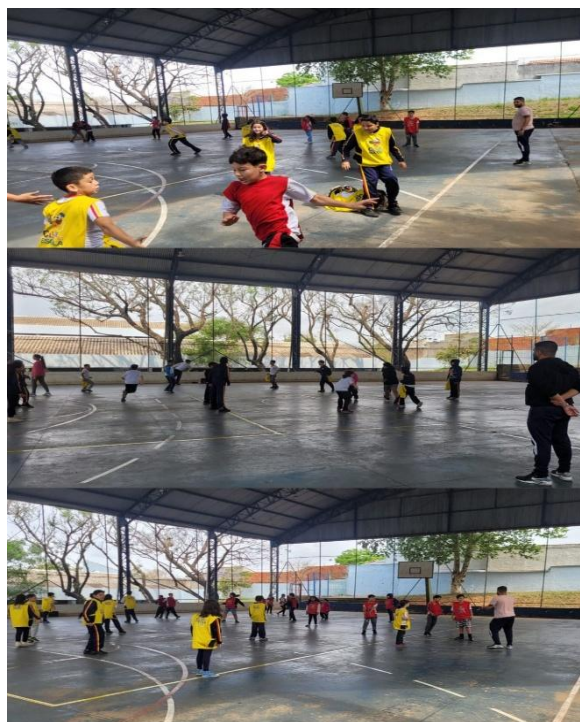
Imagem 10 – Defesa do território: coletividade