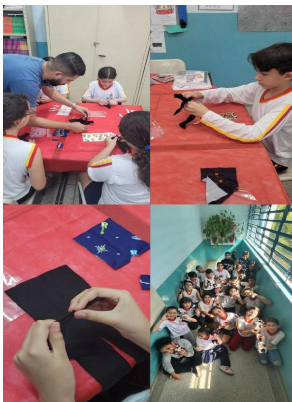
Imagem 1 – Confecção boneca Abayomi

Nas aulas iniciais, especialmente na confecção da boneca Abayomi, o corpo já se apresentou como suporte de memória e ancestralidade. O gesto de amarrar tecidos, executar nós e montar a boneca foi acompanhado por reflexões sobre diáspora africana, deslocamento forçado e resistência. Nesse quadro, o corpo das crianças não esteve dissociado do pensamento: mãos, olhos, posturas e falas construíram sentidos simultaneamente. Quando os (as) estudantes afirmaram que guardariam a Abayomi como algo “para levar para a vida toda” (Papiro 1, Memória 1, 2025), evidenciou-se o corpo como lugar onde o passado se inscreve e permanece vivo no presente. Essa experiência inaugura uma compreensão ontológica do corpo como portador de história, alinhada aos FOA, nos quais corpo, memória, espiritualidade e coletividade não se separam.