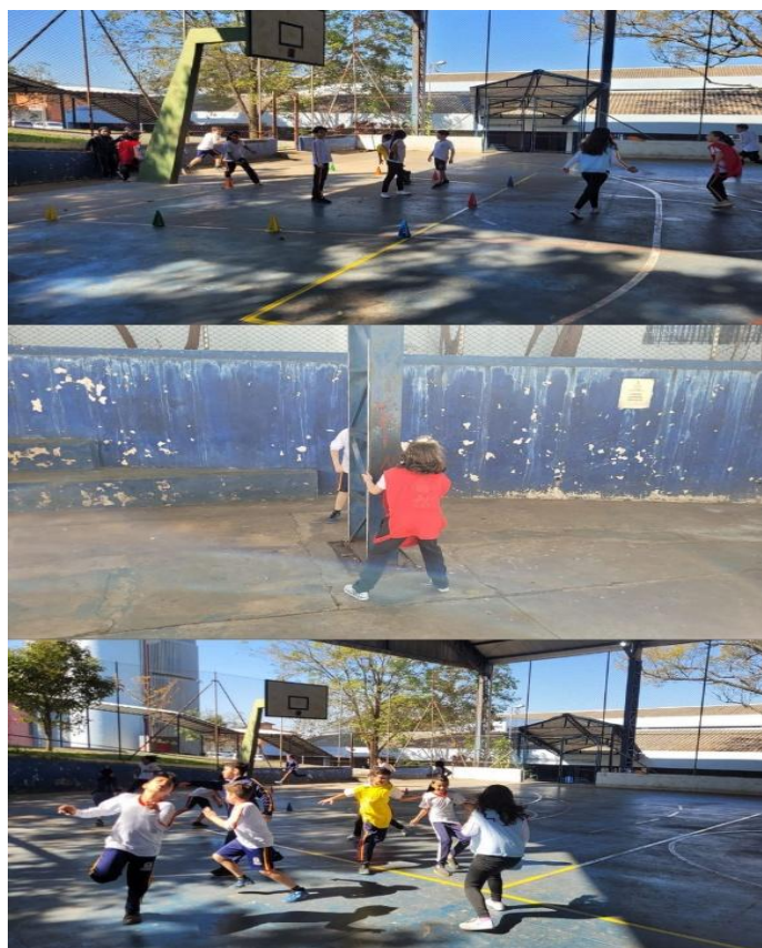
Imagem 4 – Jogo Capitão do Mato