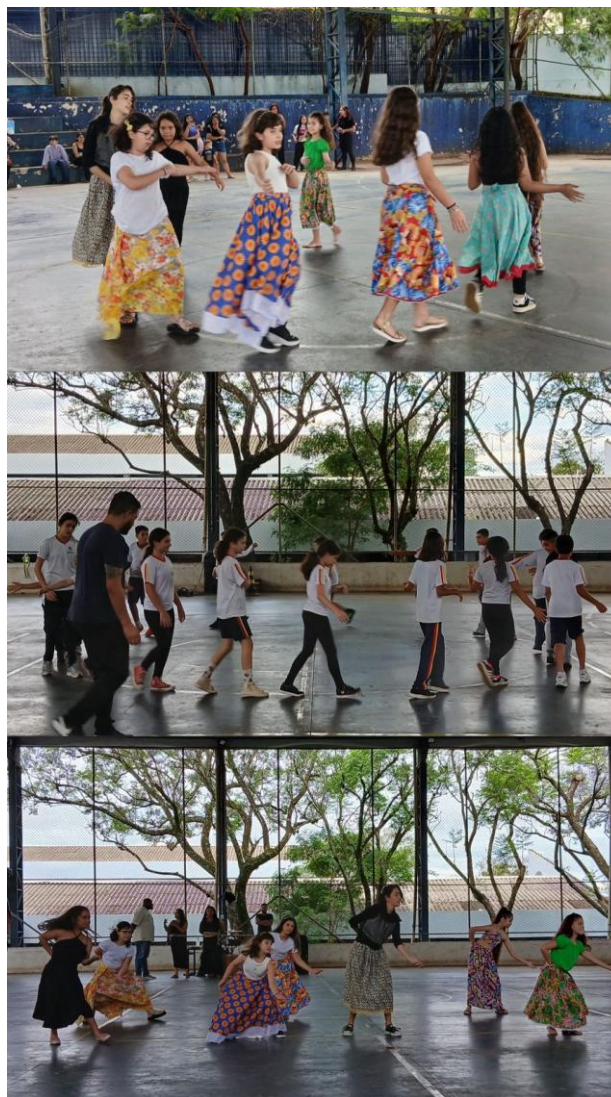
Imagem 11 – Quilombo dos sonhos: celebração do corpo