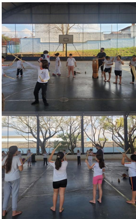
Imagem 7 – Maculelê