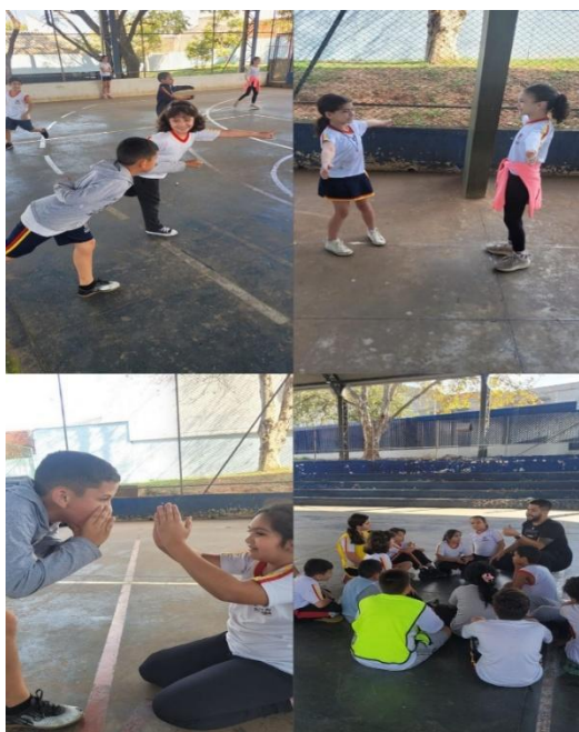
Imagem 2 – Elementos da natureza

“Em tempos passados, as denominadas imagens primordiais, ou arquétipos, relacionavam-se às percepções e ao entendimento de mundo e povos e das culturas antigas, que correspondiam às suas matrizes místicas, interferindo-na e conduzindo a vida” (Couto, 2022, p. 62).