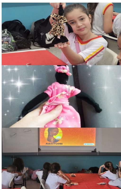
Imagem 12 – Abayomi: memórias para a vida

Silva (2016) destaca que o ensino das manifestações das culturas populares sobrevém por meio da oralidade, bem como também, da memória, da ancestralidade além disso, da ritualidade, em meio ao dia a dia de determinado grupo, tendo em vista que o método de difusão e absorção da variedade de saberes/fazeres procede por meio das experiências vividas com o corpo.