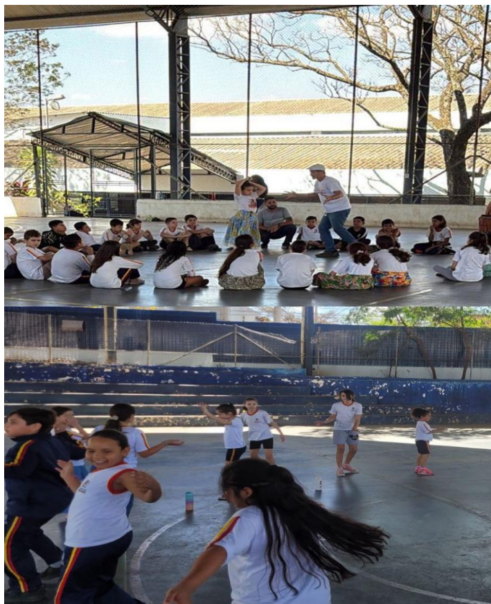
Imagem 8 – Danças afro-brasileiras: contextualização e experimentação