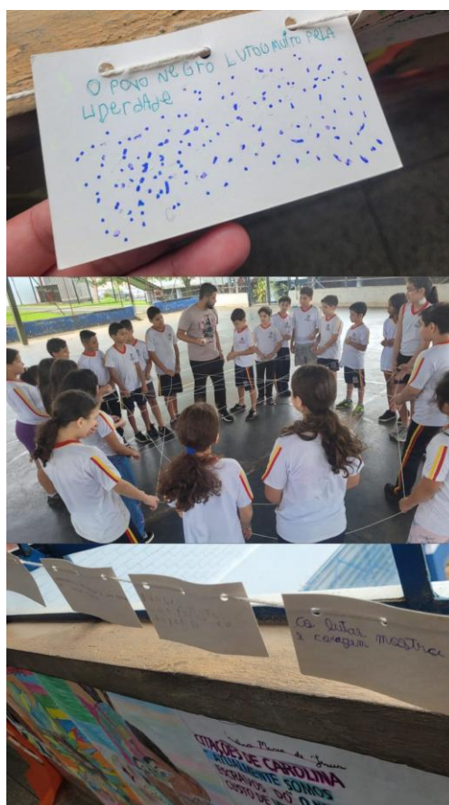
Imagem 15 – Tecendo vidas

Assim, podemos ver a partir dessas descobertas que os (as) estudantes adquiriram mais do que apenas conhecimento teórico por meio de suas aulas; eles também adquiriram valores. Aprenderam que a história desempenha um papel em como vemos o mundo e como tratamos os outros. Os (as) estudantes agora têm uma atitude diferente em relação à história negra de nosso país (Freire, 1996).