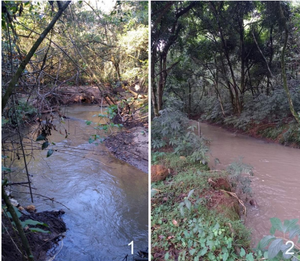
Figuras 1–2. Trechos lóticos, montante (1) e jusante (2) localizados no interior da Universidade Federal de São Carlos, registrados no momento da coleta. Ambos são caracterizados por pouca profundidade (40 cm), presença de mata ripária e leito arenoso, sendo a jusante também possui leito pedregoso.

também ocorreu numa extensão de 50 metros. Ambos os trechos foram determinados em relação a represa (Figs. 4 e 5).