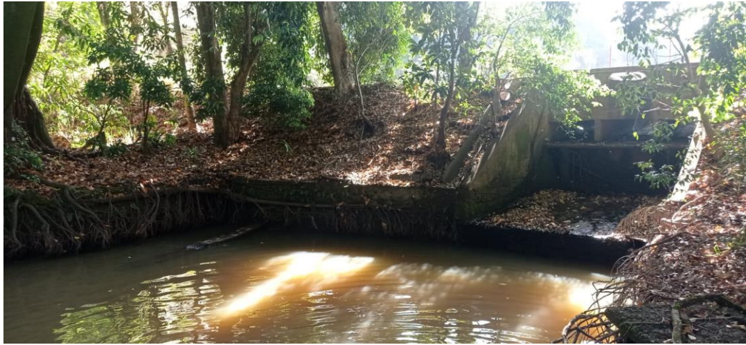
Figura 3. Trecho semi-lótico localizado logo após a barragem na Universidade Federal de São Carlos.