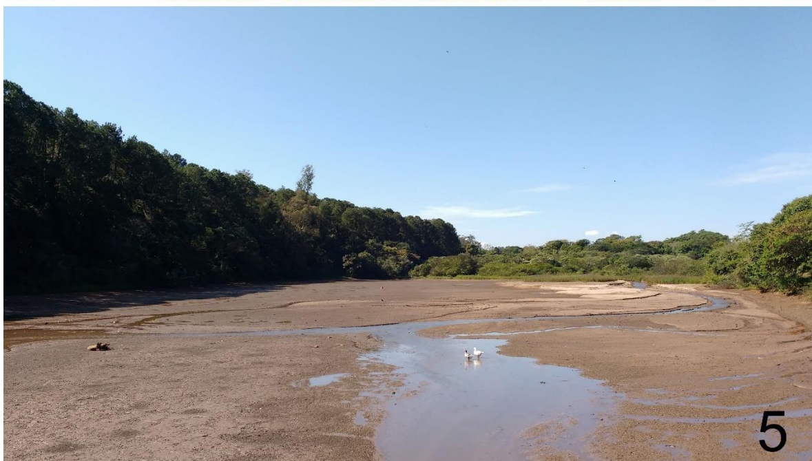
Figuras 4–5. Imagem aérea da represa Monjolinho antes do descomissionamento (4) e imagem da represa após o descomissionamento (5) em que se forma um ambiente lótico raso e estreito.

As coletas foram padronizadas e realizadas nos anos de 2019, 2023 e 2024, em período de seca, sob a licença do IBAMA/ SISBIO de n° 57178-1 e projeto de pesquisa aprovado pela Comissão de Ética no Uso de Animais da UFSCar (CEUA n° 6408271117). A montante do reservatório, o trecho é cercado por mata ripária de Cerrado em seu torno, leito