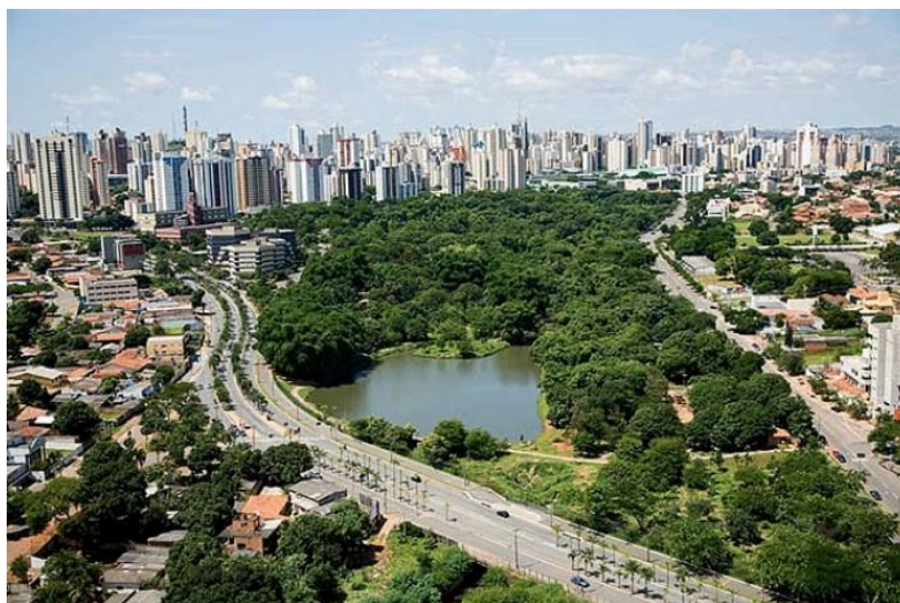
Figura 1 - Foto de Goiânia, a cidade mais arborizada do Brasil segundo o IBGE em 2021

Os locais arborizados são, geralmente, mais agradáveis aos sentidos humanos, porque reduzem a amplitude térmica, diminuem o potencial de temperaturas extremas, controlam a direção e a velocidade dos ventos, promovem o sombreamento, contribuem para a redução da poluição atmosférica, sonora e visual. Nesse contexto, florestas urbanas constituem um pré-requisito para um ambiente urbano saudável, essencial para a harmonia entre o ser humano e os ambientes nos quais ele está inserido (LOCKE & BAINE, 2015; KOLBE et al. , 2016; SARTORI et al. , 2018). Ambientes urbanos geralmente são mais quentes que seus ambientes rurais circundantes por conta de um fenômeno chamado “Ilha de calor”.