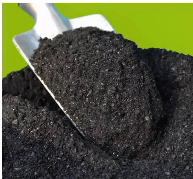
Figura 5 - Biochar

O biochar é um material carbonoso produzido pela pirólise de biomassa, que é a decomposição térmica de matéria orgânica em ausência de oxigênio. Este processo resulta em um produto estável e altamente poroso que possui características únicas que o diferenciam de outros tipos de carvão. A principal vantagem do biochar é sua capacidade de sequestro de carbono, o que significa que ele pode capturar e armazenar carbono por períodos prolongados, contribuindo para a mitigação das mudanças climáticas (LEHMANN & JOSEPH, 2015).