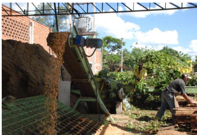
Figura 7 - Produção de briquetes com resíduos de poda urbana na cidade Presidente Prudente