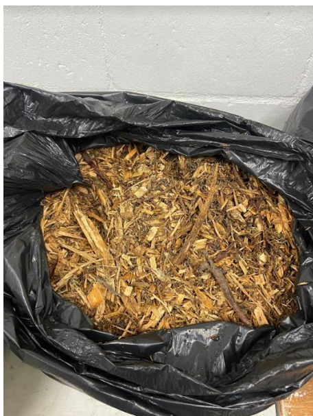
Figura 4 - Poda triturada