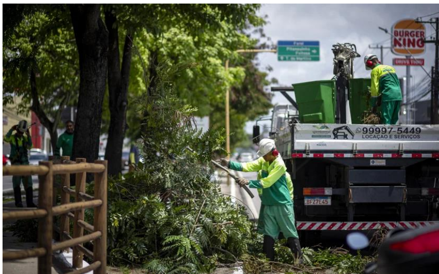
Figura 2 - Processo de poda urbana na cidade de Maceió, no estado de Alagoas