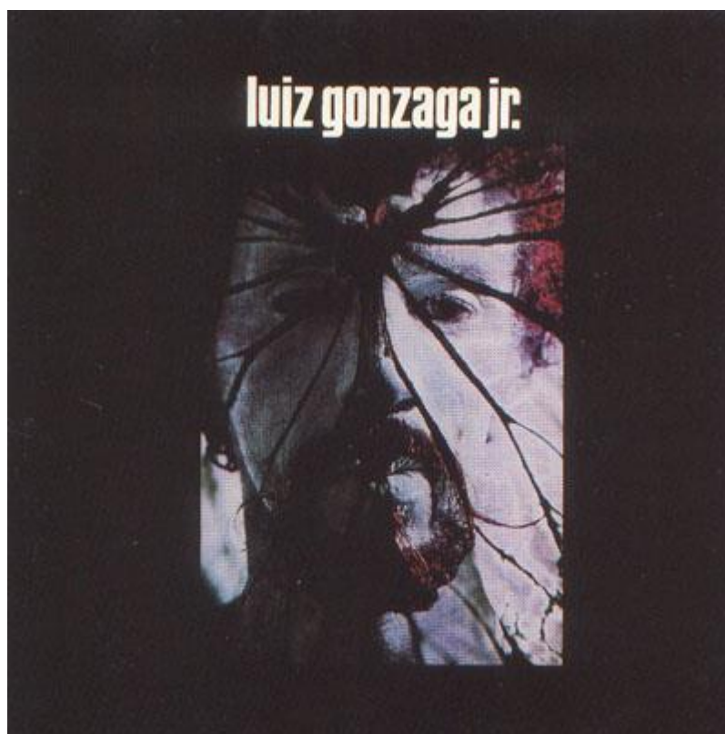
Figura 2 - Capa do disco Luiz Gonzaga Jr , lançado pela gravadora EMI-Odeon no ano de 1973

Em compasso com o teor e a carga das canções, a capa do álbum Luiz Gonzaga Jr (lançado em 1973 pela EMI-Odeon) carrega um aspecto vítreo cuja característica comum ao impacto de um projétil seja a formação de trincas em formação radial a partir do ponto de contato. A eficácia do tiro transparece no rosco pálido, no olhar igualmente vitrificado e inerte. Os fracos e parcos sinais vitais e de esperança presentes nesse disco serão paulatinamente substituídos, adiantamos, pela talvez principal força revolucionária da obra de Gonzaguinha, a alegria.