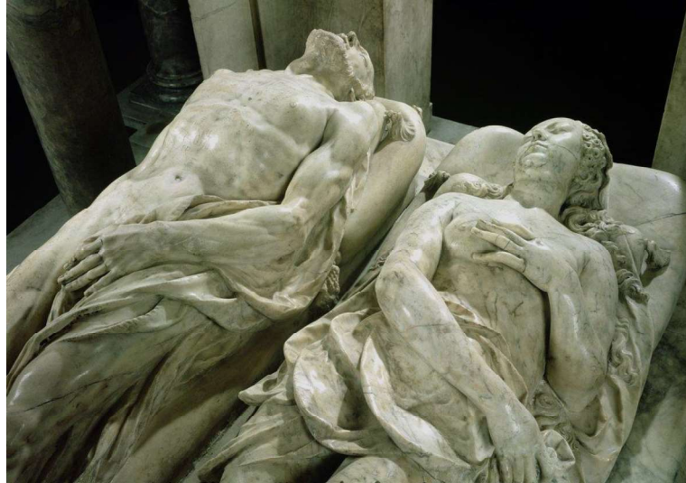
Figura 4. Pilon, G. (1562–1573). Túmulo de Catarina de Médici e Henrique II (detalhe das efígies) [Escultura em mármore]. https://www.meisterdrucke.pt/impressoes-artisticas-sofisticadas/Germain-Pilon/355770/

No que se refere à segunda categoria de temas, é a partir do século XVI que se opera uma nova aproximação entre Tânatos e Eros 3 , de forma que os temas macabros passam a ser carregados de sentidos eróticos. Observamos o cavalo do cavaleiro do Apocalipse de Dürer, marcado por sua magreza esquelética e pelo contrastante realce da força de seus órgãos genitais; a jovem violada sexualmente pela figura da morte, ilustrada por Niklaus Manuel; e até mesmo a cena de Romeu e Julieta no túmulo dos Capuleto, evidenciando a ascensão de cenas de amor nos cemitérios e túmulos, multiplicadas no teatro barroco (Ariès, 1977/2012).