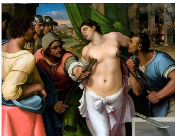
Figura 7. Zurbarán, F. (c. 1630). Martírio de Santa Ágata [Pintura]. https://pt.wikipedia.org/wiki/Ficheiro:Francisco de Zurbarán 011.jpg

destacar que, com a Reforma de Trento 4 , as cenas de violência e de tortura se multiplicaram e passaram a se relacionar diretamente aos temas erótico-macabros. A morte deixava de ser um evento pacífico ou um momento de concentração moral: tratava-se agora de algo inseparável da violência e do sofrimento. “Não é mais finis vitae , mas ‘extirpação da vida, longo grito arquejante, agonia despedaçada em múltiplos fragmentos’” (Ariès, 1977/2014, p. 495).