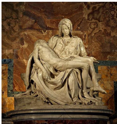
Figura 2. Michelangelo. (1498–1499). Pietà [Escultura]. Basílica de São Pedro, Vaticano. https://pt.wikipedia.org/wiki/Pietà_(Michelangelo)

Dessa forma, as representações da morte e da decomposição não significavam e nem pretendiam exprimir o medo da morte ou do Além – ainda que tivessem sido utilizadas para isso; eram antes “o sinal de um amor apaixonado pelo mundo terrestre, e de uma consciência dolorosa do fracasso a que cada vida humana está condenada” (Ariès, 1977/2014). 2