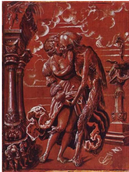
Figura 6. Deutsch, N. M. (c. 1517). A donzela e a morte [Gravura]. https://tendimag.com/2018/10/19/o-ultimo-beijo/

Dessa forma, a relação entre a morte e o prazer se tornava tão entrelaçada que o corpo morto passava a ser, por sua vez, objeto de desejo (Ariès, 1977/2014). Importante