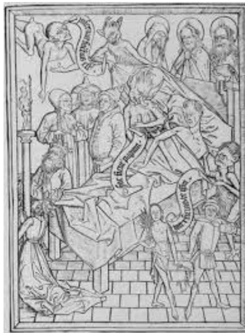
Figura 1. Autor desconhecido. (século XV). Tentação diabólica sobre a fé (Ars moriendi) [Ilustração]. Em D. Santos & A. Sonaglio (2017), A Ars moriendi e a construção da “boa morte” (p. 15). Brathair: Revista de Estudos Celtas e Germânicos , 17(1). Repositório PPG/UEMA..

morrer), concebe uma luta cósmica, na qual se travava, ali, uma disputa entre o bem e o mal, visando como prêmio a alma do doente. O moribundo, nesse caso, apenas assiste ao confronto como mero telespectador, embora ele mesmo esteja em jogo (Ariès, 1977/2012).