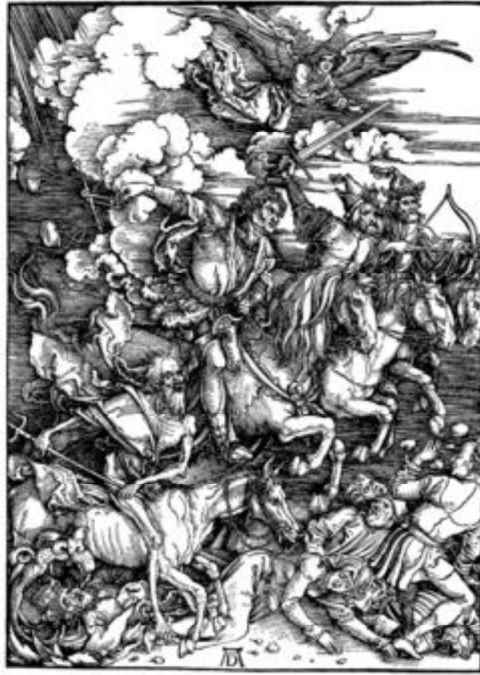
Figura 5. Dürer, A. (1498). Os quatro cavaleiros do Apocalipse [Gravura em madeira]. https://pt.wikipedia.org/wiki/Os_Quatro_Cavaleiros_do_Apocalipse_(Dürer)