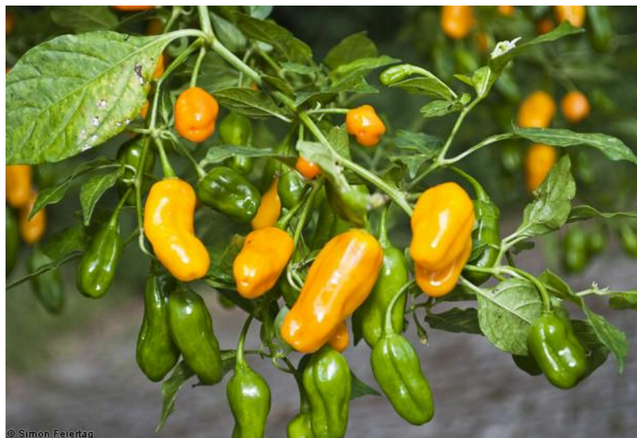
Figura 1 - Exemplar de Pimenta-de-cheiro ( C. chinense ).