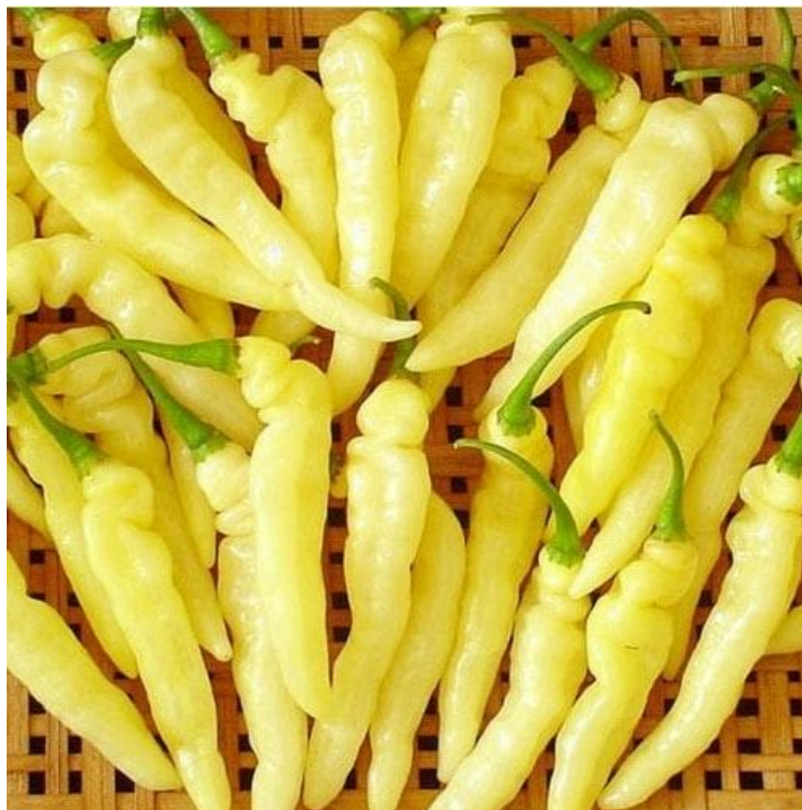
Figura 3 - Exemplar de pimenta Marupi ( C. chinense ).