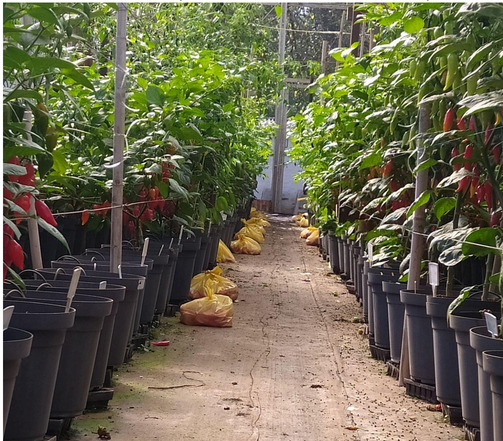
Figura 7 - Pimenteiras desbrotadas e tutoradas, em fase de reprodução, com a presença de frutos desenvolvidos e em ponto de colheita. CCA, UFSCar, campus Araras..