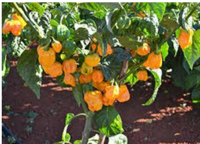
Figura 4 - Exemplar de pimenta Habanero ( C. chinense ).