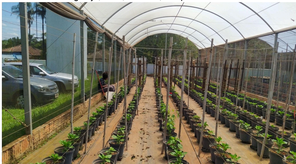
Figura 6 - Ambiente protegido com vasos dispostos em fileiras duplas e fertirrigação por gotejo, CCA, UFSCar, campus Araras.