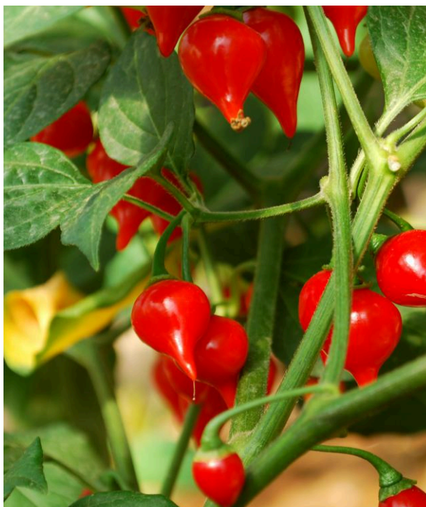
Figura 5 - Exemplar de pimenta Biquinho ( C. chinense ).