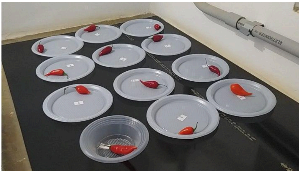
Figura 9 - Pratos brancos dispostos com um exemplar de fruto de cada linhagem para análise sensorial.

Cada atributo foi classificado em uma escala de um a cinco, em que: 1 = muito fraco; 2 = fraco; 3 = médio; 4 = forte; 5 = muito forte.