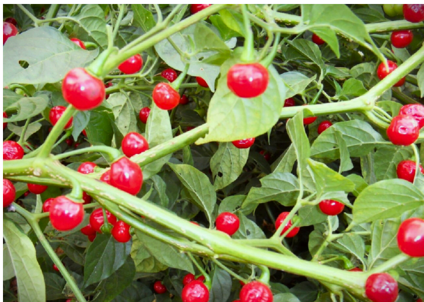
Figura 2 - Exemplar de Pimenta-de-bode ( C. chinense ).