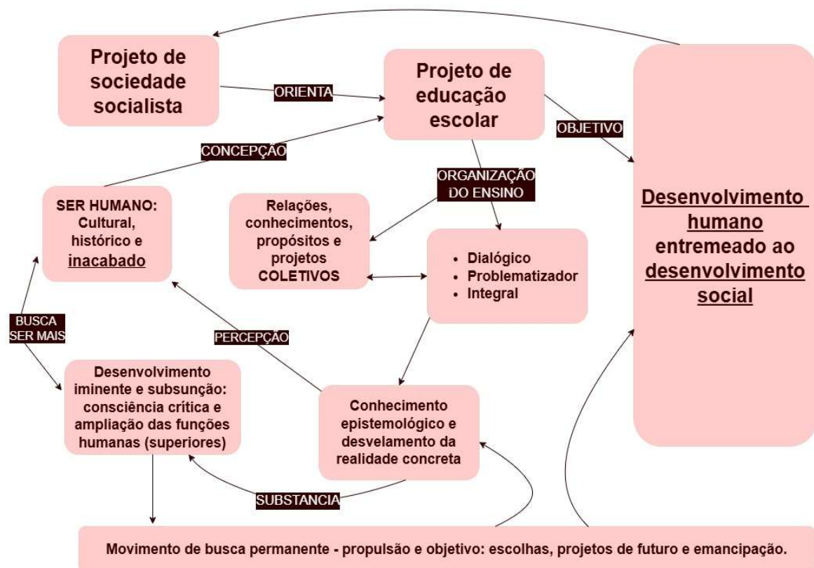
Figura 2: Relação entre conceitos – Síntese do diálogo Vigotski e Freire

Por essa razão insistimos tanto da explicitação do projeto societário que se desdobra em concepções de sujeitos e de ensino, a partir das quais Freire e Vigotski se constituíram enquanto teóricos e puderam formular suas próprias contribuições. E o diálogo proposto é o que converge entre essas contribuições.