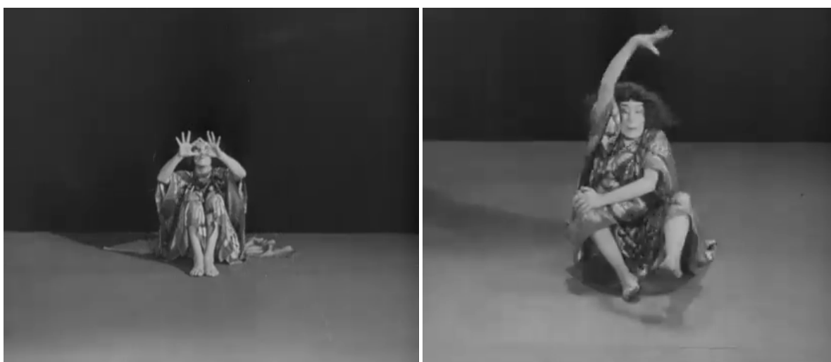
fig. 1 e 2: Stills de Hexentanz .

Mary Wigman, diz, sobre sua coreografia Hexentanz — a dança da bruxa: “Foi maravilhoso abandonar-se ao desejo malévolo de absorver as forças que ousam se manifestar apenas sob nossa aparência civilizada.” 3 (SÁNCHEZ, 2019. pág. 355).