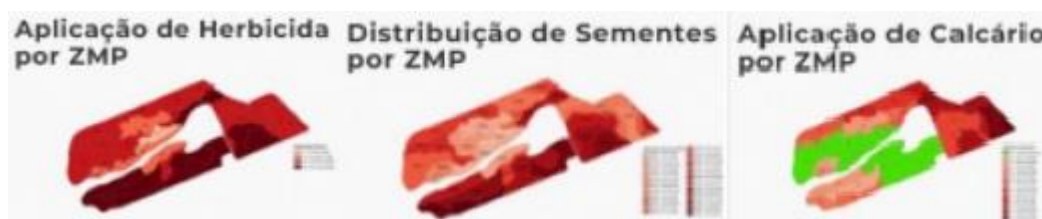
Figura 3: Apresenta mapas de herbicida, de semente e de calcário por zona de manejo permanente.

Em seu trabalho Vieira (2021), demonstra que a inteligência artificial traz ganhos na produtividade, redução de custos e produção mais sustentável. Uma vez que há utilização da inteligência artificial reduz o uso de agrotóxico aplicado no cultivo de cana de açúcar. Nesse contexto, IA permitr detreminar a aplicação de defensivos agrícolas, fertilizantes e sementes na quantidade localidade correta, como está na figura 3.