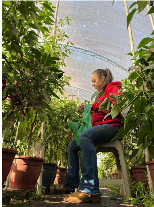
Figura 7 - Coleta realizada para posterior avaliação quantitativa e qualitativa.