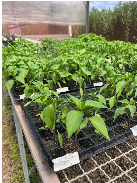
Figura 2 - Mudas pré-transplante em seus devidos vasos (UFSCar - Araras, 2024).