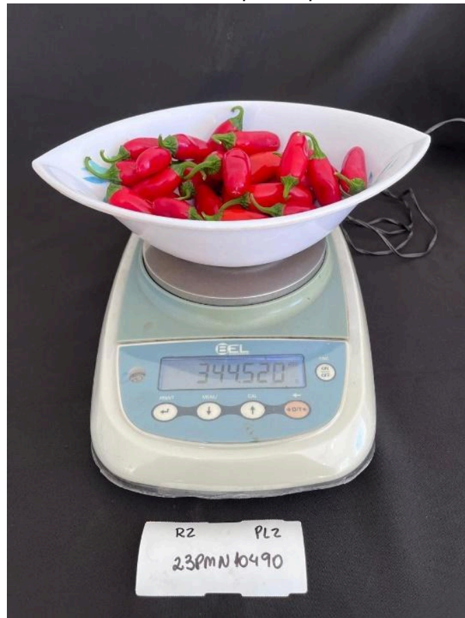
Figura 8 - Massa total de frutos de uma planta pesada em balança de analítica.