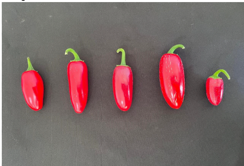
Figura 10 - Registro de níveis de estria, desde sem, até consideráveis.