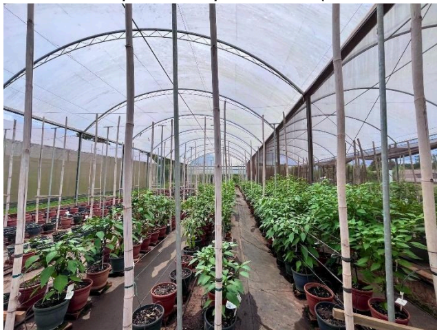
Figura 3 - Estufa estruturada para o experimento (UFSCar, Araras 2024).

Para o controle de pragas e doenças era feita a catação de plantas infestantes semanalmente de maneira manual, monitoramento por meio de inspeção visual, observando-se atentamente as plantas em busca de quaisquer alterações ou sinais atípicos, além de periódicas pulverizações para pulgões, trips e mosca-branca, sempre que necessário.