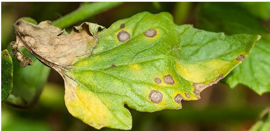
Figura 2. Requeima em Tomate.

A requeima (Figura 2), causada pelo oomiceto Phytophthora infestans , é uma das doenças mais destrutivas para culturas como tomate e batata, apresentando sintomas que afetam folhas, caules e frutos. Inicialmente, aparecem pequenas manchas escuras que aumentam de tamanho nas folhas, muitas vezes rodeadas por áreas amareladas. À medida que a doença avança, as folhas podem apresentar necroses completas, com manchas circulares ou irregulares, de contornos claros e bordas bem definidas, resultando em desfolha severa. Nos caules, surgem lesões alongadas e necróticas, que podem levar a fissuras e rachaduras, além de áreas necróticas com coloração marrom a preta. Nos frutos, destacam-se lesões deprimidas e úmidas, frequentemente de coloração marrom ou preta, que progridem rapidamente para o apodrecimento total. Um dos sinais característicos da requeima é o aspecto encharcado das lesões e a formação de mofo branco em condições de alta umidade, principalmente em folhas e frutos, indicando a esporulação do patógeno (Kimati et al., 2005).