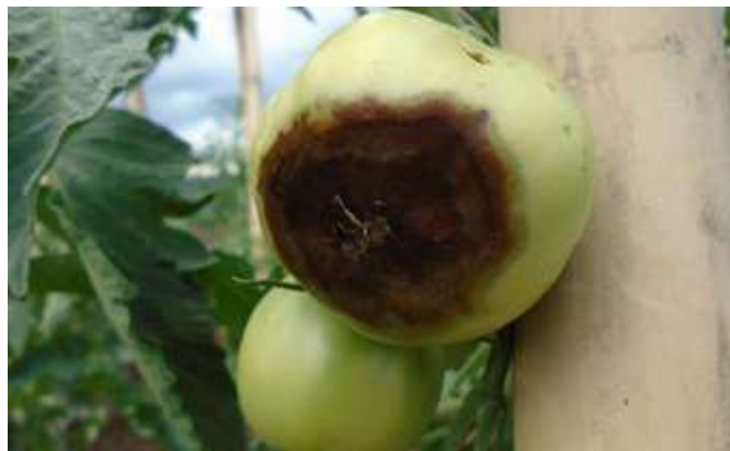
Figura 11. Deficiência de Cálcio em Tomate.

A deficiência de cálcio (Ca) (Figura 11) nas plantas é um distúrbio nutricional que causa diversos sintomas que afetam o crescimento e a qualidade dos frutos. As folhas tornam-se deformadas, menores, enrugadas e encarquilhadas, enquanto os frutos apresentam tamanho reduzido, deformações e coloração não uniforme. A deficiência de cálcio também pode resultar na queda prematura de flores e frutos. O sistema radicular fica comprometido, com redução no volume e comprimento das raízes, que se tornam finas e pouco ramificadas. A planta apresenta sinais de murcha e necrose nas extremidades das folhas (queima marginal), que passam a ter bordas amarelas ou marrons. Nos frutos, observa-se necrose apical, com queima nas pontas, além de rachaduras. As folhas jovens apresentam enrolamento, tornando-se espessas e duras, com uma textura cerosa ou crocante. A dificuldade na formação de flores e frutos é outra consequência da deficiência, que também causa desidratação e escurecimento nas lesões. O manejo adequado da nutrição, incluindo a reposição de cálcio, é essencial para prevenir e corrigir esses sintomas (Minami & Haag, 1980).