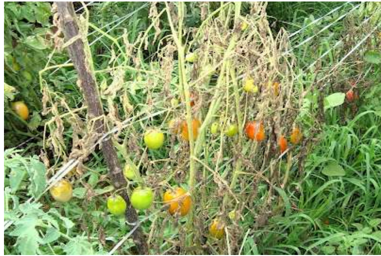
Figura 4. Murcha-Bacteriana em Tomate.