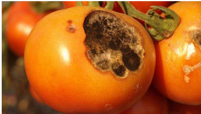
Figura 1. Mancha-de-Alternaria em Tomate.

A mancha-de-alternaria (Figura 1), causada pelo fungo Alternaria solani , apresenta sintomas e sinais que afetam diversas partes da planta, comprometendo seriamente seu desenvolvimento.