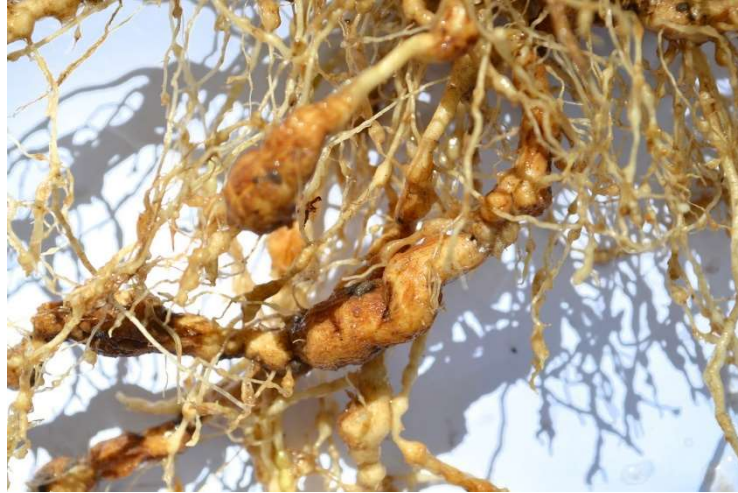
Figura 7. Nematóide-das-Galhas em Tomate.

vez que o nematoide compromete a absorção de água e nutrientes, causando sérios danos ao desenvolvimento da cultura (Kimati et al., 2005).