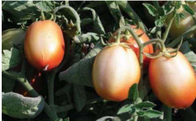
Figura 16. Temperaturas Altas em Tomate.