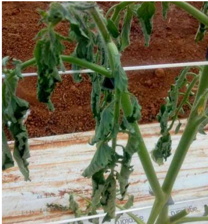
Figura 15. Falta de Água em Tomate.

A falta de água nas plantas de tomate (Figura 15) resulta em uma série de sintomas que refletem o estresse hídrico e a incapacidade da planta de realizar suas funções vitais.