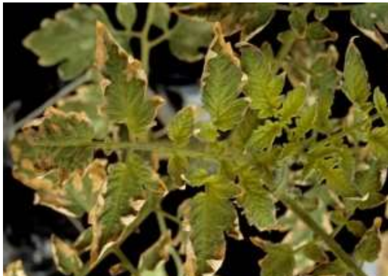
Figura 13. Fitotoxicidade por Boro em Tomate.

A fitotoxicidade por boro (B) (Figura 13) ocorre quando há excesso desse micronutriente no solo ou nas plantas, causando danos como manchas escuras, deformações nas folhas e frutos, murcha, coloração irregular e redução no tamanho da planta. Os frutos podem apresentar rachaduras e lesões, e há diminuição na produção de flores devido ao abortamento floral. O manejo adequado da adubação com boro é essencial para evitar esses problemas e garantir o crescimento saudável das plantas. (Minami & Haag, 1980).