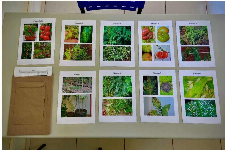
Figura 17. Materiais para Testes de Integridade e Usabilidade do Aplicativo.

passou por otimizações para melhorar a eficiência e a precisão do diagnóstico. Os testes foram realizados com imagens da literatura, simulando o campo real, incluindo tomateiros saudáveis para comparação. Como exemplificado na Figura 17, cada conjunto de imagens vinha em um envelope, acompanhado de um menor contendo o problema agrônômico predefinido, evitando sabotagem. Um questionário avaliou a usabilidade do aplicativo, testado em computador.