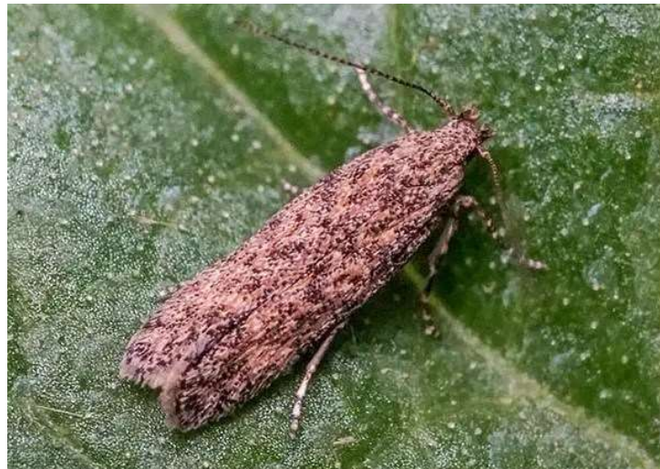
Figura 10. Traça-do-Tomateiro em Tomate.

planta, que adquire uma aparência atrofiada, e frutos de tamanho reduzido, deformados e com coloração irregular. As folhas apresentam pequenas perfurações redondas, frequentemente acompanhadas de necrose, com bordas amareladas ou necróticas, visíveis a olho nu, muitas vezes no formato de galerias criadas pelas larvas. Os danos também afetam as flores e frutos (principalmente os verdes), com perfurações e necrose. Dentro das galerias ou folhas, as larvas podem ser vistas, com coloração esbranquiçada a amarelada. Nos frutos severamente infestados, surgem buracos profundos, levando ao apodrecimento. Além disso, é possível observar mariposas pequenas (6 a 9 mm), de asas marrom claro a escuro, com manchas claras e escuras. As larvas causam galhas e túneis nas folhas e caules, destruindo o tecido interno da planta e comprometendo sua saúde e produtividade (Gallo et al., 2002).