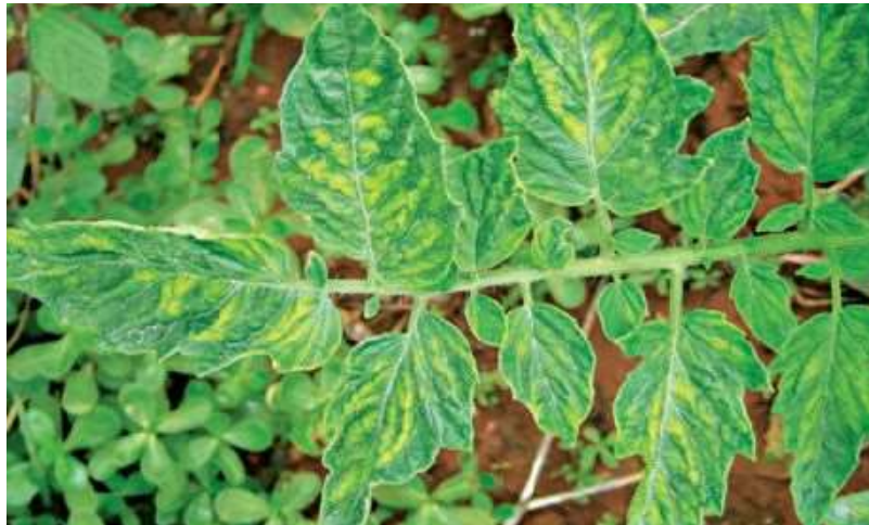
Figura 5. Mosaico-Dourado em Tomate.

desenvolvimento das plantas. Nas folhas, manifesta-se por clorose em padrão de mosaico, alternando áreas verdes e amarelas, frequentemente acompanhada por deformações que as tornam menores, enrugadas e encarquilhadas. As margens das folhas podem apresentar enrolamento leve a acentuado, geralmente para cima, com veias esverdeadas contrastando com áreas cloróticas. A doença resulta em redução no tamanho da planta, que adquire uma aparência atrofiada e perde vigor, afetando também a produção. Os frutos se tornam menores, deformados e apresentam coloração irregular, enquanto as plantas severamente afetadas produzem menos flores e podem sofrer abortamento floral. Os sintomas tornam-se mais intensos em casos de alta infestação de vetores, destacando a necessidade de um controle efetivo da mosca-branca para minimizar os danos (Kimati et al., 2005).