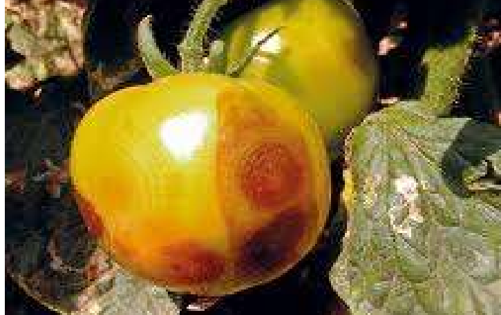
Figura 6. Vira-Cabeça em Tomate.