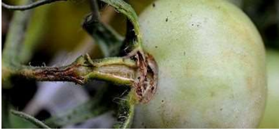
Figura 3. Cancro-Bacteriano em Tomate.

ameaça significativa à produção agrícola, demandando medidas rigorosas de controle (Kimati et al., 2005).