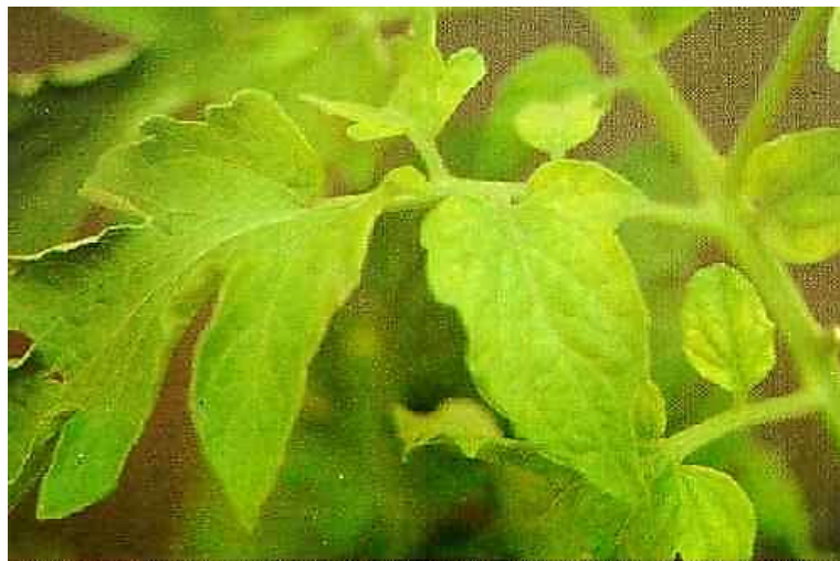
Figura 12. Deficiência de Nitrogênio em Tomate.

A deficiência de nitrogênio (N) (Figura 12) nas plantas resulta em uma série de sintomas visíveis que afetam tanto o crescimento quanto a produção. Um dos primeiros sinais é o amarelecimento das folhas (clorose), que ocorre de forma mais acentuada nas folhas mais velhas. A planta tende a ter uma redução no tamanho geral, adquirindo uma aparência atrofiada, e os frutos ficam menores, deformados e com coloração irregular. As folhas apresentam descoloração, variando entre um tom amarelo claro e esverdeado pálido. As folhas tornam-se finas, com margens irregulares e com coloração mais pálida. A murcha das folhas mais velhas é evidente, e elas podem cair prematuramente. A produção de flores é reduzida, resultando em maior taxa de abortamento floral, e a maturação dos frutos também é comprometida, com tomates amadurecendo de forma irregular ou com atraso significativo. O manejo adequado da fertilização nitrogenada é essencial para corrigir esses sintomas e promover o crescimento saudável das plantas (Minami & Haag, 1980).