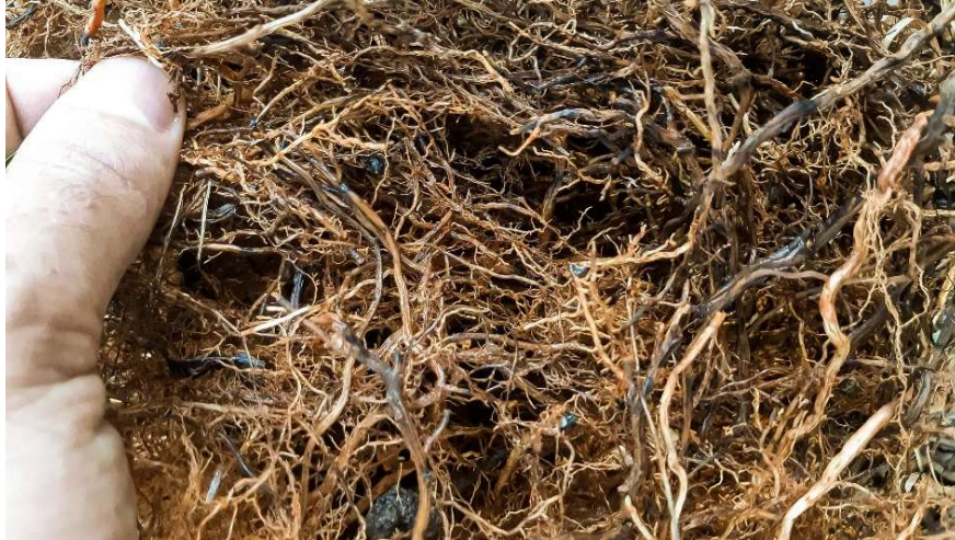
Figura 8. Nematóide-Lesão-Radicular em Tomate.

adequadamente água e nutrientes, comprometendo o desenvolvimento e a produção da planta (Kimati et al., 2005).