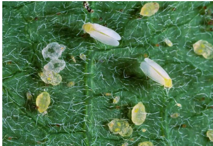
Figura 9. Mosca-Branca em Tomate.

A mosca-branca ( Bemisia tabaci ) (Figura 9) é um inseto que causa danos significativos às plantas, tanto diretamente, por sua alimentação, quanto indiretamente, ao ser vetor de diversos vírus. Os sintomas nas plantas incluem o amarelecimento das folhas (clorose), que pode ser acompanhado por deformações, com folhas se tornando menores, enrugadas e encarquilhadas. Em decorrência da alimentação da mosca-branca, os frutos podem ficar reduzidos em tamanho, deformados e com coloração irregular. A planta também apresenta murcha, desfolha gradual e ondulação nas bordas das folhas. Além disso, o vazamento de melado (secreção açucarada) pelas picadas do inseto pode levar ao crescimento de fumos (fungos negros) nas folhas. O inseto, de pequeno porte e coloração branca, com asas inclinadas, é frequentemente visível nas folhas inferiores e nos brotos das plantas, tornando-se um sinal claro da infestação. O controle da mosca-branca é essencial para evitar a propagação de doenças e minimizar os danos causados à planta (Gallo et al., 2002).