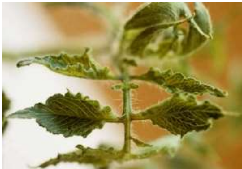
Figura 14. Fitotoxicidade por Cobre em Tomate.

A fitotoxicidade por cobre (Cu) (Figura 14) nas plantas é um distúrbio causado pela excessiva aplicação de cobre, resultando em uma série de sintomas que afetam a saúde geral da planta. As folhas apresentam pequenas manchas escuras que aumentam de tamanho ao longo do tempo, além de deformações, tornando-se menores, enrugadas e encarquilhadas.