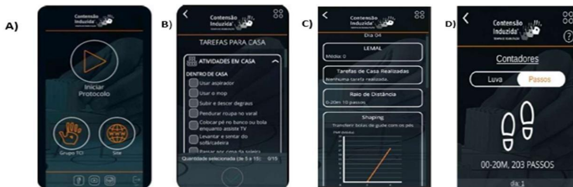
Figura 1: Aplicativo TCI Mobile

Telas TCI Mobile. A) Tela inicial do aplicativo. B) Lista de tarefas a serem realizadas em casa ou na comunidade. C) Relatórios sobre o desempenho durante as atividades da sessão de treinamento motor. D) Contador de passos.