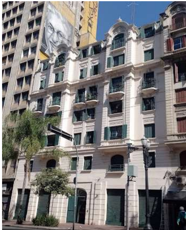
Fotografia 1 - Fachada do Edifício Palacete dos Artistas

O Palacete dos Artistas é um edifício construído em 1920, localizado na Avenida São João nº 605, região central da cidade de São Paulo e integra o conjunto de edifícios tombados por sua relevância cultural pelo CONDEPHAAT - Conselho de Defesa do Patrimônio Histórico, Arqueológico, Artístico e Turístico e CONPRESP - Conselho Municipal de Preservação do Patrimônio Histórico, Cultural e Ambiental da Cidade de São Paulo (São Paulo, 2014).