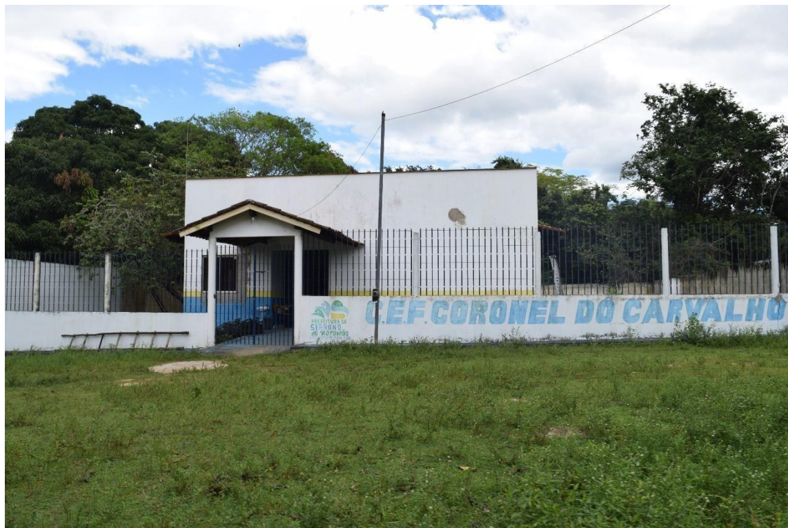
Imagem 5740 Escola primária de Soledade

Na imagem acima temos a fachada da escola primária de Soledade, ela atende atualmente crianças de primeira até a quinta série, as crianças menores não frequentam a escola na comunidade e as crianças maiores e adolescentes estudam em Serrano do Maranhão, há um transporte escolar público, mas como vimos o acesso a Soledade nos períodos chuvosos são de difícil acesso, assim muitas vezes não conseguindo fazer seu trajeto da escola até a comunidade prejudicando a frequência escolar das crianças e adolescentes.