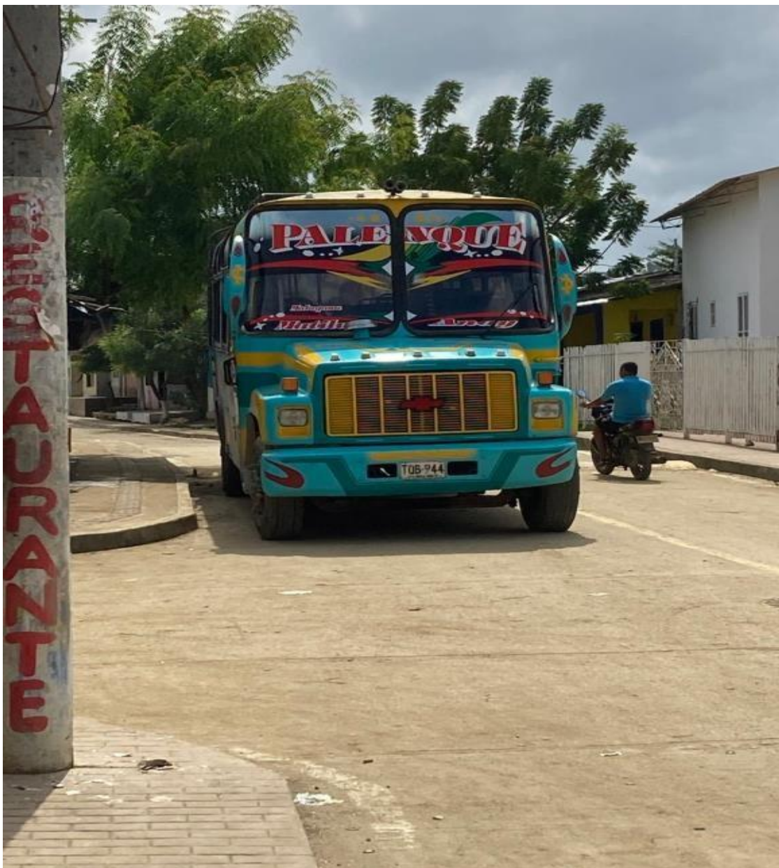
Imagem 20 Transporte de Cartagena a Palenque (2)

Nas imagens 19 e 20 , vemos o ônibus fazer o trajeto entre Cartagena a San Basilio de Palenque. São veículos coloridos e, na imagem 19 , é possível ler o nome “Palenque” pintado na lateral.