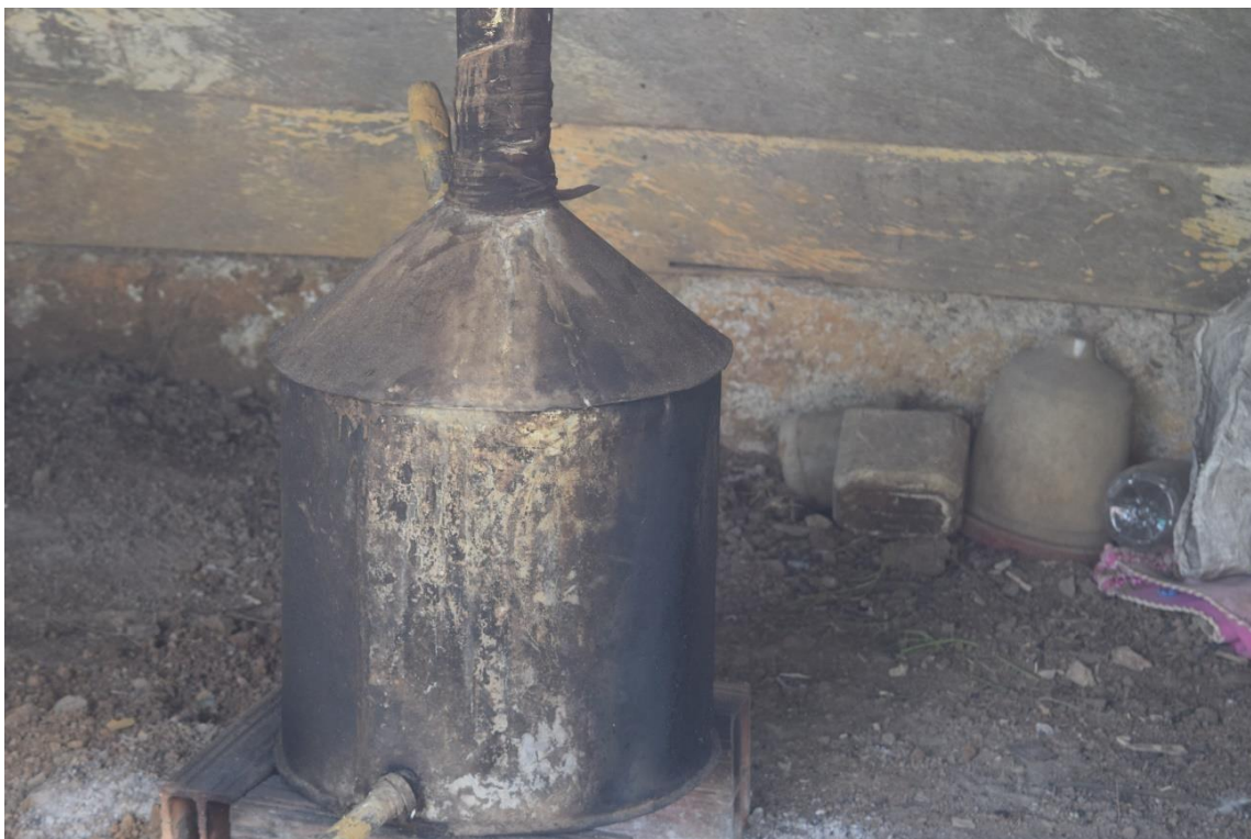
Imagem 6544 Destilador de cana-de-açúcar

Na imagem acima temos um destilador artesanal de cana-de-açúcar que faz uma espécie de cachaça consumida na comunidade, e com as ervas específicas forma-se o Ñeke , bebida artesanal muito consumida em San Basilio de Palenque.