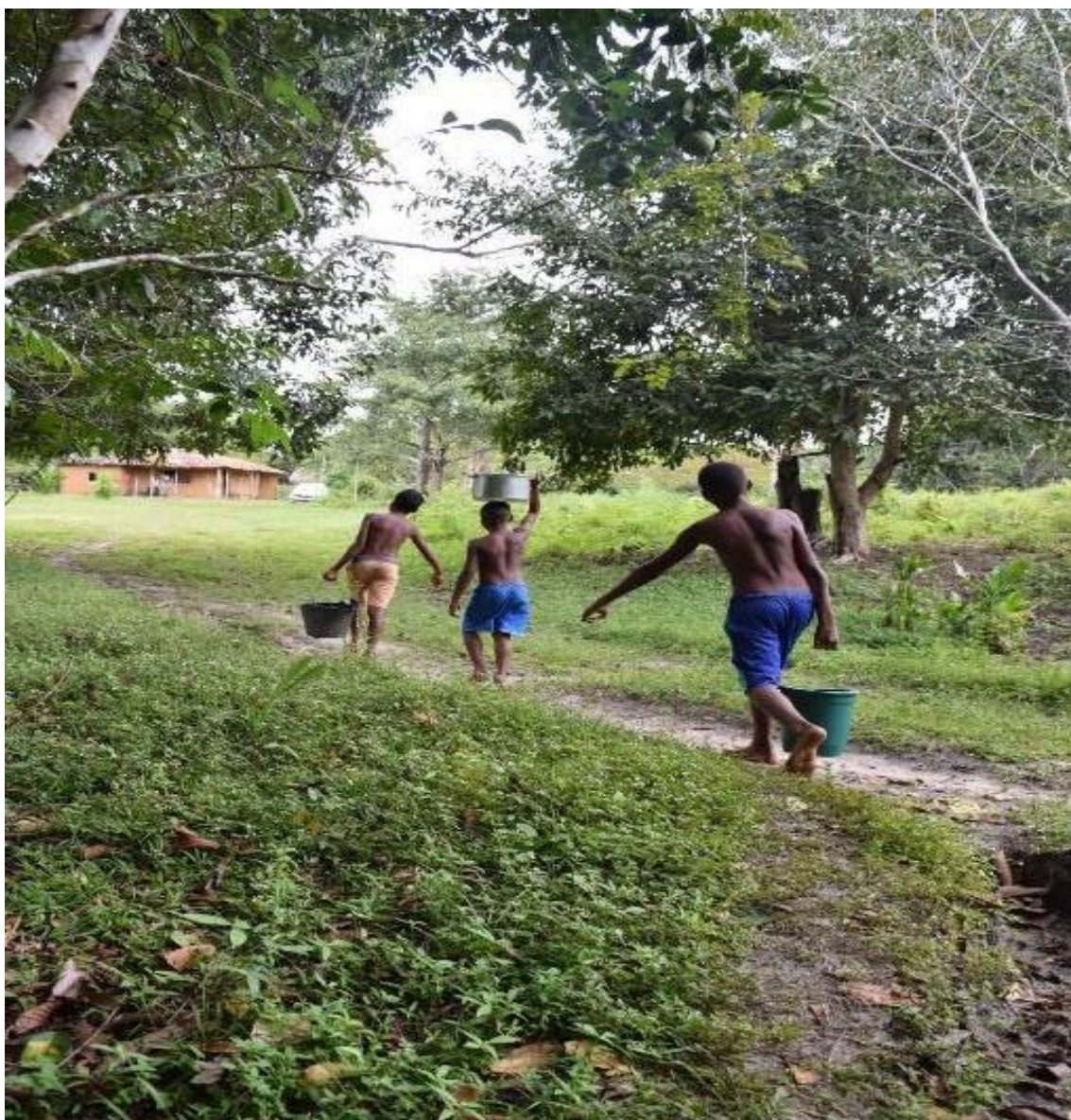
Imagem 15 As crianças levando a água para a cozinha

Como mencionado anteriormente, Soledade não conta com água encanada, desta forma precisam recorrer a água da cacimba.