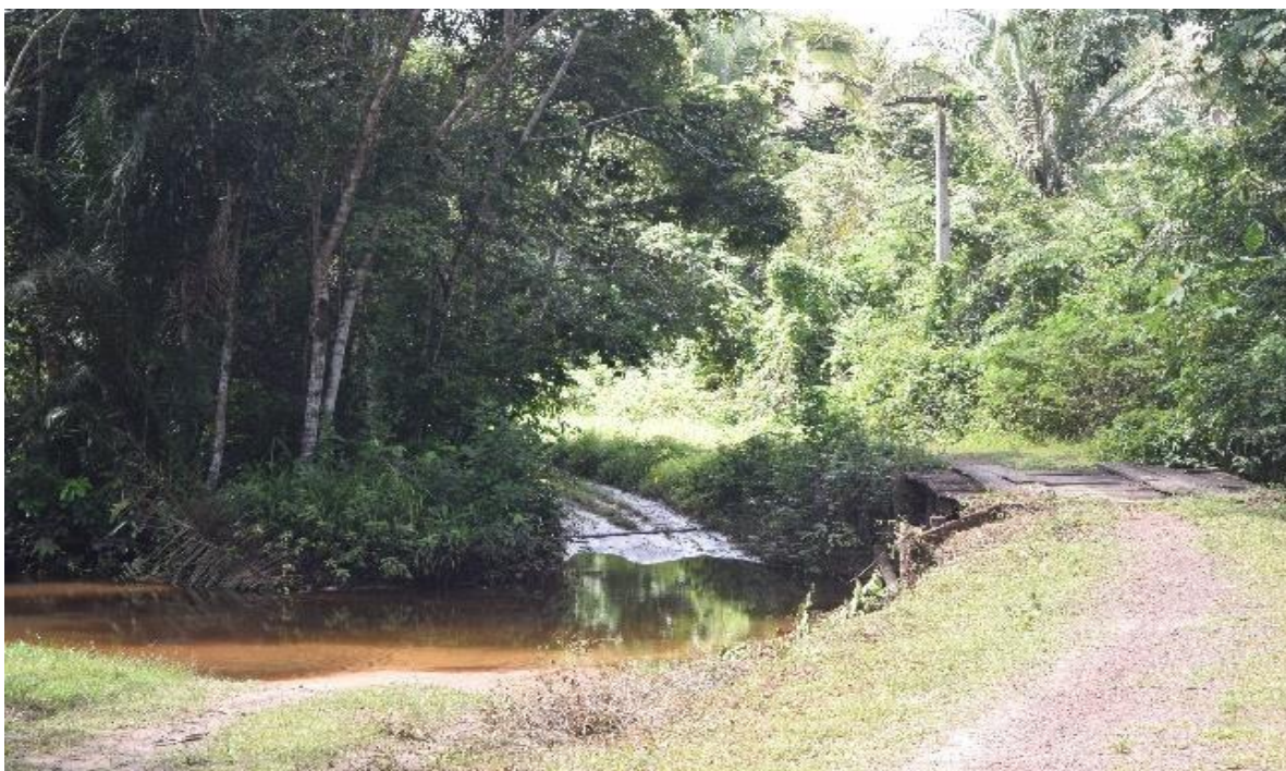
Imagem 2 Caminho para chegar a Soledade – ponte de madeira

Nesse momento, percorremos em estradas de terra, e percebemos que não foi a melhor época escolhida para estar na comunidade, pois em julho há chuvas, e as estradas estavam cheias de água, dificultando muito o acesso. A estrada seguia ficando cada vez mais escorregadia, não havia sinal de celular e estávamos apreensivas em chegar na comunidade com segurança.