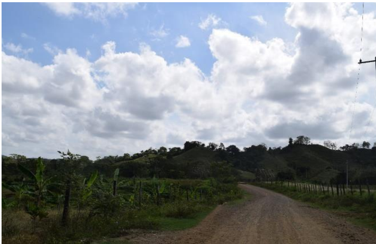
Imagem 30 Caminho até Palenque Antigo

Na imagem 29 , temos Sergio, o menino que me assustou com um facão na mão, ao mesmo tempo, foi muito cortês ao fazer questão de me levar ao Palenque Antigo, “pois uma mulher não pode andar sozinha”.