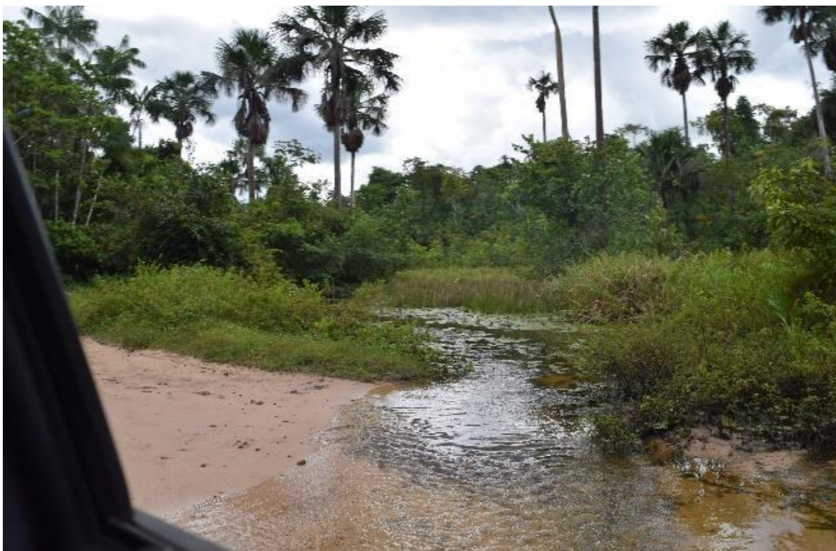
Imagem 3 Caminho para Soledade com partes alagadas

Na imagem 3 , podemos perceber como a água invade os caminhos da estrada. Estamos no período de maior concentração de chuvas na região – julho