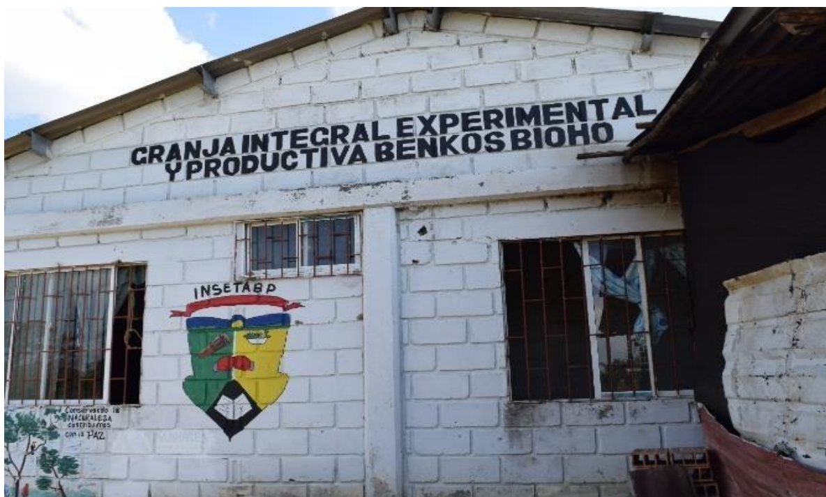
Imagem 36 Fachada da escola agrícola

A imagem 38 é da fachada da escola agrícola de San Basilio de Palenque, o que chama atenção que em seu nome há menção à Benkos Bioho, que para eles é o líder da comunidade e responsável pela liberdade de seu povo. Podemos notar ainda que, em sua parede há um brasão de San Basilio de Palenque que neles contêm suas principais “características” culturais: o tambor, um prato com ervas, um livro e um par de luvas de boxes, fazendo menção a Pambelé.