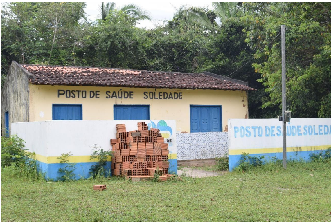
Imagem 59 Fachada do posto de saúde de Soledade