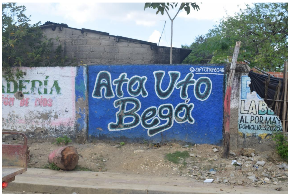
Imagem 50 Muro grafitado em língua palenquera (tradução Bem-vindo)

Por ello, es muy importante investigar, consultar y profundizar en nuestra lengua, nuestra medicina tradicional y el tambor. Quienes estén interesados en conocer y aprender sobre estos saberes, son bienvenidos.