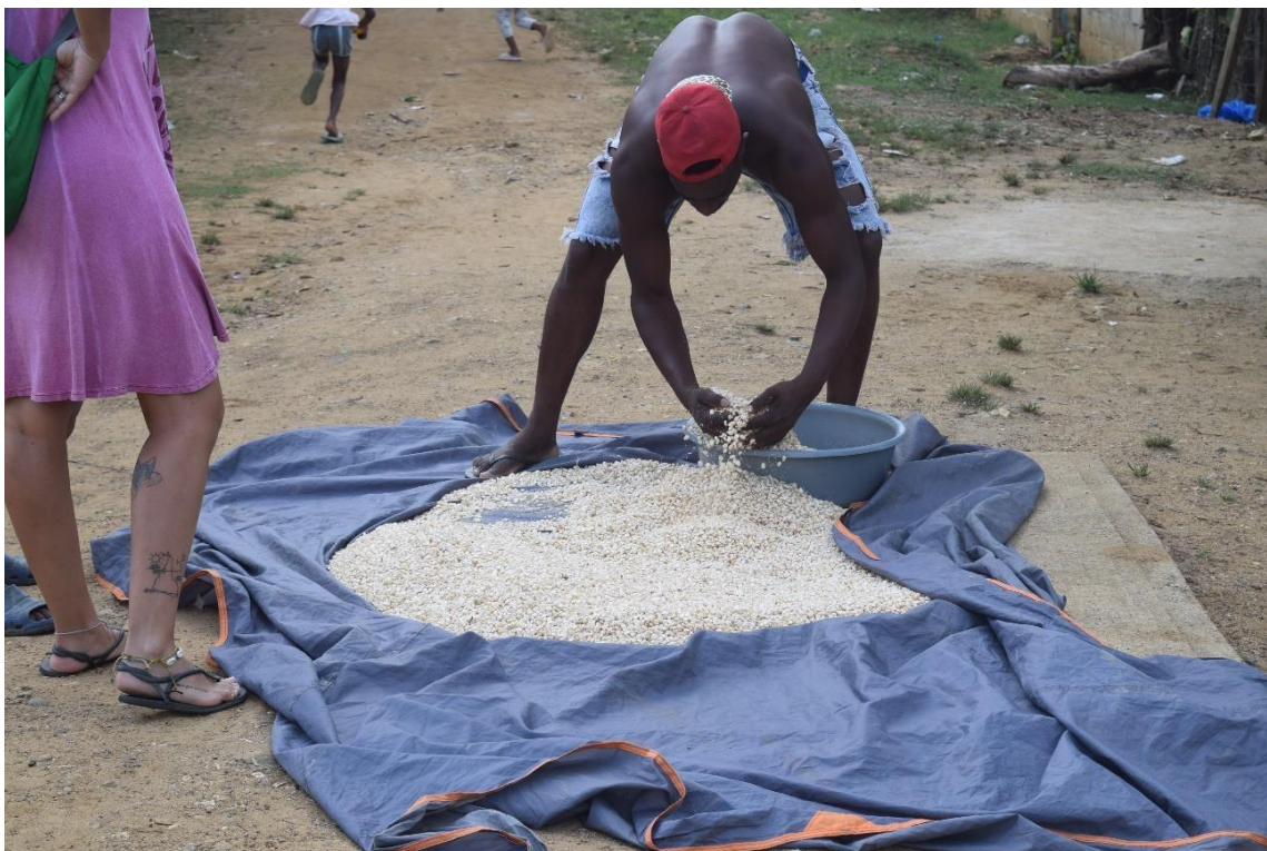
Imagem 6443 Secando aveia – base alimentar palenquera

Nas imagens 64 e 65 temos como exemplo alimentos que são a base alimentar em San Basilio de Palenque, a imagem 63 é de uma plantação de banana da terra, em espanhol plátano, que faz o prato chamado patacones (a banana é cozida e posteriormente amassada em um prato e frita), está na mesa do palenquero como complemento alimentar em todas as refeições. Na imagem 64 vemos um homem secando a aveia que depois é cozida e batida virando um suco muito consumido na comunidade.