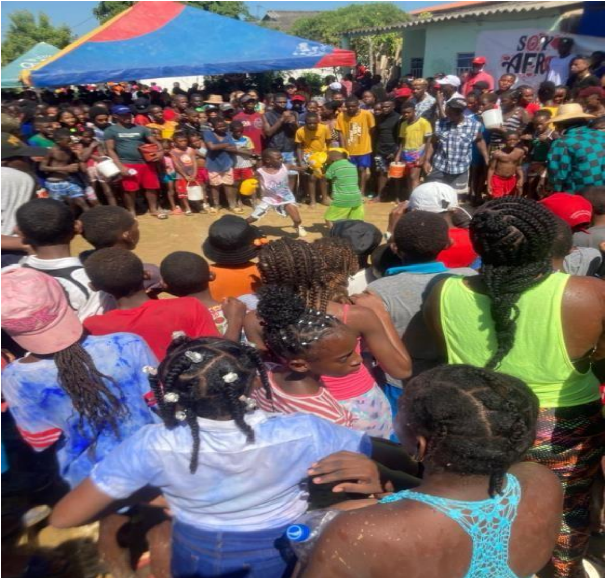
Imagem 42 Crianças lutando boxe

A imagem 42 , foi tirada no dia 20 de janeiro na festa de San Sebastián , podemos observar a roda de palenqueros, muitos com balde de água nas mãos e no centro da roda as crianças lutando boxe. Como dito anteriormente boxe é um esporte muito praticado em San Basilio de Palenque, isso se deve muito ao campeão Pambalé.