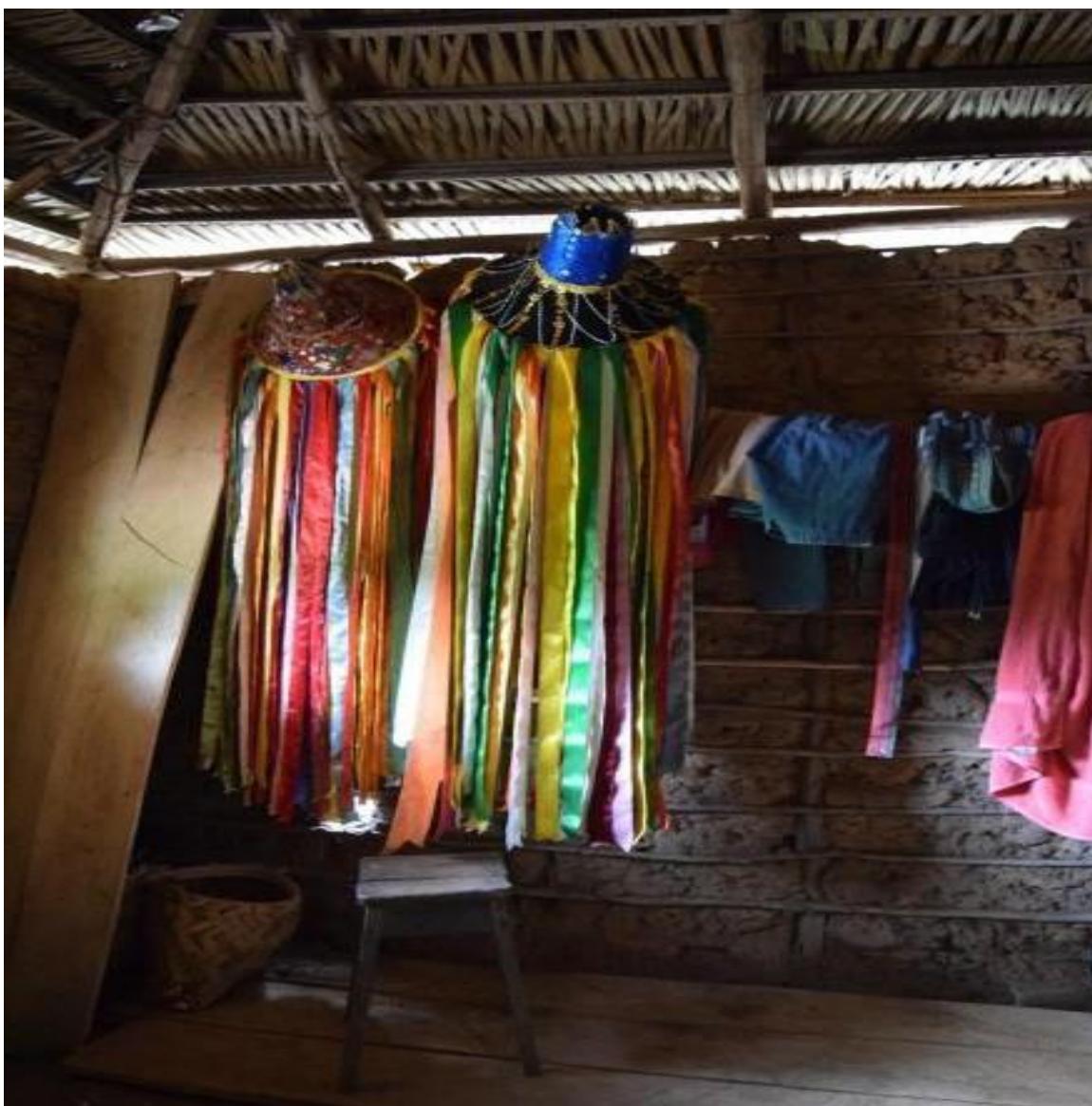
Imagem 17 Chapéus (indumentária) do Bumba-Meu-Boi de Soledade

A imagem 17 foi tirada no interior da casa de Maria do Socorro, ela é uma das costureiras das indumentárias do Bumba-Meu-Boi de Soledade. Pendurados no quarto entre as roupas da família, estão dois chapéus costurados e bordados por ela que fazem parte da brincadeira. Podemos notar também na imagem, a estrutura do chão que é coberto por tabuas de madeira, o telhado de palha e as paredes de barro batido, não tendo assim distinção do interior e exterior da casa.