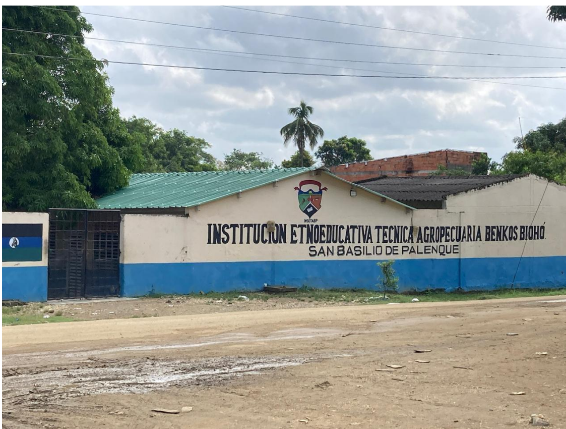
Imagem 62 Fachada da Escola de San Basilio de Palenque

Pero también aquí se utiliza mucho la medicina alternativa, la medicina natural, que es la nuestra. Hay muchas personas que, antes de ir al centro de salud, primero agotan todas las posibilidades que nos brinda la naturaleza. Es decir, recurren a las plantas, a los remedios tradicionales y a los saberes ancestrales, y solo después, si no hay mejoría, van al puesto de salud.