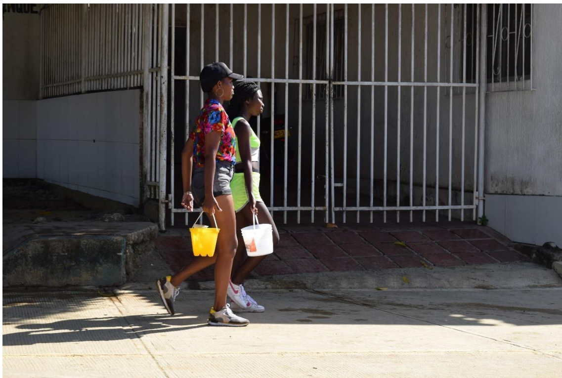
Imagem 5639 Fotografia de duas mulheres com balde de água nas mãos no dia de San Sebastián