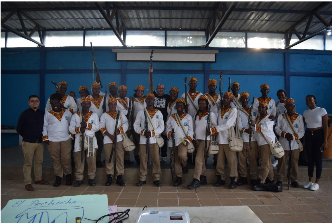
Imagem 66 Guardia Cimarrona no Encontro do Conselho Comunitário