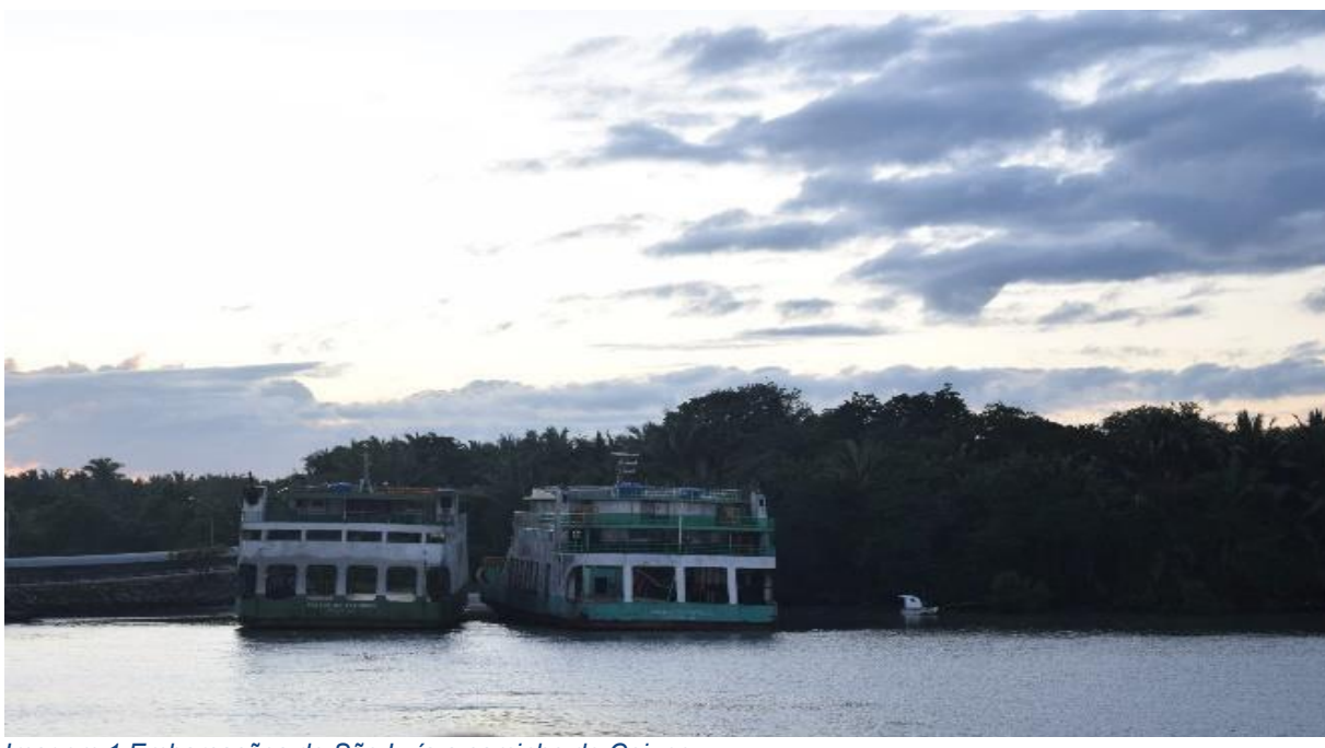
Imagem 1 Embarcações de São Luís a caminho de Cojupe