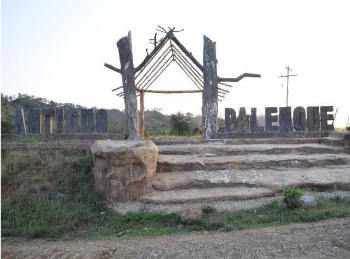
Imagem 33 Portal de entrada de Palenque Antigo

uma plantação pequena de inhame, sentei-me com ele nos pés de uma árvore e ele me contou que o sustento da família sai daquela roça, horas trocando mercadorias com outros trabalhadores, ora vendendo em Cartagena.