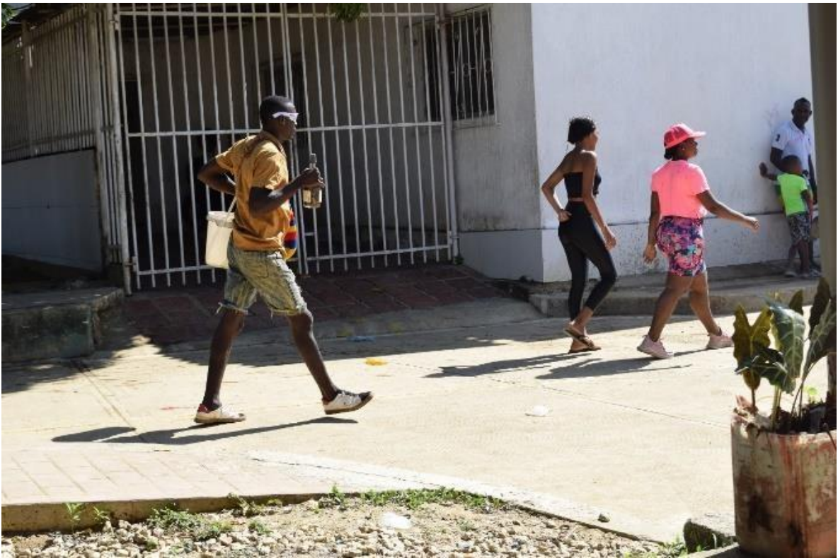
Imagem 40 Dia de San Sebastián

Podemos observar na imagem 40 um homem caminhando sentido a praça de San Basilio de Palenque com um balde de água na mão esquerda e uma garrafa de Ñeke, para aproveitar o dia de San Sebastián .