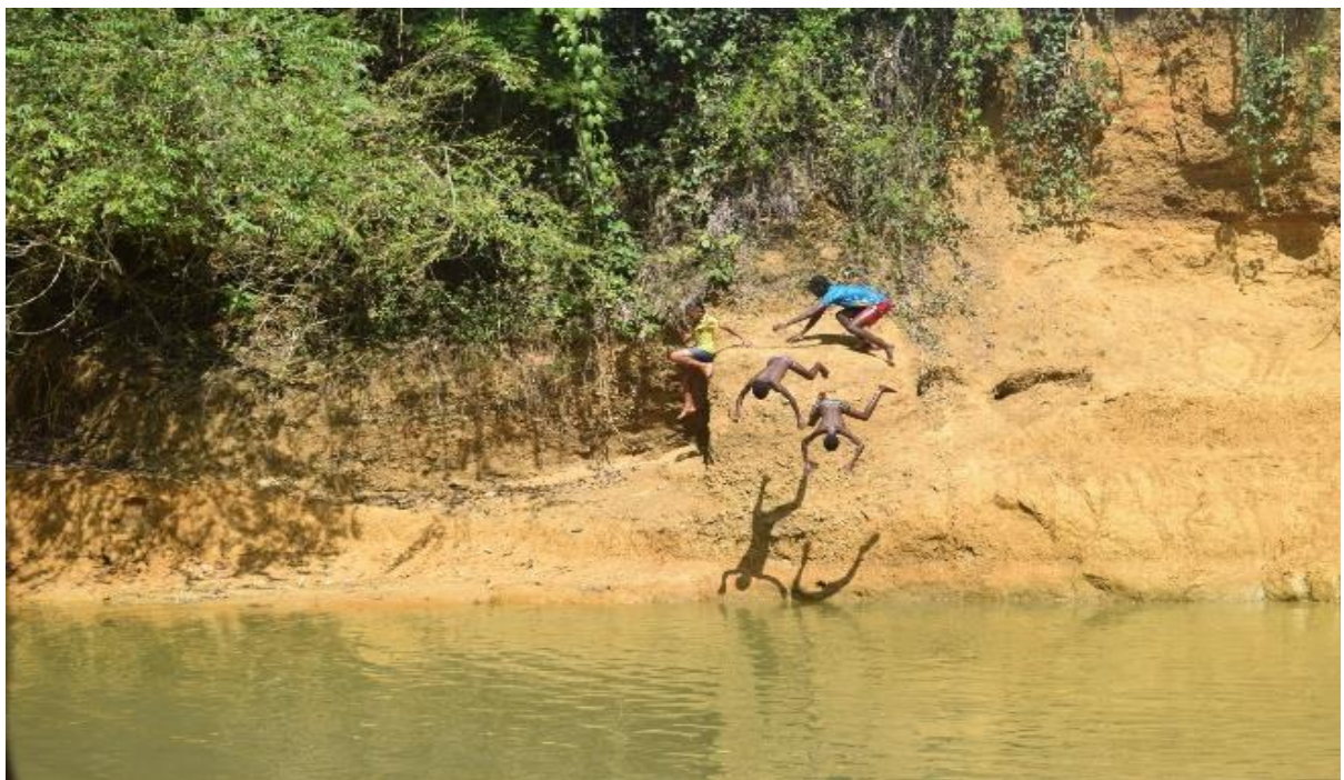
Imagem 37 Rio – parte masculina