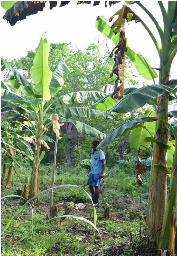
Imagem 63 Trabalhador rural na plantação de banana