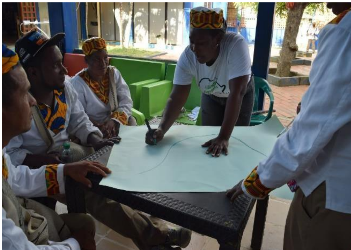
Imagem 25 Grupos de discussão durante o Encontro do Conselho Comunitário (2)

Um ponto interessante sobre esses dois dias de encontro é que no primeiro momento todos envolvidos discutiram sobre processos legais, com base em leis, o conselho participativo elencou também suas necessidades e por meio de votações selecionaram quais ações teriam prioridade.