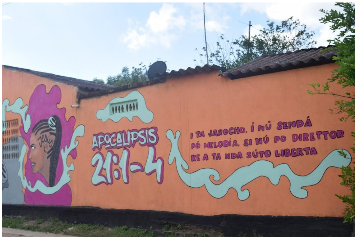
Imagem 54 Grafite em muro em San Basilio de Palenque com versículo da Bíblia escrito em lingua palenquera