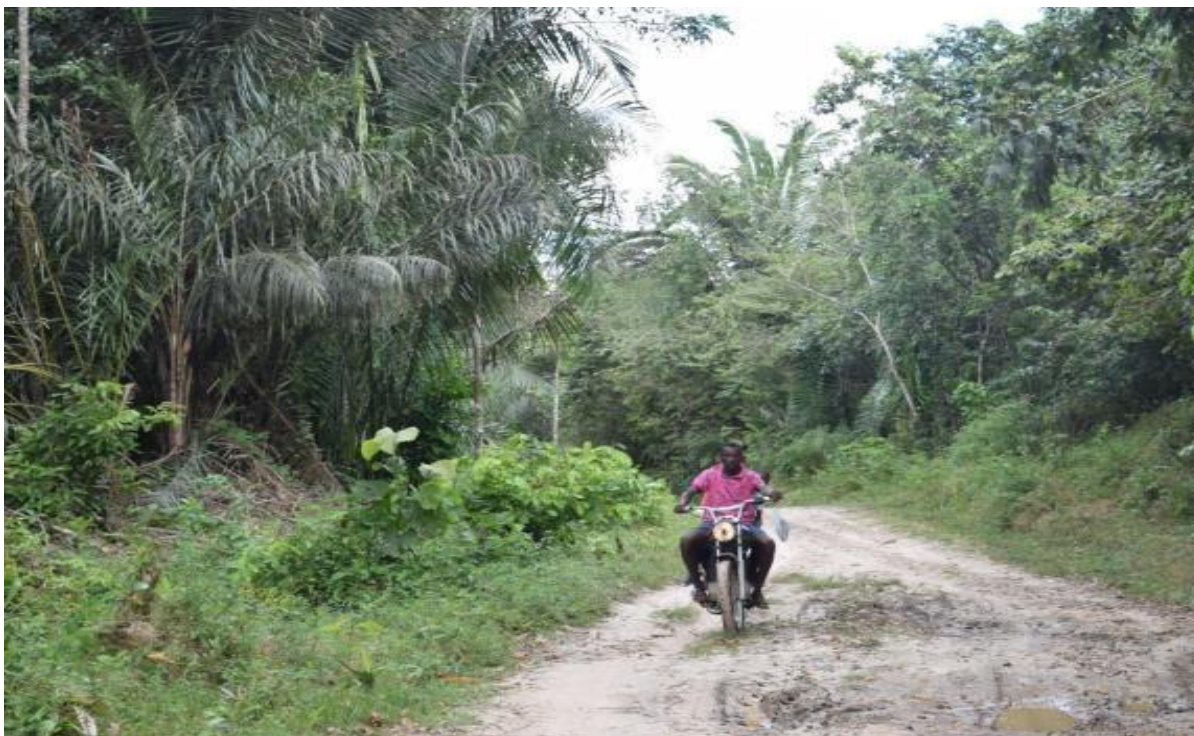
Imagem 4 Dois moradores de Soledade em uma moto

Devido ao alagamento das estradas e ao custo do transporte, a moto é o meio de locomoção mais utilizado em Soledade. Não há transporte público na comunidade, o que reforça sua importância. A imagem ao lado foi registrada no momento em que estávamos perdidos na estrada e dois moradores nos ajudaram indicando o caminho para Soledade.