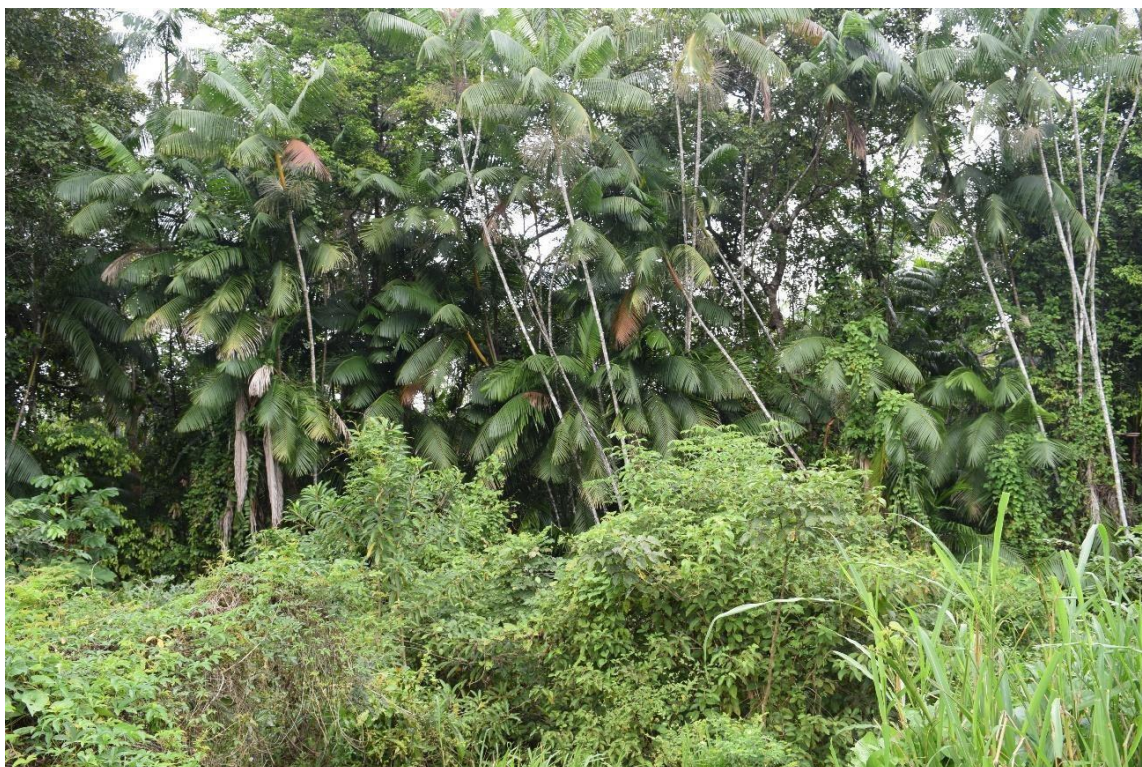
Imagem 6041 Árvores de juçara em Soledade