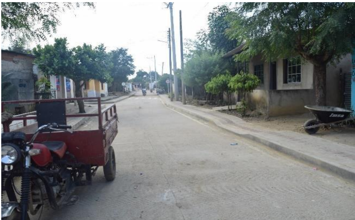
Imagem 32 Rua de Palenque (2)

As imagens 31 e 32 são das ruas de San Basilio de Palenque, podemos notar que na imagem 31 , a rua é de chão batido (solo árido como areia) e na imagem 32 , temos uma rua asfaltada.