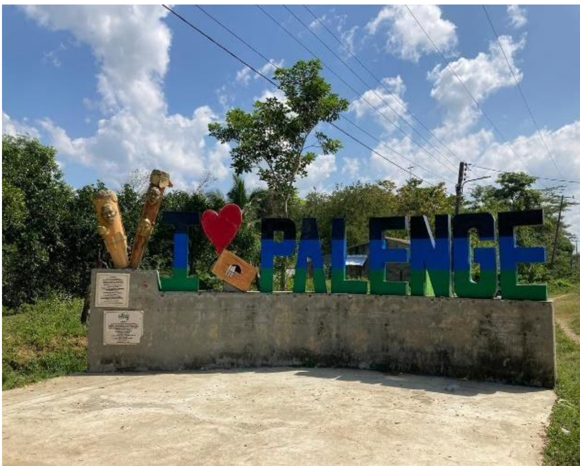
Imagem 21 Monumento na entrada de San Basilio de Palenque

Inicialmente, a estrada era asfaltada; em outros trechos, era de terra, as pessoas estavam com muitas sacolas e cantando no caminho; eu estava encantada com as belezas naturais que avistava no trajeto, até Aiden dizer que tínhamos chegado.