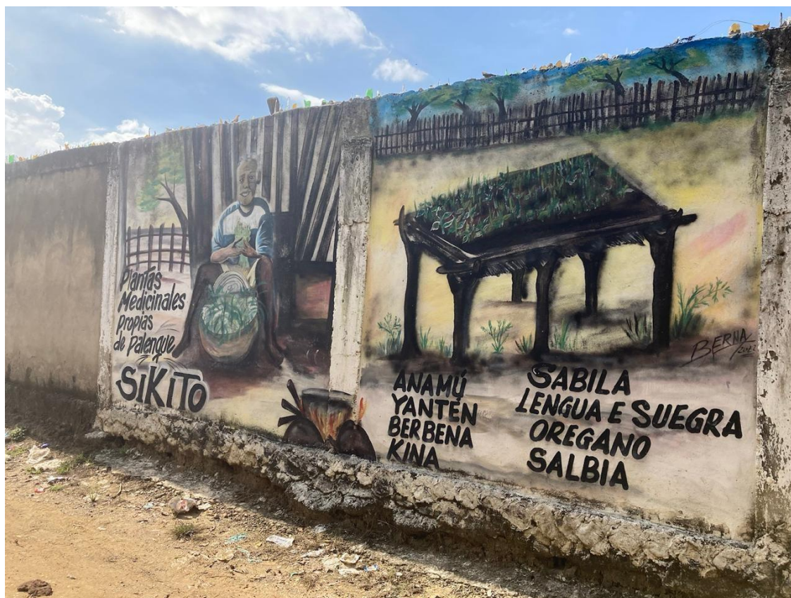
Imagem 5538 Muro de San Basilio apresentando a importância das plantas na medicina tradicional da

Recientemente, en el mes de diciembre, realizamos talleres en la universidad, trabajando incluso con la química de las plantas, para que estos saberes puedan ser reconocidos también a nivel internacional, incluso en Estados Unidos, con los nombres botánicos correspondientes.