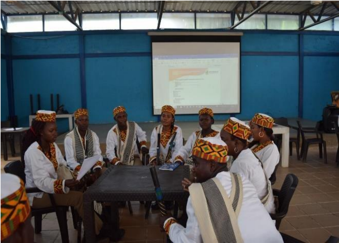
Imagem 24 Grupos de discussão durante o Encontro do Conselho Comunitário (1)