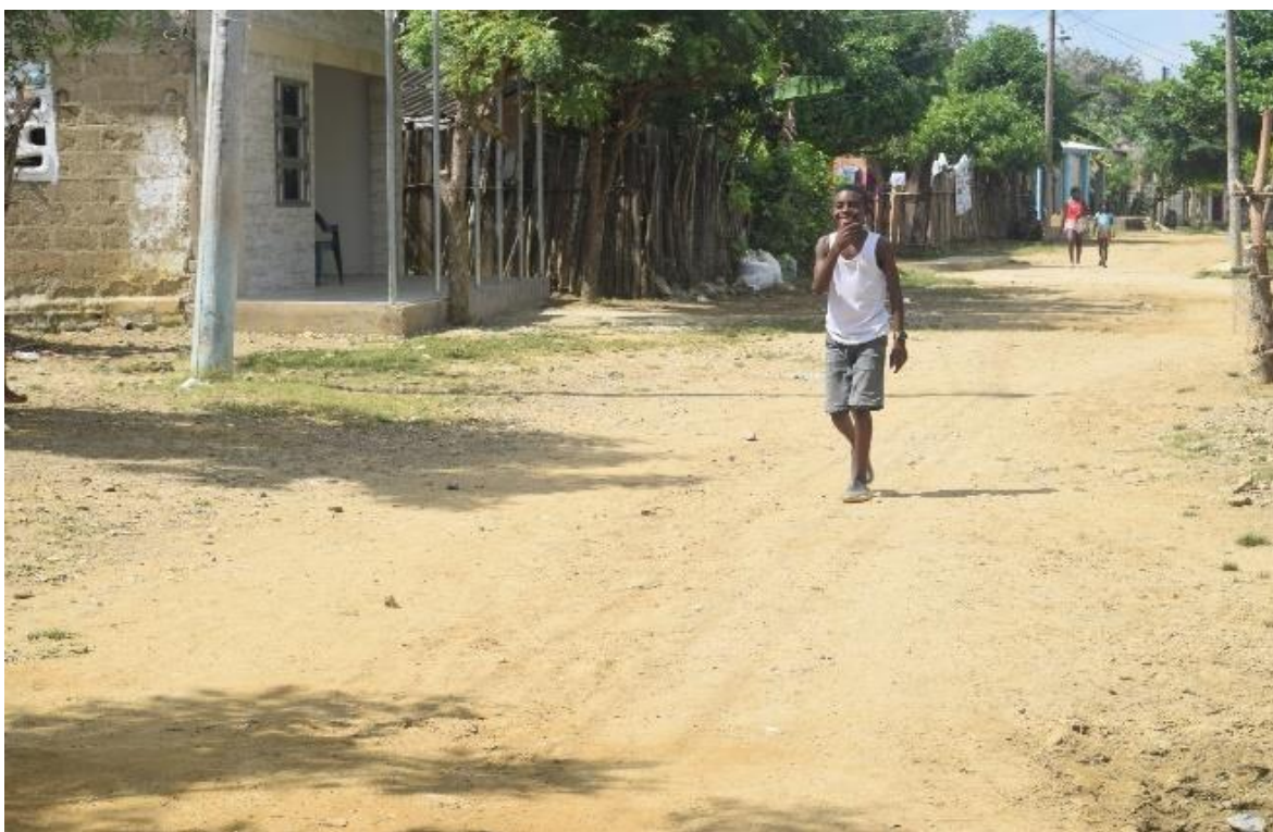
Imagem 31 Rua de Palenque (1)

Pude perceber em Palenque, que a comunidade vive com muito pouco, os acessos são escassos, mas por ser um território histórico, há muitas visitas turísticas e essa é uma forma de sobrevivência da comunidade, eu como uma pessoa estrangeira, lida imediatamente como turista, todos pela vila me ofereciam coisas para eu comprar como alegria 12 , cocada entre outras coisas, e as crianças sempre pedindo uma pratinha.