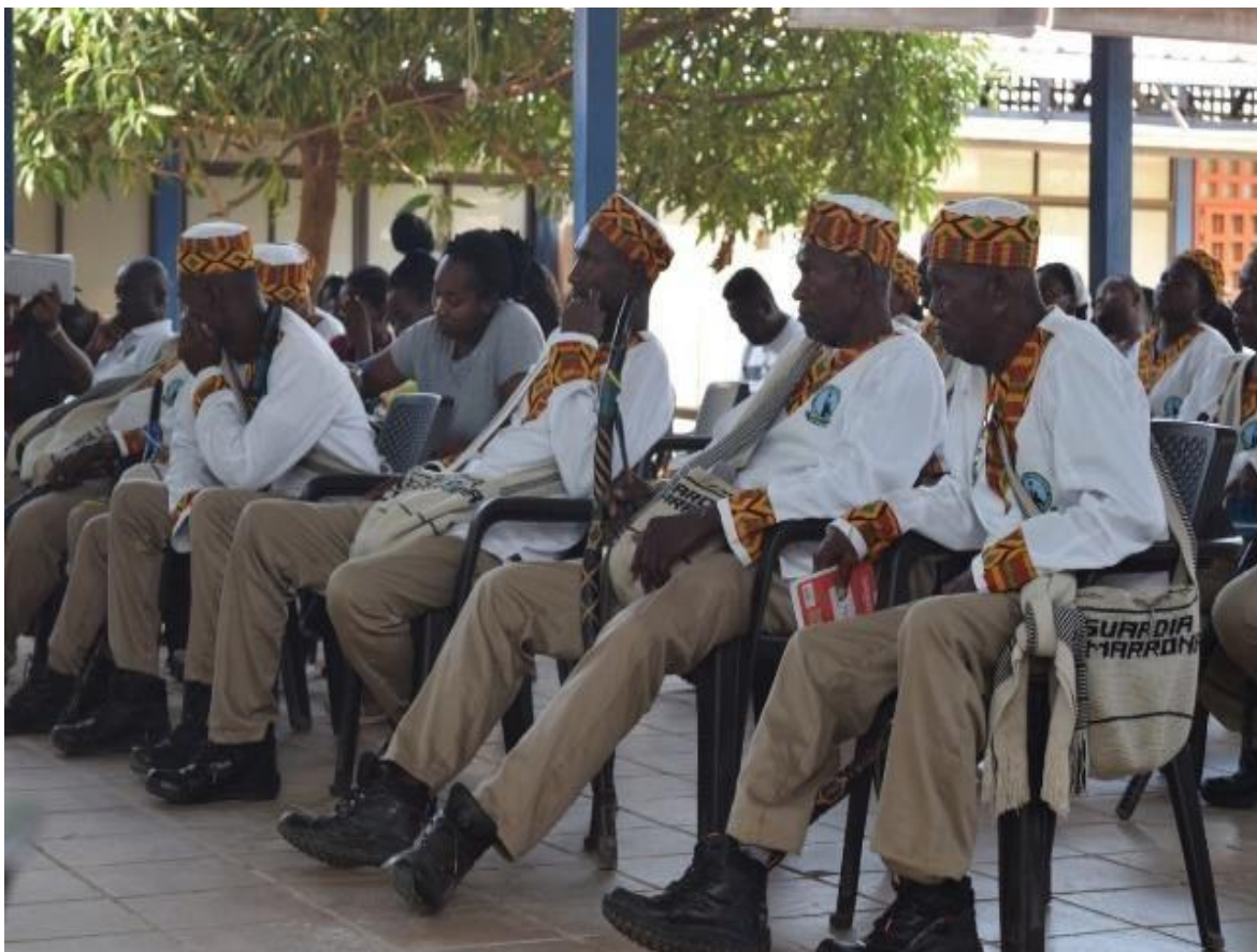
Imagem 27 Guardia Cimmarona no Encontro do Conselho Comunitário

Na imagem 27 , podemos notar que além da roupa, há presença de uma bolsa de tecido que eles carregam, como parte de seu traje.