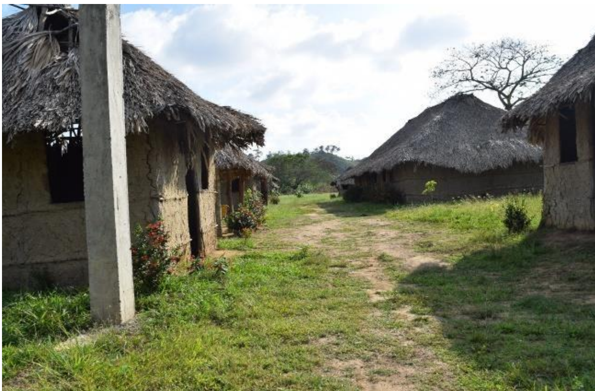
Imagem 34 Palenque Antigo