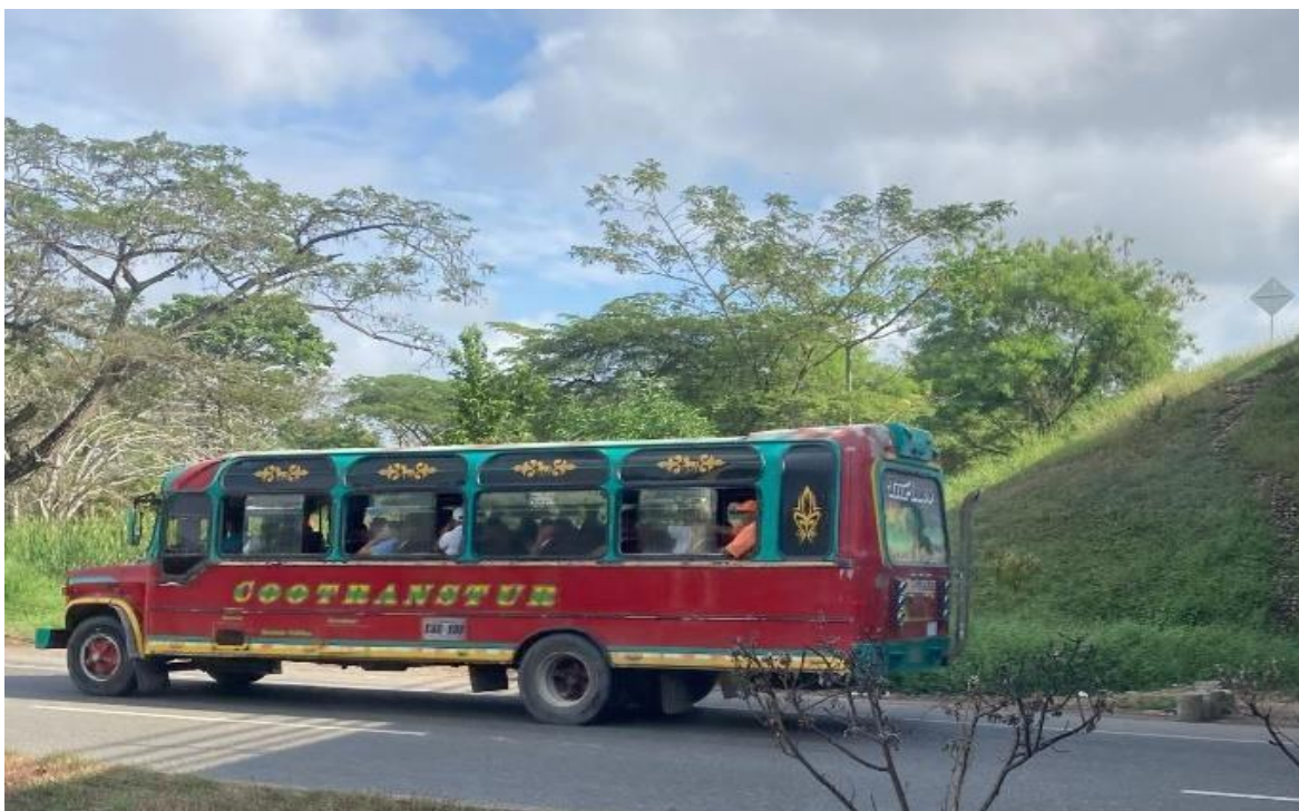
Imagem 19 Ônibus de transporte de Cartagena a Palenque