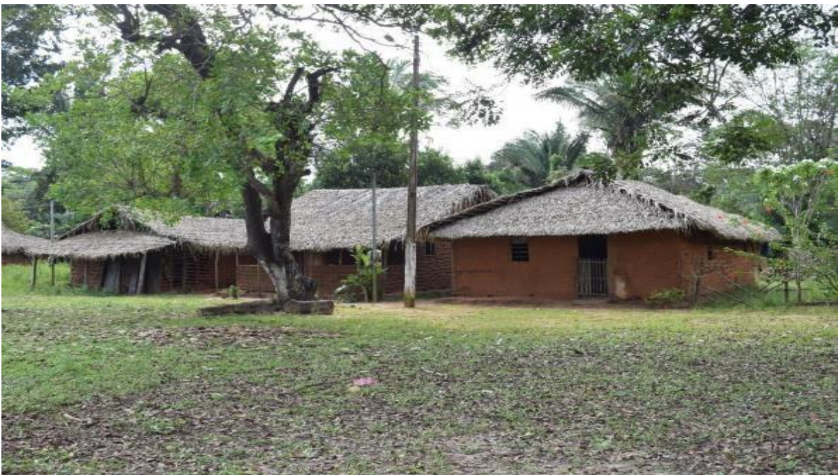
Imagem 7 Moradia de Soledade