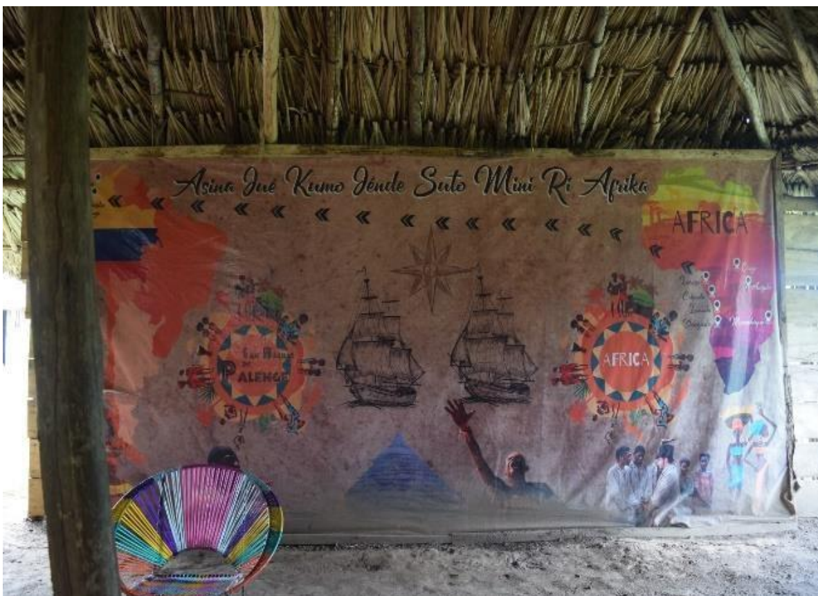
Imagem 35 banner exposto em Palenque Antigo

Na imagem 35 , ainda em Palenque Antigo, podemos observar um banner construído de couro. Esse banner mostra o continente africano e americano contando a história de como as pessoas escravizadas foram trazidas para a América. Podemos perceber que San Basilio de Palenque está escrito Palenge , o que seria a palavra palenque na língua palenquera. Na parte superior do banner temos escrito também em língua palenquera, Asina qué kuimo qénde suto mini ri Afrika , que numa tradução livre seria “assim que viemos de África.