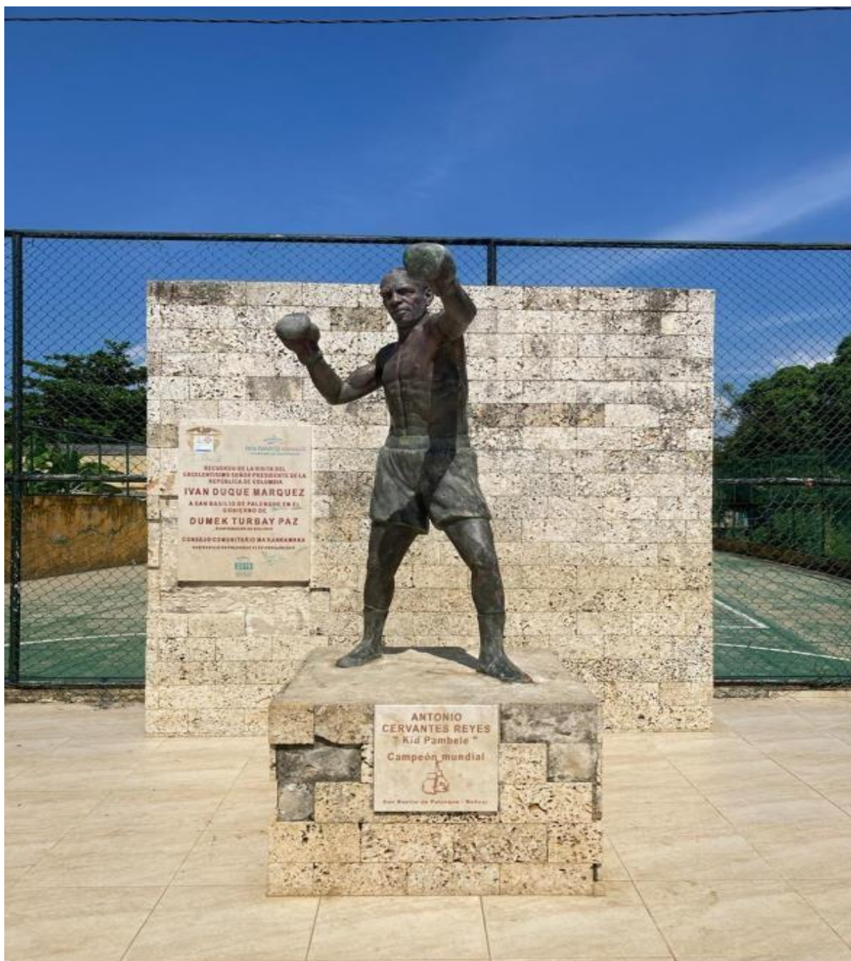
Imagem 41 Estátua de Kid Pambelé

A imagem 41, é da estátua de Antônio Cervantes “Kid Pambelé”, um palenquero campeão mundial de boxe nos anos 1972 e 1976 na categoria “wélter júnior”.