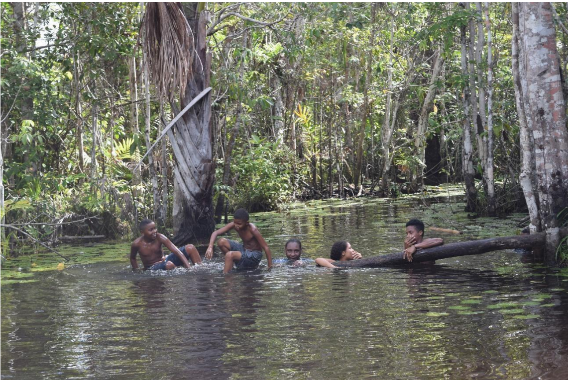
Imagem 52 Crianças brincando no açude em Soledade

Antes da pesquisa de campo em Soledade pelos dados que já tinha da comunidade durante minha pesquisa na construção da dissertação de mestrado, sabia que o Bumba-Meu-Boi de Soledade era um boi datado nos finais dos anos 1880, e como um boi centenário é tratado pela secretaria de cultura do estado como um patrimônio, conforme vemos na foto abaixo.