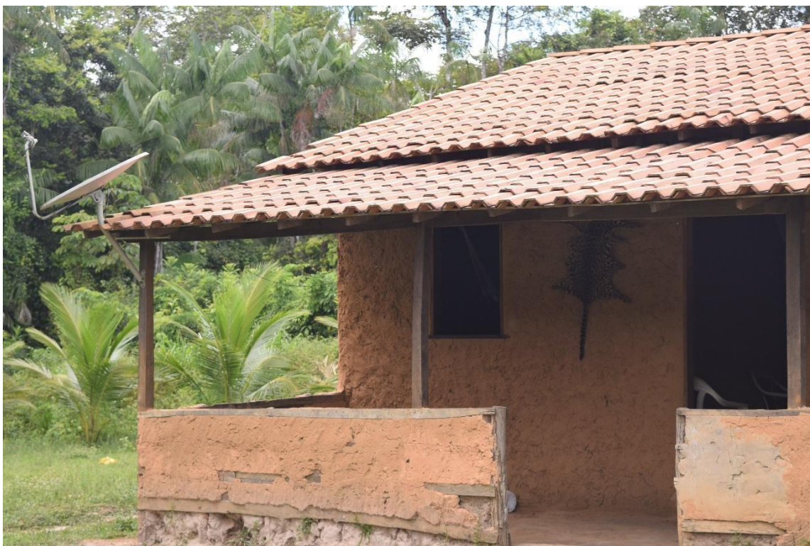
Imagem 6142 Fachada da casa de Denilson com a exposição da pele de uma onça parda caçada por ele