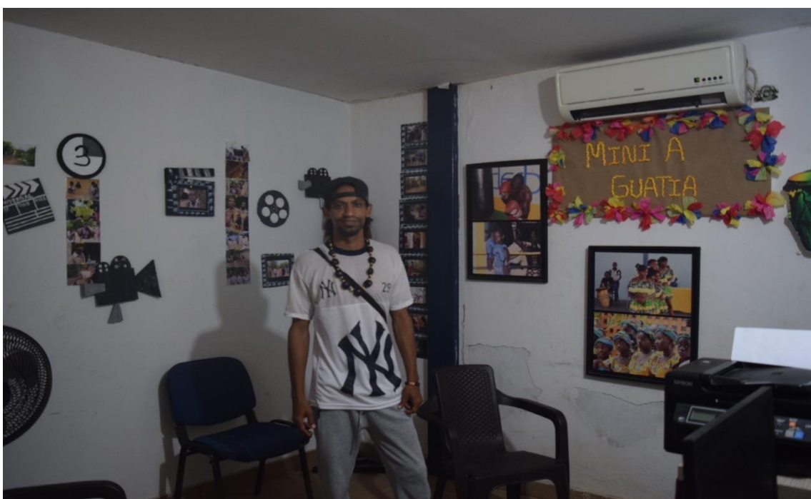
Imagem 4437 Diógenes no Centro Comunitário

En cuanto al sostenimiento de la Casa de la Cultura, esta cuenta con apoyo económico de la Alcaldía Mayor de Mahates, que se encarga de su adecuación y de los arreglos necesarios. En la Casa de la Cultura también funciona el Consejo Comunitario y se desarrollan diferentes proyectos que ayudan a su mantenimiento, como los proyectos dirigidos a los adultos mayores, incluyendo iniciativas de alimentación y encuentros comunitarios que se realizan aquí mismo. (Entrevista realizada em 18 de janeiro de 2023).