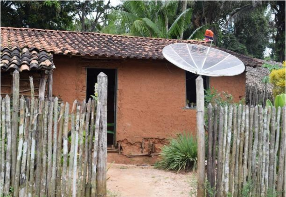
Imagem 6 Fachada de uma casa de Soledade