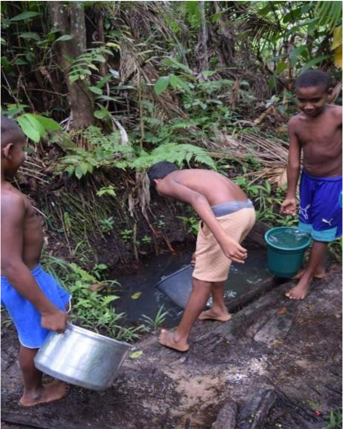
Imagem 14 As crianças tirando água da cacimba 10