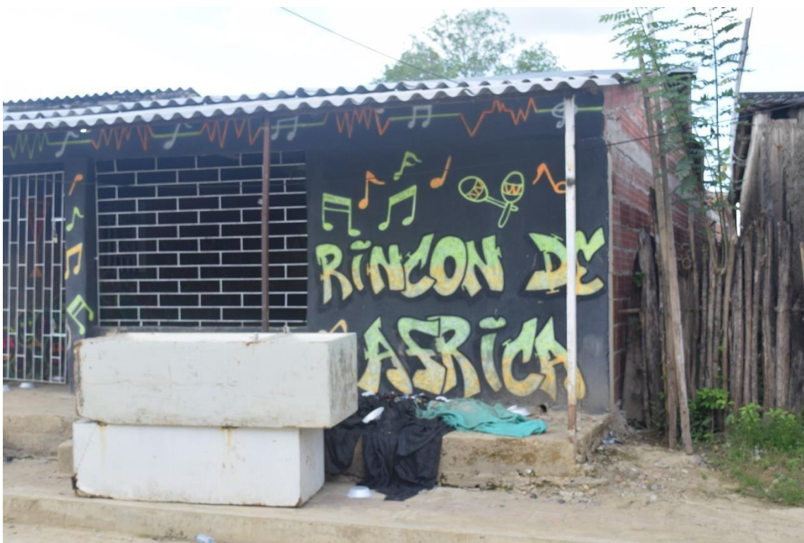
Imagem 49 Parede de um bar na comunidade de San Basilio de Palenque

Para mí, en especial, ser palenquero significa estar arraigado a las costumbres y al legado de quienes fueron traídos desde África. Ser palenquero es, para mí, ser un pedacito de África en Colombia. Hoy en día, todavía existimos como herederos de aquellos negros cimarrones que lucharon por su libertad. Fueron ellos quienes abrieron caminos entre la montaña y el monte, construyeron casas de barro y levantaron lo que se conoce como palenque, es decir, viviendas protegidas y rodeadas de palos. Estos palenques fueron construidos por los africanos y afrodescendientes que huyeron del yugo español en aquellos tiempos, bajo el liderazgo de Benkos Biohó, y así se formaron muchos palenques. Sin embargo, el que más resistió y el que ha logrado mantenerse con mayor fuerza en sus costumbres, su cultura y su lengua es el Palenque de San Basilio.