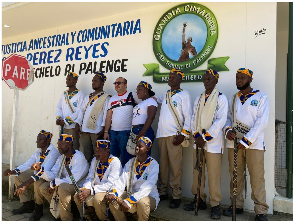
Imagem 6745 Membros da Guardia Cimarrona em frente a sede