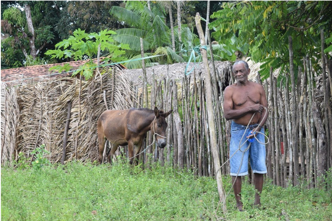
Imagem 58 Trabalhador rural de Soledade

Na imagem 58 temos morador de Soledade levando um burro, esse é o meio de transporte de trabalho mais utilizado na comunidade, ao fundo podemos notar uma cerca de paus e algumas folhas que cobrem a casa (uma parte do telhado de alvenaria e outra de palha, podemos ainda observar que há árvores frutíferas em seu quintal, como mamão, banana e coco, em exemplo da agricultura familiar de Soledade.