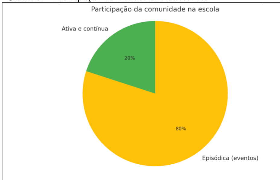
Gráfico 2 – Participação da comunidade na Escola