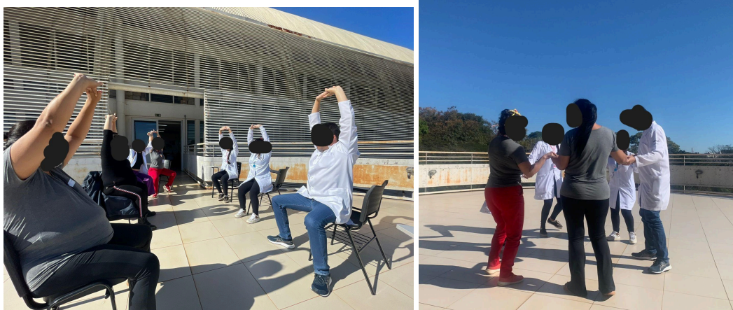
Figura 7 - Alongamento na gestação/ dança

Nesse encontro, foi realizada uma sessão de alongamento conduzida pelo educador físico do Hospital Universitário, com o objetivo de estimular a prática de alongamentos durante a gestação. A atividade visou aliviar dores e desconfortos musculares, além de melhorar a flexibilidade, um benefício especialmente relevante para o período gestacional. Complementando essa iniciativa, foram criados passos de dança e realizadas coreografias ao som de músicas típicas de festa junina, demonstrando que a dança é uma forma agradável e eficaz de atividade física, facilmente integrada à rotina das gestantes.