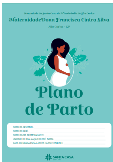
Figura 5 - Plano de parto