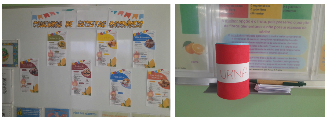
Figura 6 - Mural do concurso de receitas juninas saudáveis