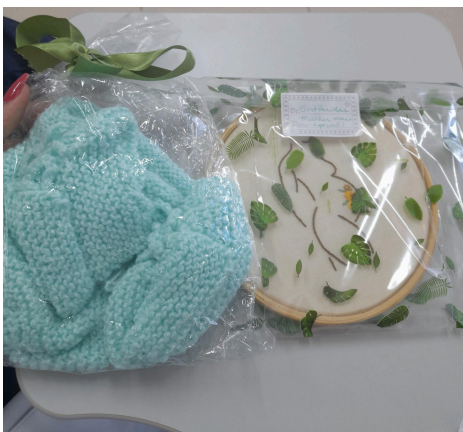
Touca de crochê e bordado representando a gestação

Encerrando o ciclo de atividades do mês junino, foi realizada uma festa temática no ambulatório, com comidas típicas saudáveis elaboradas pelos funcionários e gestantes. Durante o evento, foram discutidos temas importantes, como o aspecto social da alimentação, porções adequadas, indução do parto e as fases do trabalho de parto.