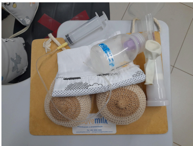
Figura 9 - Materiais utilizados para o tema amamentação