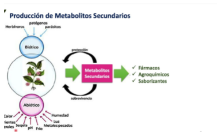
Imagem 11: Metabólitos secundários