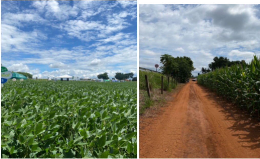
Imagem 10: Campo de soja e milho