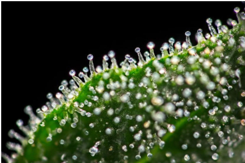
Imagem 1: tricomas na superfície de uma folha

Além disso, os tricomas formam uma barreira fisiológica, contra a perda de água por exemplo, assim como podem proteger contra a radiação UV, além de afetarem os movimentos, os tricomas em forma de gancho, prendem os insetos ou podem perfurá-los (HANLEY et al., 2007). Foi feita uma pesquisa onde foi retirado os pelos das folhas de Silene dioica , raspando da superfície das plantas, e foi visto que o vegetal ficou mais suscetível ao ataque de caracóis terrestres, além de diminuir em 70% a movimentação da lagarta Battus philenor por isso é importante ter essa estrutura morfológica das plantas (WESTERBERG e NYBERG, 1995).