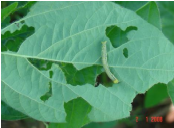
Imagem 4: Ferimentos nas plantas causado por insetos.

Os ferimentos podem influenciar no mecanismo de defesa de plantas, os insetos se alimentam de folhas cortando os tecidos em pedaços, gerando várias lesões na superfície da folha, e assim as plantas conseguem discernir os ferimentos, pois o impacto gera sinais para que a planta ative seu sistema de defesa (MITHOFER, BOLAND, 2008).