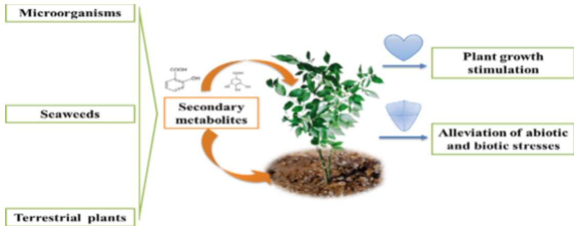
Imagem 5: Metabólitos secundários das plantas